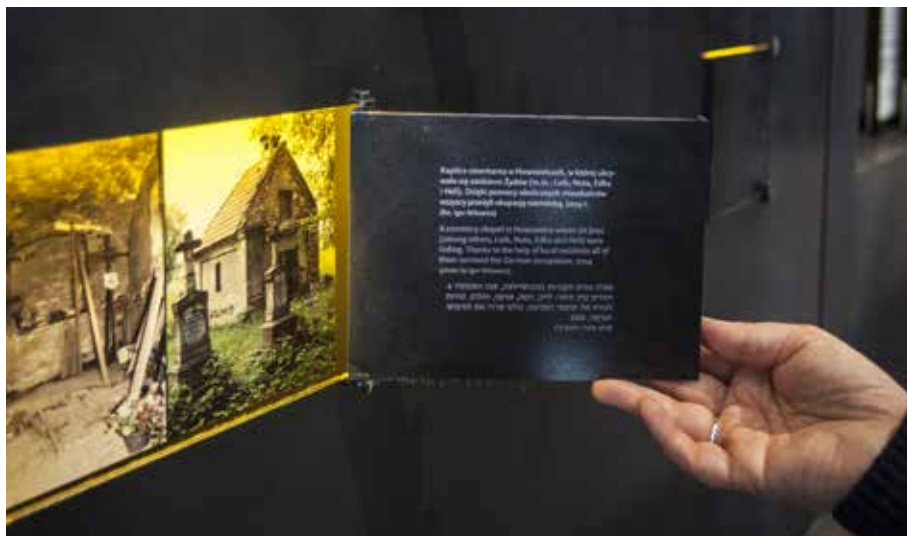
Fragment multimedialnej ekspozycji Muzeum w Markowej, marzec 2016 r.