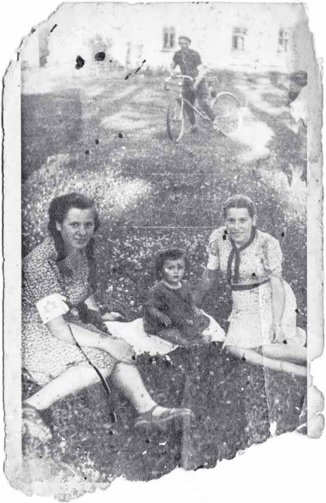
Żydowskie mieszkanki Markowej podczas okupacji; zdjęcie Józefa Ulmy. Plamy na fotografii to ślady krwi ofiar mordu z 24 marca 1944 r.