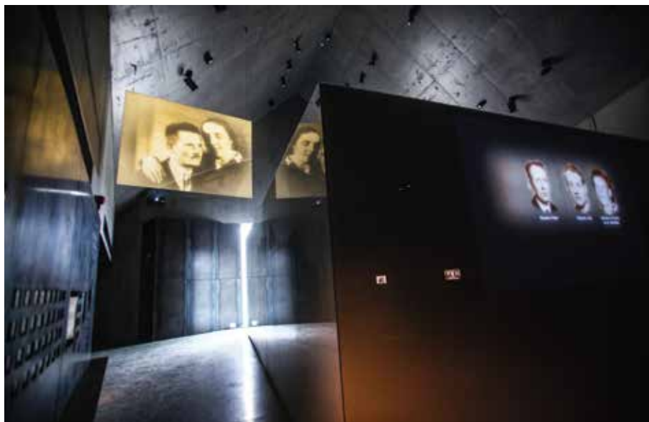
Wnętrze Muzeum w Markowej, marzec 2016 r.