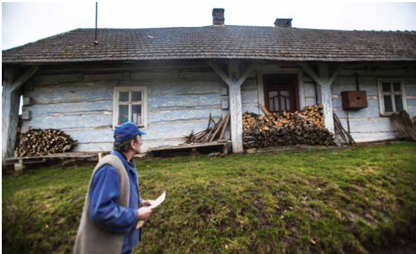
Także w tym domu podczas wojny ukrywano żydowskich sąsiadów. Markowa, marzec 2016 r.

→ w danym obszarze – mamy np. członka komisji, który zna i polski, i francuski. Następnie pisze on raport, dodaje swoje sugestie. Sprawa zostaje wpisana do kalendarza obrad komisji. Gdy komisja zbierze się w danej sprawie, raportujący przedstawia temat i zaczyna się dyskusja. Bywa ona żywa, wiele kwestii rozpatruje się krytycznie.