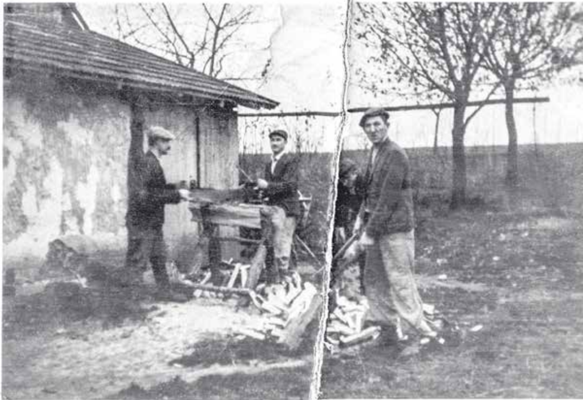
Goldmanowie przy cięciu i rąbaniu drewna na opał w obejściu Ulmów, gdzie się ukrywali.

↳ trzy litrowe butelki wódki, pogrozili Polakom zajętym chowaniem ciał i odjechali.