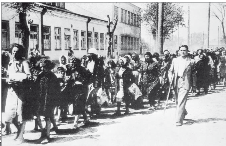
■ Litewskie Żydówki prowadzone na miejsce straceń przez miejscowych kolaborantów

Nie ma porównania. Symptomatyczna jest tu historia żołnierza niemieckiego w Kopenhadze, który został skazany w 1944 roku na kilka lat więzienia za to, że zabił Duńczyka na ulicy. Zrobił to za to, że Duńczyk splunął mu pod nogi. W sądzie tłumaczył się, że tak samo robił w Warszawie, gdzie za takie zachowanie dostawał pochwały. Karą za ukrywanie Żydów było zwykle więzienie. Nie ma sensu jednak porównywać sytuacji Polski z Holandią czy Danią. Trzeba ją porównywać z takimi miejscami, jak Ukraina, Białoruś czy Litwa. Krótko mówiąc, tam, gdzie mieszkała przeważająca liczba Żydów europejskich. To są punkty odniesienia dla nas. I wszędzie tam kara śmierci była stosowana równie szczerze. —rozmawiał Oskar Górzyński