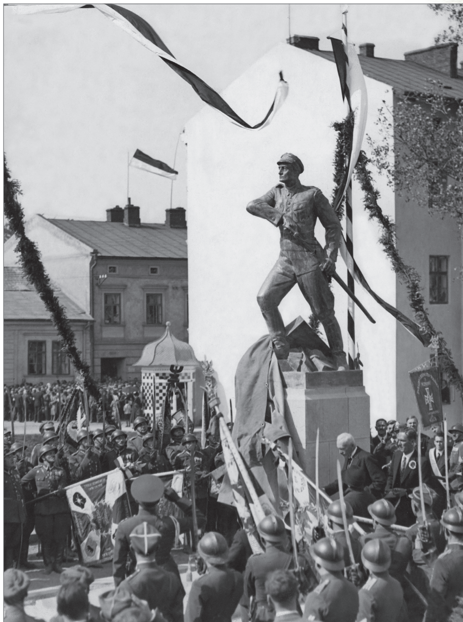
Prezydent Ignacy Mościcki odsłania pomnik Leopolda Lisa-Kuli w Rzeszowie, 18 września 1932 r.