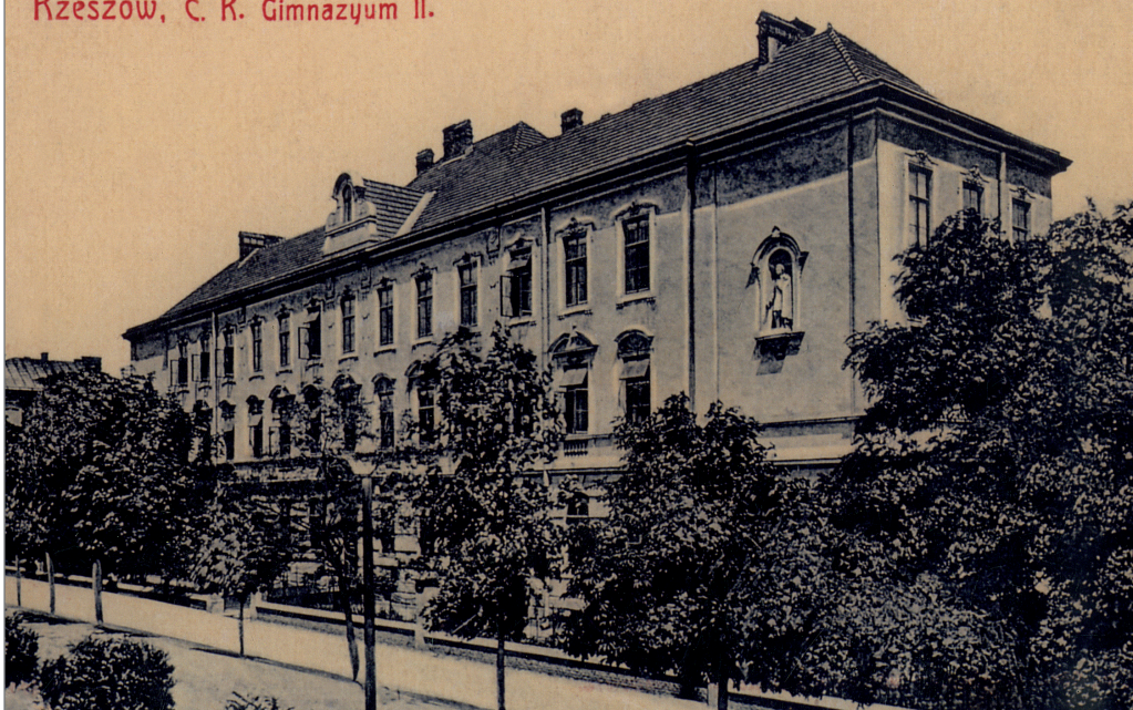
II Gimnazjum w Rzeszowie

„Promień”, zakładał samokształcenie, w ramach którego kładziono nacisk na znajomość literatury narodowej, historii Polski. W programie był też postulat zajęcia się losem warstwy chłopskiej.