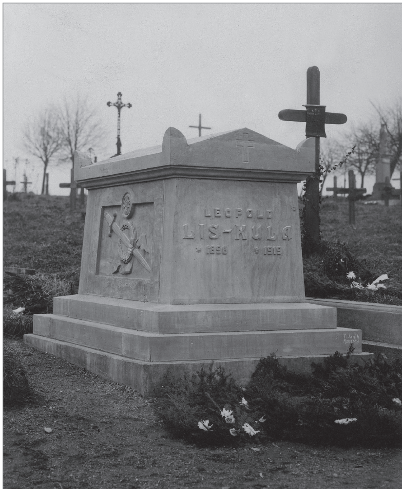
Grobowiec śp. płk. Leopolda Lisa-Kuli na cmentarzu Pobitno w Rzeszowie

Kondukt pogrzebowy, złożony z różnych formacji wojskowych, duchowieństwa, przedstawicieli władz i urzędów, nauczycieli, uczniów i społeczności Rzeszowa był wielką manifestacją patriotyczną. Skromna mogiła tonęła w wieńcach i kwiatach, na jednej z szarf towarzysze z Komendy Naczelnej nr 3 POW napisali: „Temu, którego nikt nie zwyciężył”.