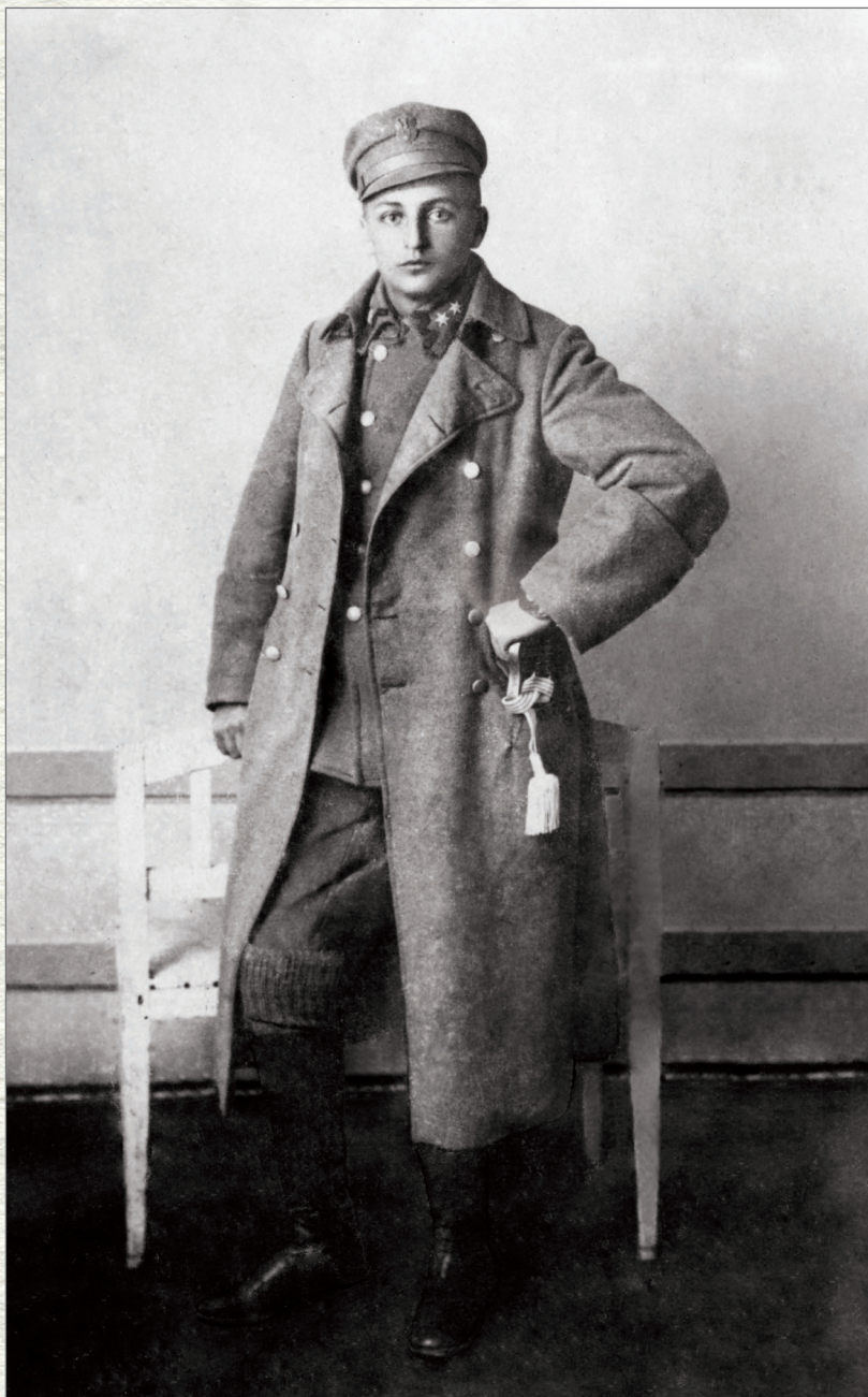
Leopold Lis-Kula w Legionach Polskich