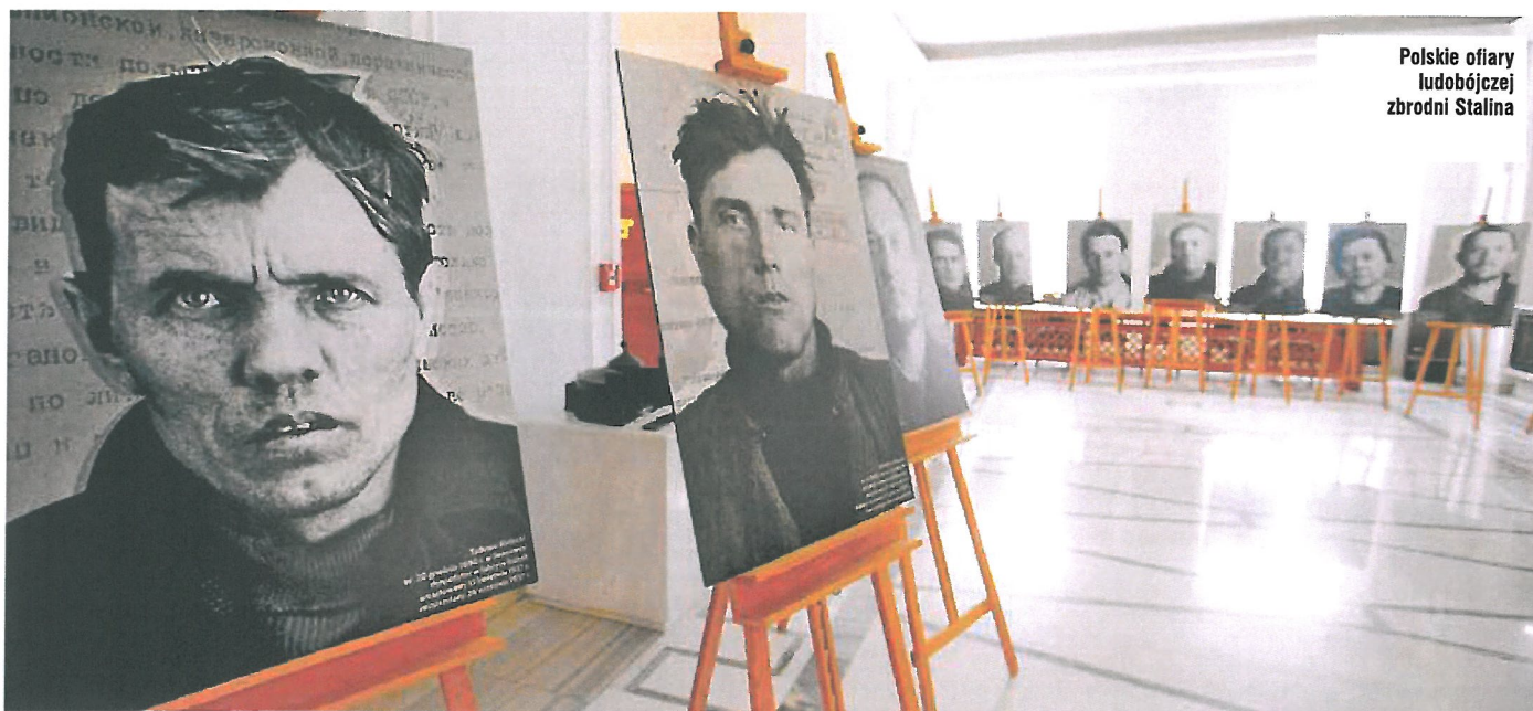
Polskie ofiary ludobójczej zbrodni Stalina