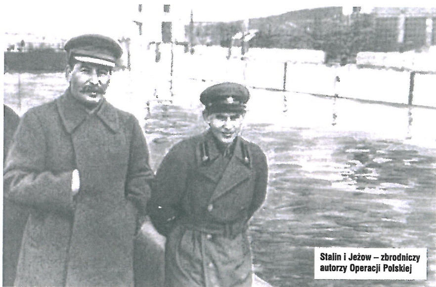
Stalin i Jeżew – zbrodniczy autorzy Operacji Polskiej

Na tle innych operacji narodowościowych Operację Polską NKWD wyróżnia jej modelowy charakter, liczba wykonywanych wyroków śmierci i skala terroru