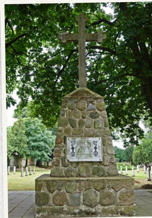
Pomnik poświęcony jeńcom rosyjskim zmarłym w Stargardzie w okresie I wojny światowej.

Pomnik żydowski – poświęcony Niezapomnianym Towarzyszom – ma formę dość prostego kamiennego obelisku, który pierwotnie miał być zwieńczony kulą. Z jednej jego strony znajdują się sentencje w języku hebrajskim, z drugiej zaś – w rosyjskim i niemieckim. Na pomniku umieszczono daty: 1914–1920. Obecna lokalizacja pomnika jest wtórna, pierwotnie stał on w północno-zachodniej części cmentarza, zapewne tuż przy ówczesnej jego granicy.