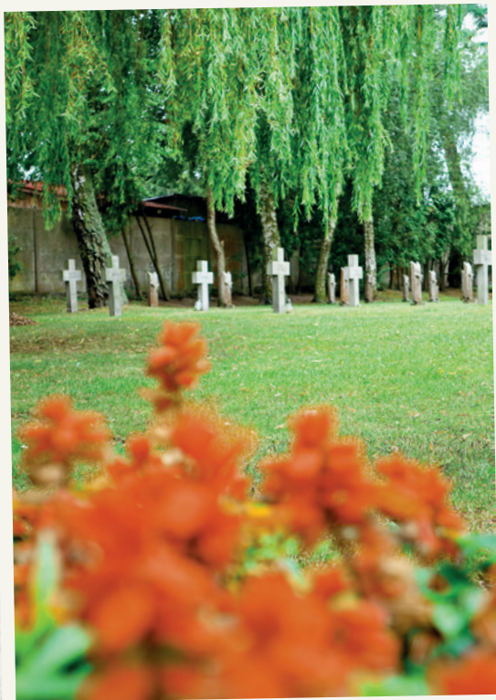
Widok pld.-wsch. części cmentarza.