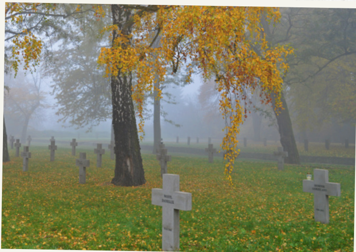
Kwatera polska zmarłych w niewoli jeńców II Okręgu Wojskowego.