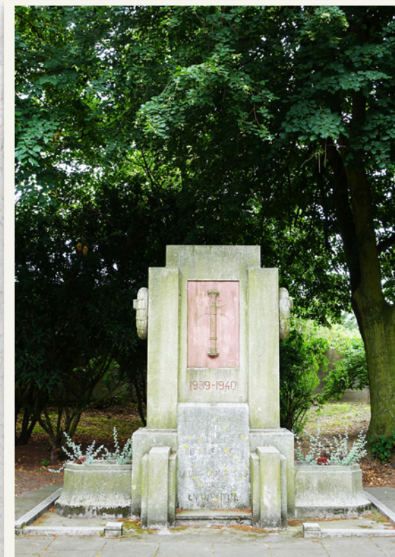
Pomnik francuski z okresu II wojny światowej.

Jeszcze w czasie wojny wzniesiony został pomnik francuski, zawierający w centralnej części motyw z przedstawieniem labrysu (topora o podwójnym ostrzu) używanego jako godło kolaborującego z III Rzeszą rządu Vichy. Napisy wyraźnie wskazują na poświęcenie pomnika francuskim jeńcom Stalagu II D ( Les prisonniers de guerre français du Stalag II D à leurs camarades morts en captivité ). Pomnik pierwotnie stał w innym miejscu.