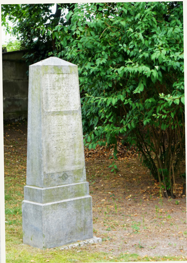
Obelisk upamiętniający Żydów zmarłych w obozie jenieckim w czasie Wielkiej Wojny.

Pomnik angielski (brytyjski) położony był mniej więcej w połowie zachodniej granicy cmentarza, pomiędzy upamiętnieniem muzulmańskim a żydowskim.