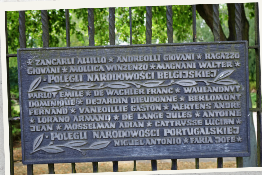
Jedna z tablic projektu Stanisława Jeziorańskiego z nazwiskami jeńców pochowanych na cmentarzu – Włochów, Belgów i Portugalczyków.

Kwatery zostały uporządkowane, wykonano nowe nagrobki, nasadzenia roślinności, a także ogrodzenie od strony ulicy Władysława Reymonta. Na nim zaś umieszczono akcenty metaloplastyczne – zaprojektowane przez Stanisława Jeziorańskiego tablice z nazwiskami pochowanych na cmentarzu. Mogiły zostały oznakowane w zróżnicowany sposób – na polskich postawiono krzyże, radzieckie otrzymały formę prostego słupka z gwiazdą, a serbskie i pozostałe – prostej, ustawionej pionowo płyty.