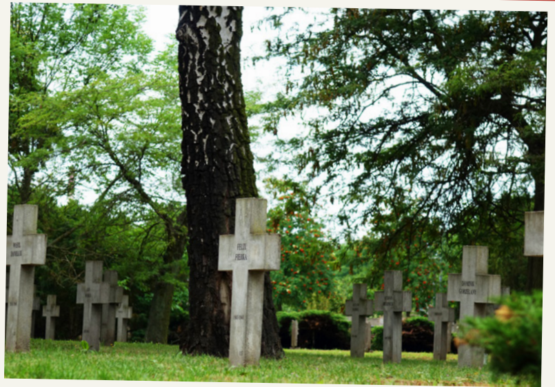
Groby polskich jeńców wojennych.