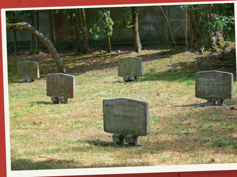
Mogiły jeńców obu wojen – Belgów i Portugalczyków.