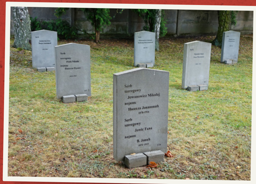
Kwatera serbskich jeńców wojennych.