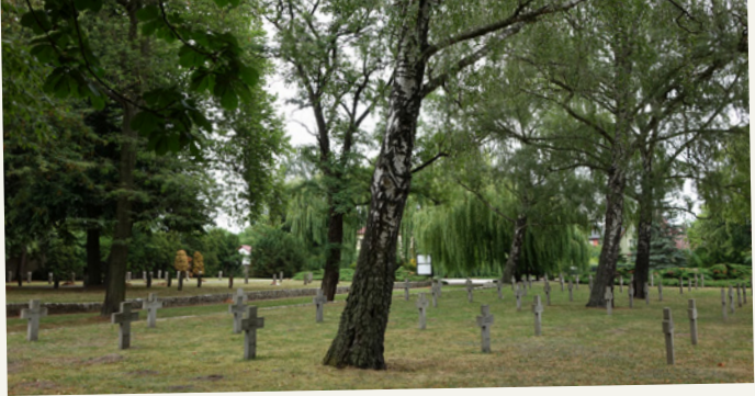
Widok ogólny cmentarza. W głębi kwatery jeńców i żołnierzy Armii Czerwonej.