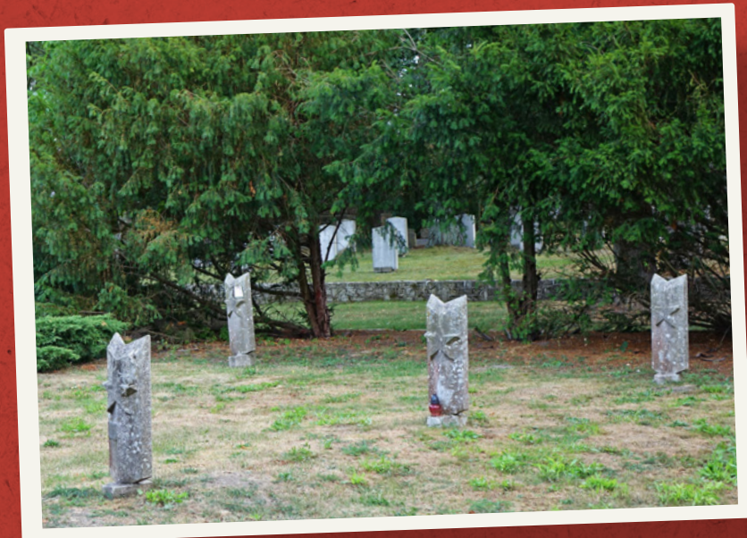
Kwatera żołnierzy Armii Czerwonej.