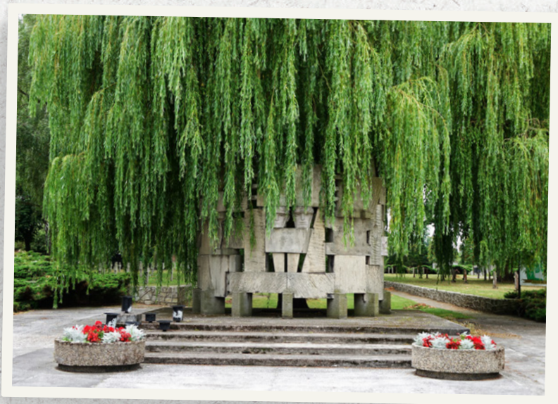
Pomnik z 1969 r. poświęcony jeńcom i żołnierzom pochowanym na Międzynarodowym Cmentarzu Wojennym.

Remont ten nie ominął pomników. Dokonano wtedy zmiany lokalizacji (w obrębie nekropolii) pomników: francuskiego i żydowskiego. Planowano też umieszczenie tam dwóch kolejnych upamiętnień – nowoprojektowanego, dla którego przewidziano reprezentacyjne miejsce na wprost bramy wejściowej oraz fragmentów pomnika radzieckiego, przewidzianego do przeniesienia z placu Wolności. Pomnik projektu Sławomira Lewińskiego z placem „manifestacyjnym” pojawił się na cmentarzu w 1969 r. Azurową konstrukcję betonową wkomponowano w zieleń stanowiącą dla niego naturalne tło. Jak głoszą napisy na pomniku jest on poświęcony „Pamięci żołnierzy narodów walczących z przemocą germańską i hitlerowską, którzy zginęli w obozach jenieckich w latach I i II wojny światowej. W hołdzie żołnierzom Wojska Polskiego i Armii Radzieckiej, poległym w 1945 roku w walce o wolność”. Nie przeniesiono natomiast pomnika radzieckiego, mimo że na cmentarzu zaplanowano stosowne miejsce.