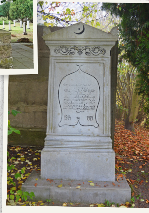
Upamiętnienie muzułmanów – żołnierzy armii carskiej (rosyjskiej).