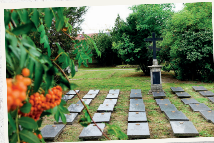
Symboliczna kwatera żołnierzy Armii Czerwonej przeniesiona w 1996 r. z Mauzoleum przy Placu Wolności.

W 1996 r. powstała wydzielona kwatera, do której przeniesiono płyty nagrobne i elementy architektoniczne z założonego w 1945 r., w centrum Stargardu, Mauzoleum Żołnierzy Radzieckich. Zarówno na cmentarzu oficerskim, jak i w bratnich mogiłach na placu Wolności nie było jednak, poza jednym przypadkiem (pochowany już po założeniu cmentarza) ludzkich szczątków. Kwatera ta ma więc jedynie charakter symboliczny.