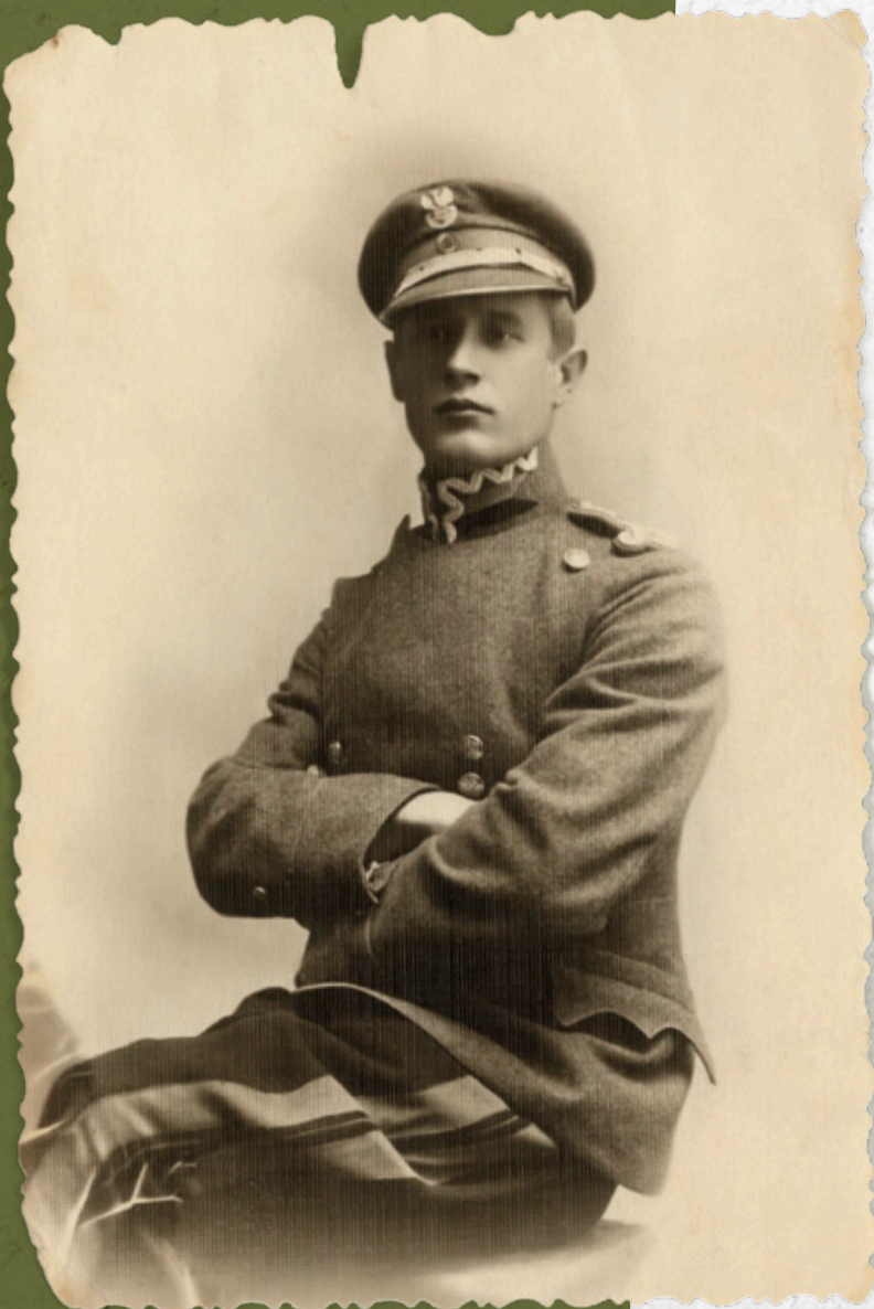
Nieznany żołnierz Strzelców Granicznych

W czerwcu 1920 r., w związku z odwrotem i katastrofalną sytuacją na froncie polsko-bolszewickim, zdecydowano się na wycofanie większości jednostek Strzelców Granicznych z granicy i ich przerzucenie jako wsparcie walczących armii Wojska Polskiego. Tymczasowo ochronę granicy przejęły bataliony wartownicze, wsparte przez pododdziały policji oraz oddziały harcerskie. Dopiero we wrześniu część oddziałów Strzelców Granicznych powróciła do służby na granicy, a pozostałe wymagały uzupełnienia. W tym samym czasie zdecydowano jednak o likwidacji formacji i utworzeniu nowej, cywilnej. Rozformowanie Strzelców Granicznych trwało do marca 1921 r.