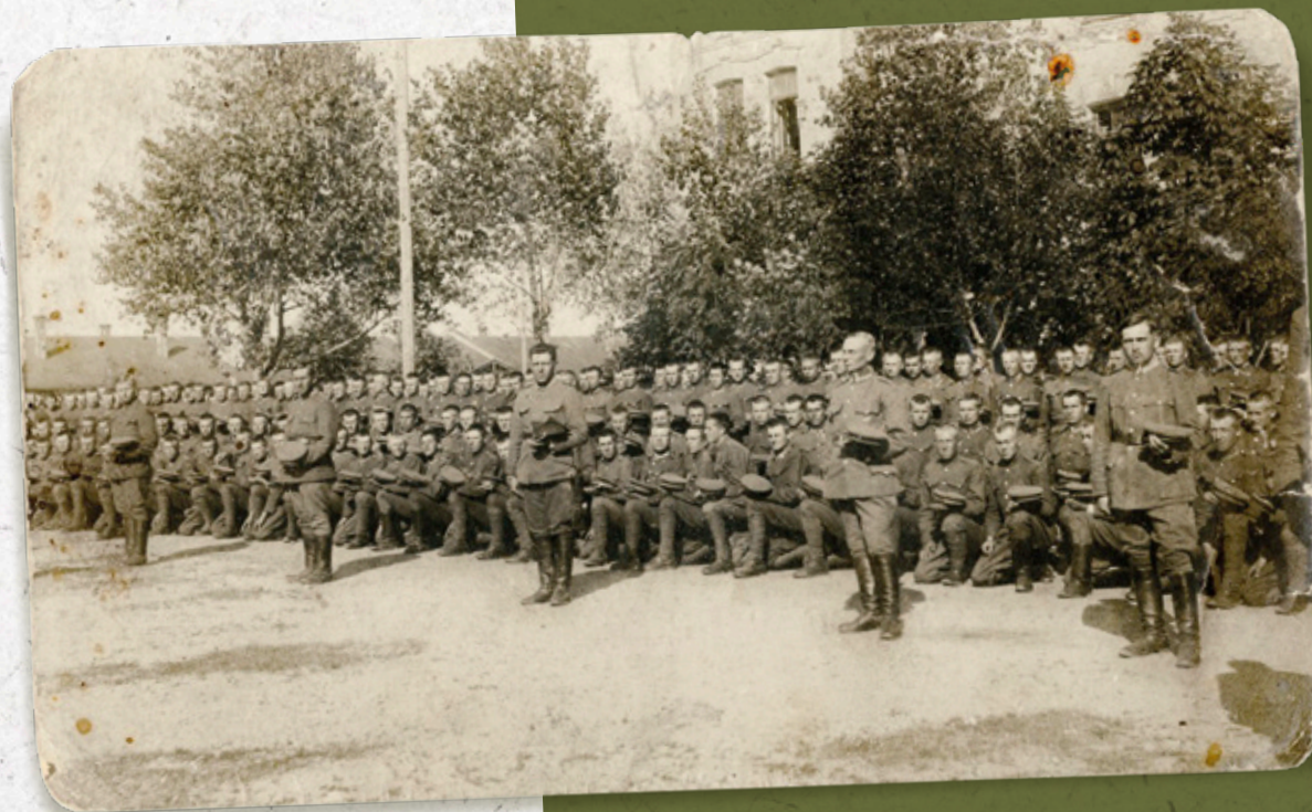
Przysięga żołnierzy 5 szwadronu II dywizjonu 10 Pułku Strzelców Granicznych. Suwałki 1920 r.