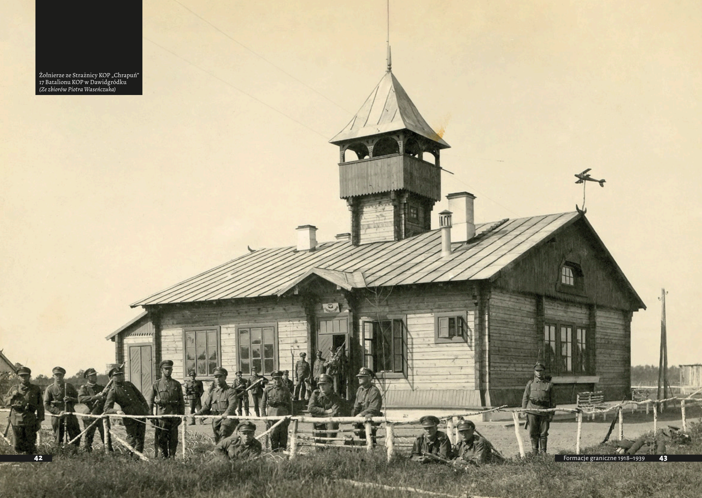
Żołnierze ze Strażnicy KOP „Chrapuń” 17 Batalionu KOP w Dawidgródku