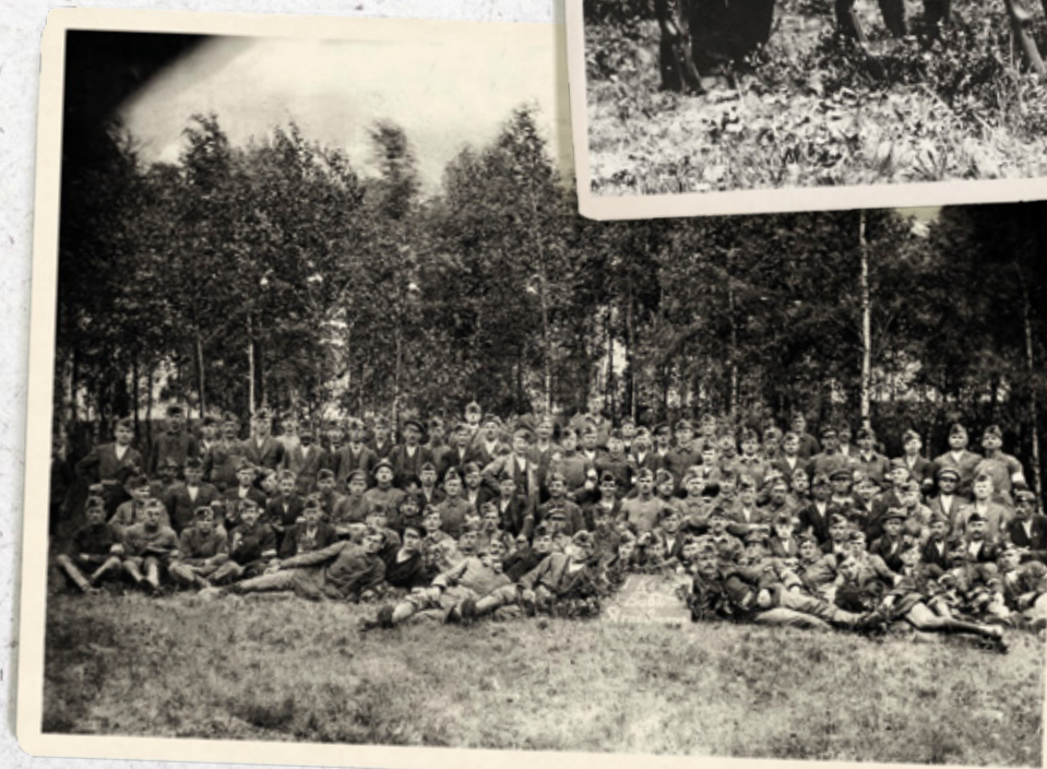
Powstańcy śląscy z 1 kompanii I Batalionu Straży Granicznej Górnego Śląska