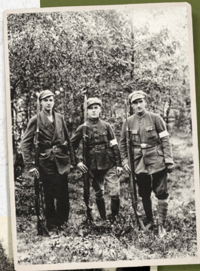
Pamiętkowe zdjęcie powstańców śląskich uzbrojonych w Mausey

Po przejściu przez Polskę przyznanej jej części Górnego Śląska Straż Graniczna Górnego Śląska została przesunięta na granicę z Niemcami. W czasie od 24 czerwca do 10 lipca 1922 r. włączona do Straży Celnej.