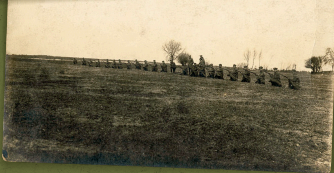
Żołnierze Wojskowej Straży Granicznej podczas szkolenia, 1919 r.