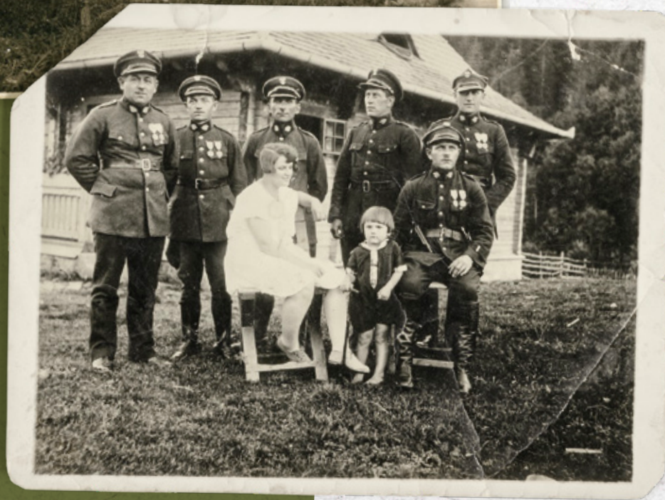
Placówka SG, gdzieś na górskim pograniczu

Do najważniejszych zadań Straży Granicznej należało: przeciwdziałanie nielegalnemu ruchowi osobowemu i towarowemu; śledzenie i ujawnianie przemytnictwa i innych wykroczeń skarbowo-celnych; pełnienie służby wartowniczej i konwojowej w urzędach celnych; strzeżenie znaków i urzędzeń granicznych; współdziałanie z właściwymi organami w zapewnieniu bezpieczeństwa; współdziałanie z wojskiem w zakresie obrony państwa. Ponadto Straż Graniczna zwalczała przestępstwa przeciwko monopolom i nadużyciom podatkowym. Nowością w systemie ochrony granicy było powołanie służby wywiadowczej SG, dla zdobywania informacji przeciwprzemysłowych oraz przydatnych dla wywiadu wojskowego. Działalność wywiadowcza realizowana była przede wszystkim poprzez placówki II linii, podlegające przygranicznym komisariatom SG.