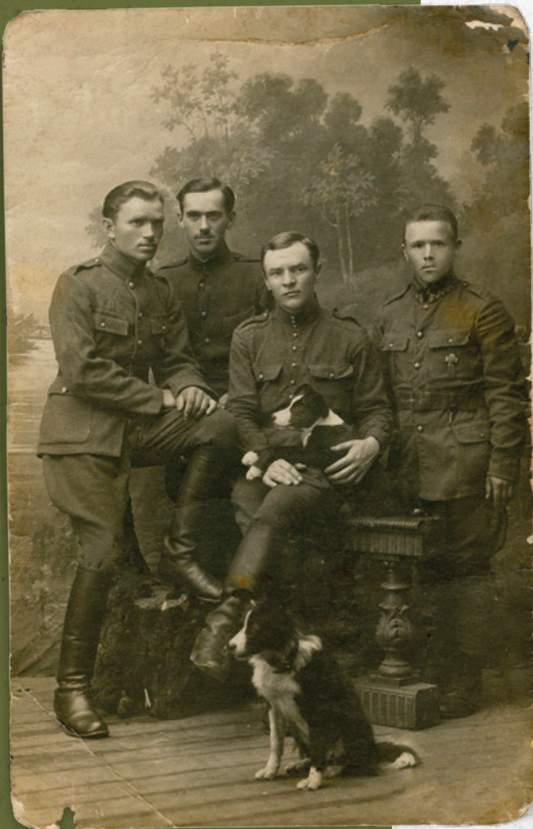
Pamiętkowe zdjęcie żołnierzy Batalionu Celnego nr 41. Druskienniki, 31 VII 1922 r.