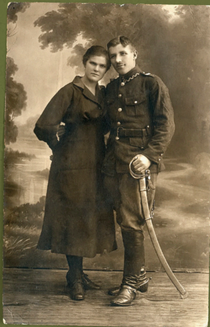
Nieznany żołnierz Wojskowej Straży Granicznej z żoną (lub narzeczoną). Częstochowa, 23 XI 1919 r.