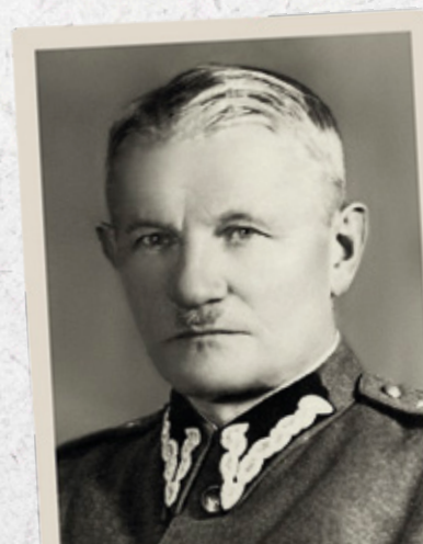
Pułkownik Adolf Małyszko, komendant Straży Wojskowo-Gospodarczej (1918), Straży Granicznej (1918–1919) i Wojskowej Straży Granicznej (1919–1920)

Organizację struktur powierzono płk. Adolfowi Małyszce, wywodzącemu się z armii rosyjskiej, który w listopadzie został zatwierdzony jako jej dowódca przez szefa Sztabu Generalnego Wojska Polskiego. Formacja została podporządkowana Ministrowi Apropowizacji i Ministrowi Wojny. Zadaniem Straży miało być zatrzymywanie nielegalnego wywozu z kraju żywności i artykułów pierwszej potrzeby, walka ze spekulacją, lichwą i wyzyskiem. Zaczątkiem formacji miały być trzy oddziały (około 100 żołnierzy), które planowano rozmieścić na głównych kolejowych stacjach granicznych. Ze względu na trudności organizacyjne (m.in. brak kadry) formacja nie podolała postawionym przed nią zadaniom.