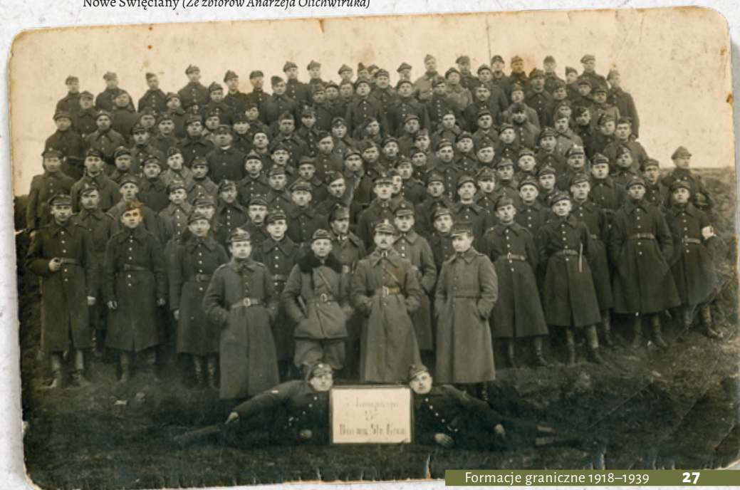
Żołnierze 3 kompanii 43 Batalionu Straży Granicznej, Nowe Święciany

Zgodnie z rozkazem organizacyjnym Głównej Komendy Straży Granicznej z 9 listopada 1922 r. formacja objęła ochronę granic: polsko-łotewskiej, polsko-radzieckiej oraz część granicy polsko-rumuńskiej. W lutym 1923 r. bataliony SG z pogranicza polsko-litewskiego, w ramach grupy płk. Paślowskiego, wzięły udział w zajęciu pasa neutralnego i objęły ochronę linii granicznej z Litwą. W strukturze formacji, przy urzędach wojewódzkich białostockim, wileńskim, nowogródzkim, poleskim, wołyńskim i tarnopolskim, utworzono 6 komend wojewódzkich SG, którym przydzielono odcinki granicy. Na szczeblu powiatów granicznych utworzone zostały komendy powiatowe SG. Bezpośrednią ochronę granicy powierzono batalionom Straży Granicznej, podporządkowanym poszczególnym komendom powiatowym. Straż Graniczna działała