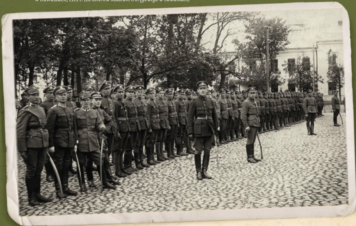
Oddział Wojskowej Straży Granicznej na Placu Józefa Piłsudskiego w Suwałkach, 1919 r.