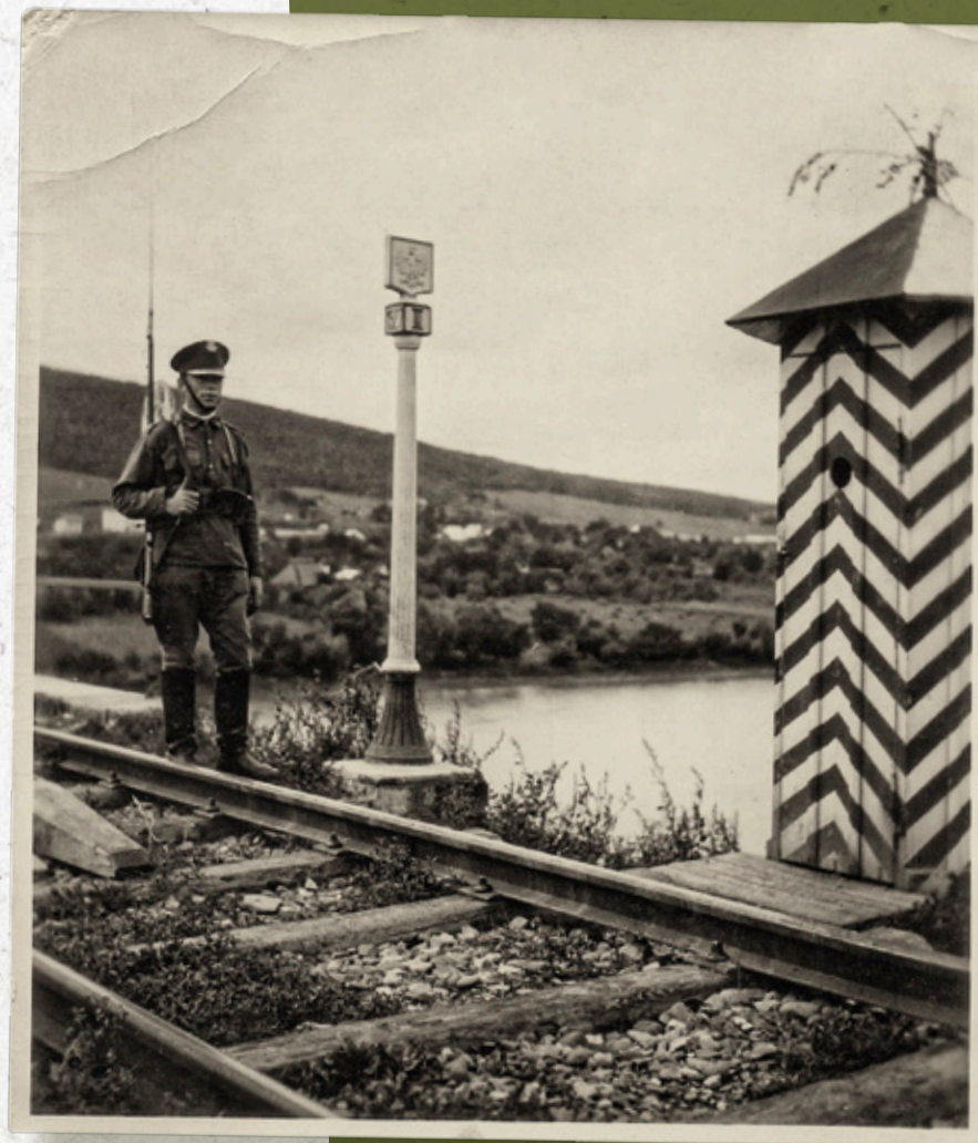
Posterunek wartowniczy na moście kolejowym na granicy polsko-rumuńskiej