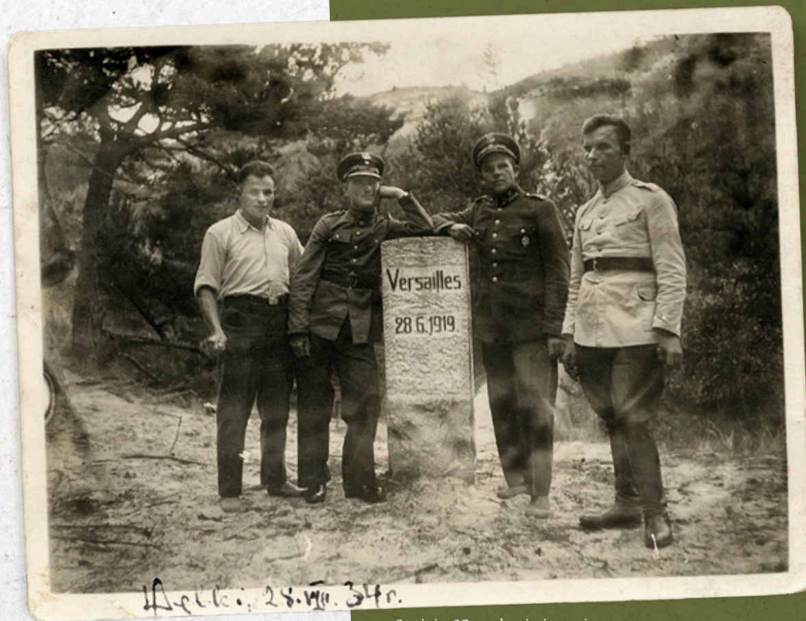
Strażnicy SG przy kamieniu granicznym (wersalskim). Dąbki, 28 VIII 1934 r.