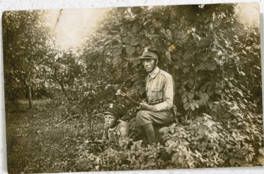
Żołnierze KOP na zasadzce (zdjęcie pozowane)

formacja prowadziła działania o charakterze charytatywnym i społecznym na rzecz miejscowej ludności, których celem było umacnianie państwowości oraz przyciąganie i przywiązanie mieszkańców do Polski. Działalność społeczno-oświatowa realizowana przez KOP służyła pozyskaniu sympatii ludności i wspieraniu rozwoju gospodarczego Kresów, a także pomocy w zwalczaniu biedy i aktywizowaniu ludności. We wrześniu 1939 r. oddziały KOP walczyły przeciwko Niemcom na wielu zagrożonych odcinkach frontu zachodniego, m.in. pod Wizną i Strękową Górą, w Węgierskiej Górze, w rejonie Wielunia, w obronie Helu. 17 września podczas sowieckiej agresji żołnierze ze strażnic KOP jako pierwsi stali się jej ofiarami. Zgrupowanie KOP skutecznie walczyło z Rosjanami pod Szackiem i Wytycznem, ale nie mogąc wygrać z silniejszym wrogiem, skapitulowało. Żołnierze KOP trafili do obozów specjalnych w Starobielsku i Kozielsku, a ich nazwiska znajdują się wśród ofiar Zbrodni Katyńskiej 1940 r.