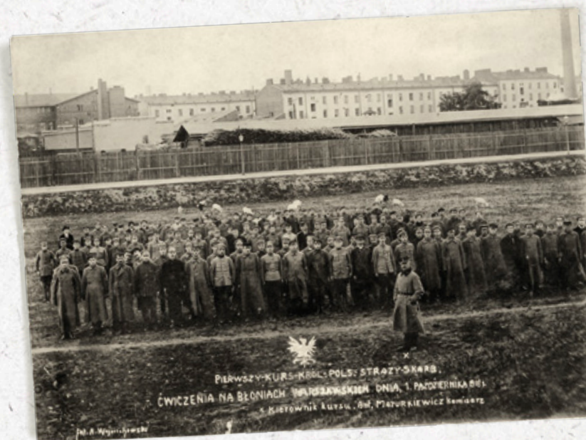
Straż Skarbowa Królestwa Polskiego. I kurs w Warszawie, 1 X 1918 r.