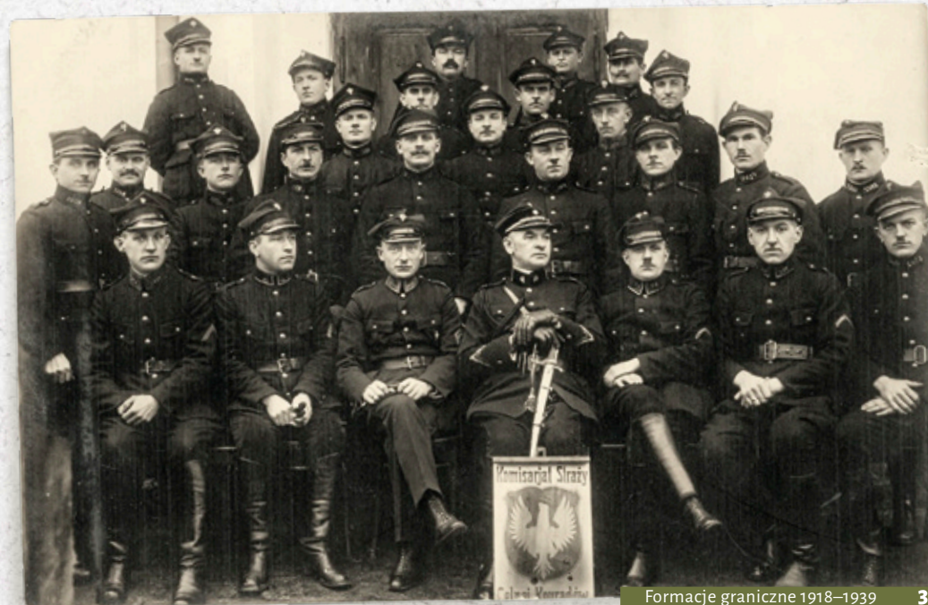
Formacje graniczne 1918–1939