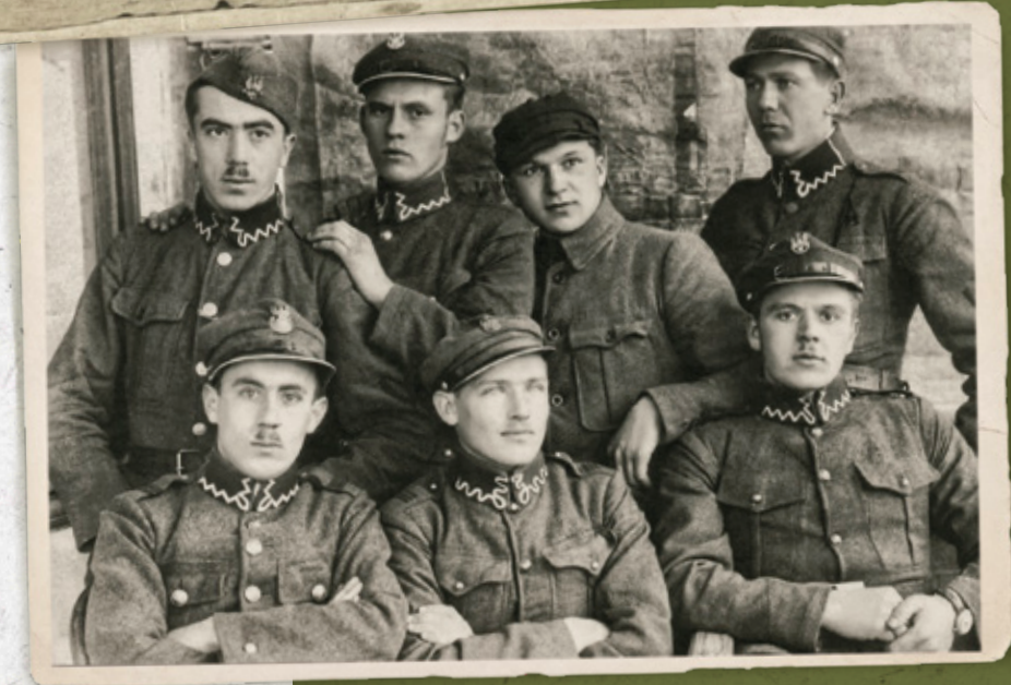
Żołnierze z 10 Batalionu Celnego stacjonującego m.in. na Pokuciu