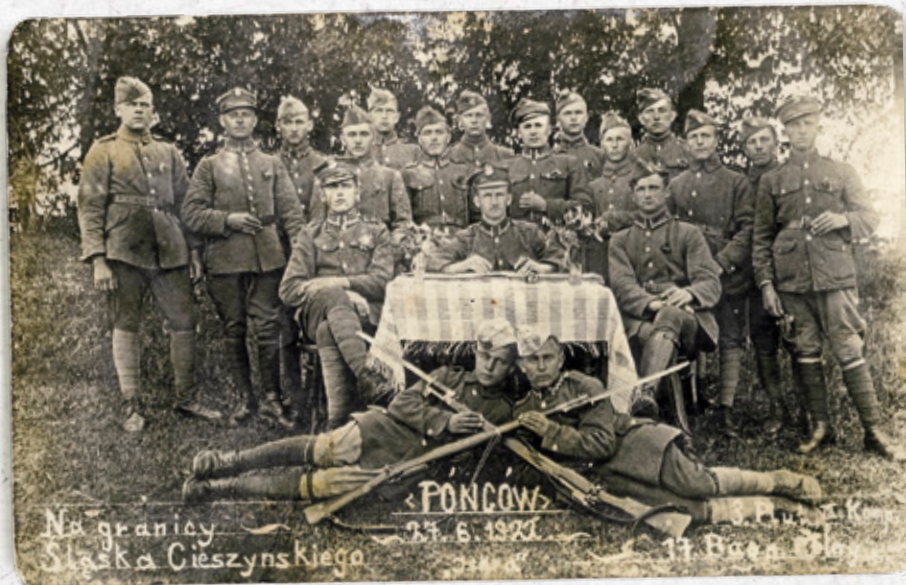
Żołnierze z III plutonu 3 kompanii Batalionu Celnego nr 17 pełniący służbę na granicy Śląska Cieszyńskiego. Pońców, 27 VI 1922 r.