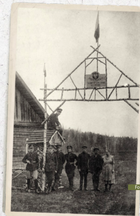
Policjanci z granicznego 13 posterunku 7 kompanii Policji Państwowej w Oszarynie (pow. Święciany)