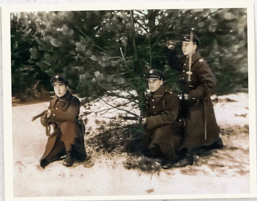
Patrol żołnierzy KOP w zimowej scenerii