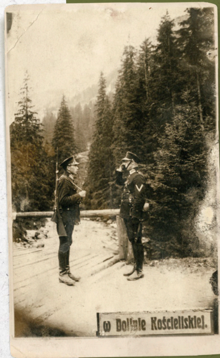
Kontrola posterunku wartowniczego w Dolinie Kościeliskiej (Komisariat SC „Witów”)