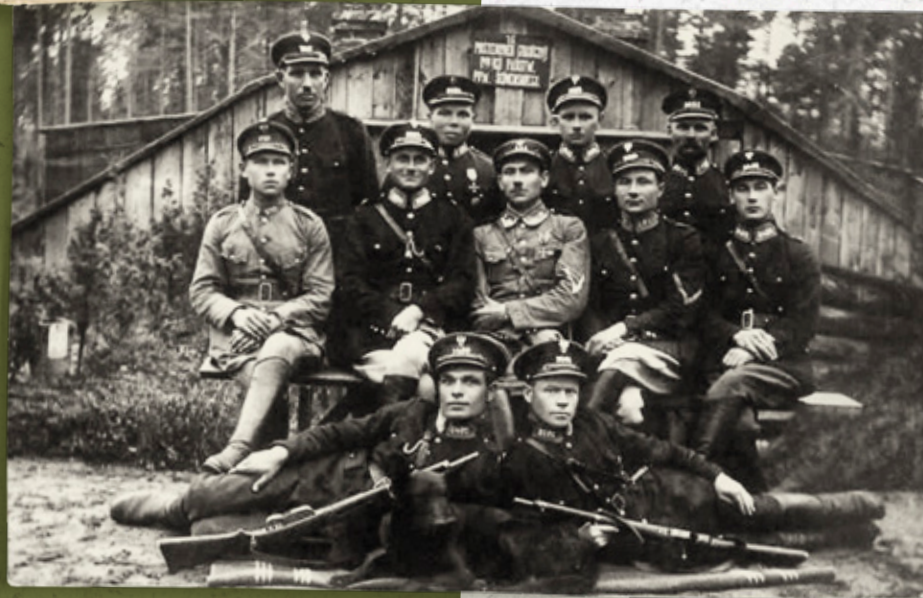
Załoga granicznego 15 Posterunku Policji Państwowej Powiatu Sejneńskiego

Policja Państwowa pełniła służbę na granicach II Rzeczypospolitej, aż do czasu utworzenia Korpusu Ochrony Pogranicza. Nowa formacja w listopadzie 1924 r. przejęła ochronę granicy polsko-radzieckiej, a w kolejnych latach (do marca 1926 r.) granic polsko-łotewskiej i polsko-litewskiej.