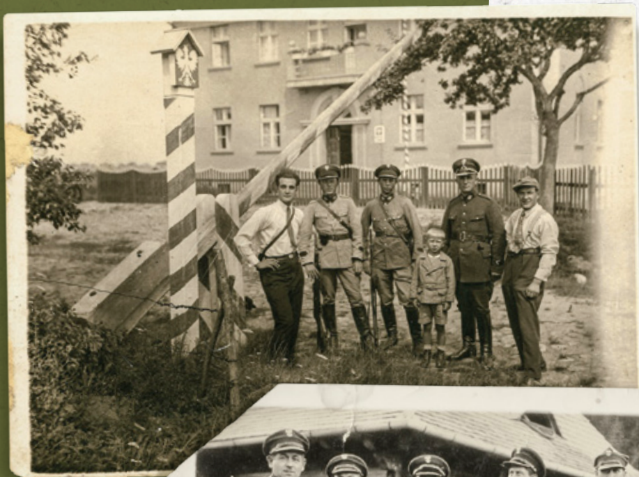
Posterunek SG w przejściu Janowo (pow. Mława)