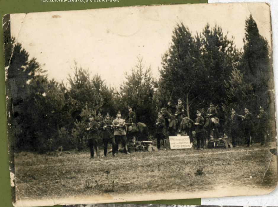
Policjanci z Komendy Policji Granicznej Pododcinka Powiatu Augustowskiego, Kadysz Rządowy (Ze zbiorów Andrzeja Olichwiruka)

Destabilizacja sytuacji w latach 1923–1924 na pograniczu wschodnim, związana z radziecką działalnością dywersyjną i rabunkową, wykazała słabości służby granicznej, pełnionej przez policję zupełnie nieprzygotowaną do tej roli. Wynikało to głównie z powodu braków środków technicznych i braku odpowiednich kadr. Wprawdzie policja prowadziła lepszą pracę wywiadowczą, skuteczną w walce z przestępczością graniczną, ale zupełnie nieprzydatny okazał się system policyjny, oparty na posterunkach stałych, które nie były w stanie zabezpieczyć granicy pod względem politycznym i militarnym.