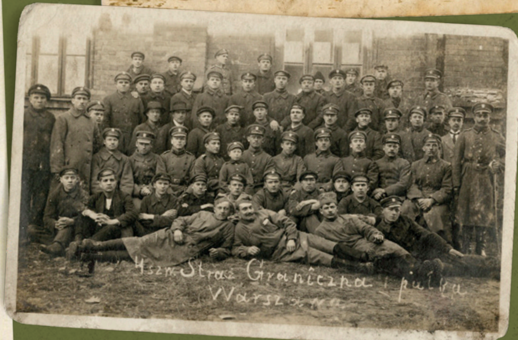
Żołnierze 4 szwadronu I Pułku Straży Granicznej, Warszawa 1919 r.