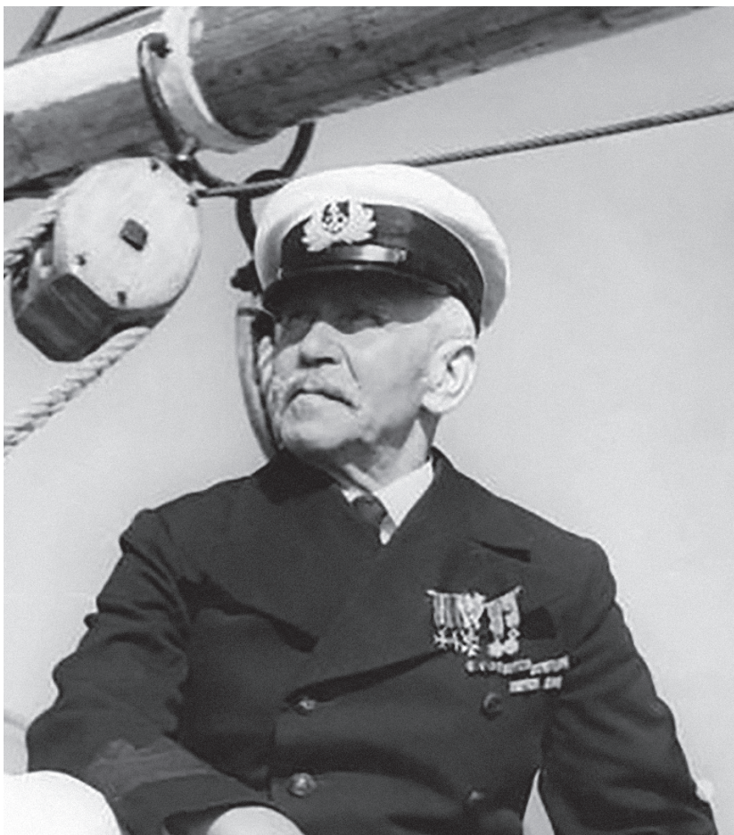
Na pokładzie szkunera „Zawisza Czarny”

im ojciec – uczestnik powstania styczniowego – oraz dziad – weteran powstania listopadowego. Z ich wieczornych gawęd i pieśni wyłaniał się przed malcami obraz Polski dumnej i niepodległej.