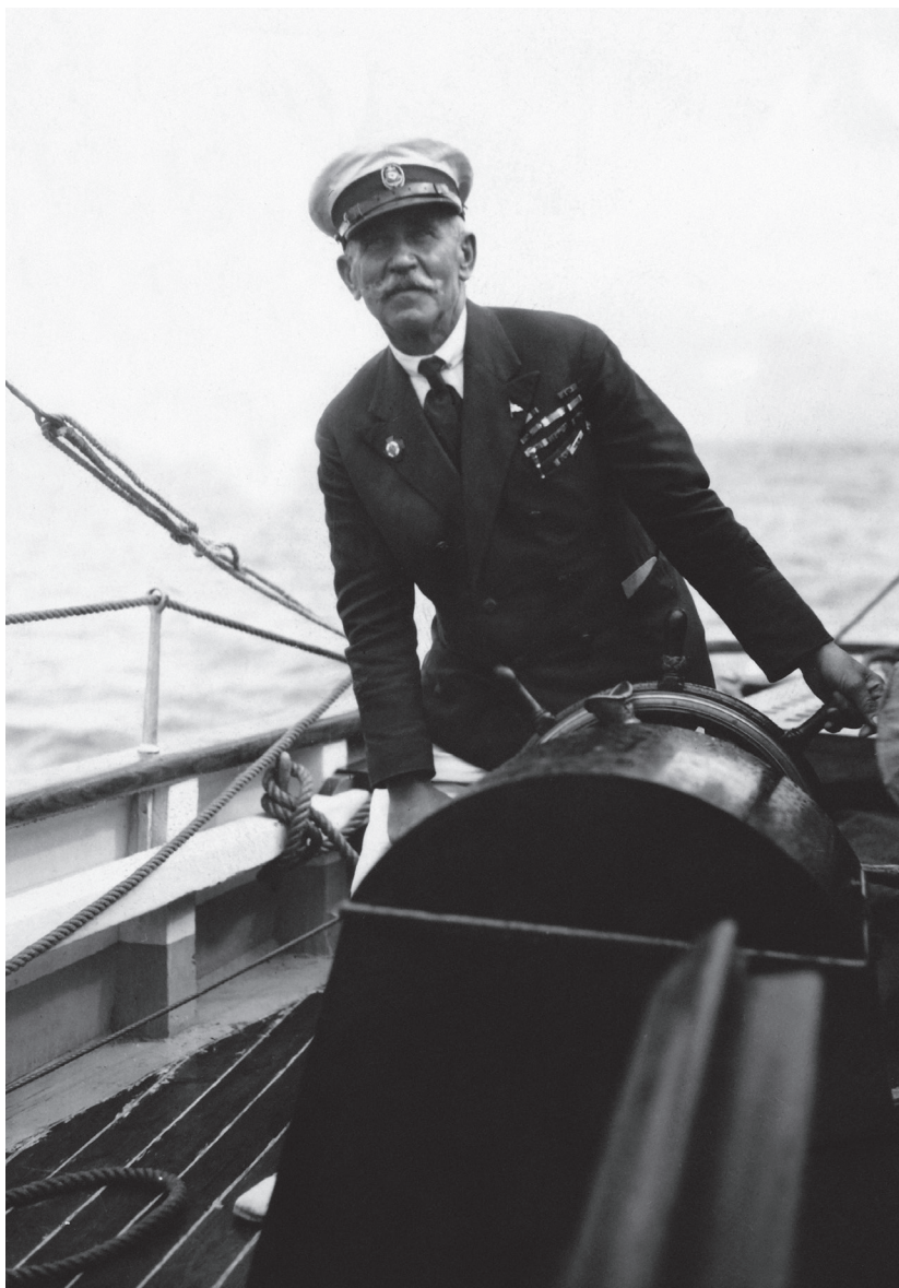
Kapitan „Zawiszy Czarnego” za sterem, druga połowa lat trzydziestych XX w., (fot. NAC)