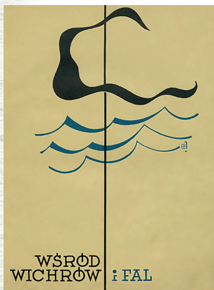
Okladka pierwszego wydania, 1935 r.

Z ostatniego rejsu – do szwedzkiej Karlskrony – powrócił do Gdyni 20 sierpnia 1939 r. Do kolejnego rejsu „Zawiszy” zapowiadanego na koniec wakacji już nie doszło.