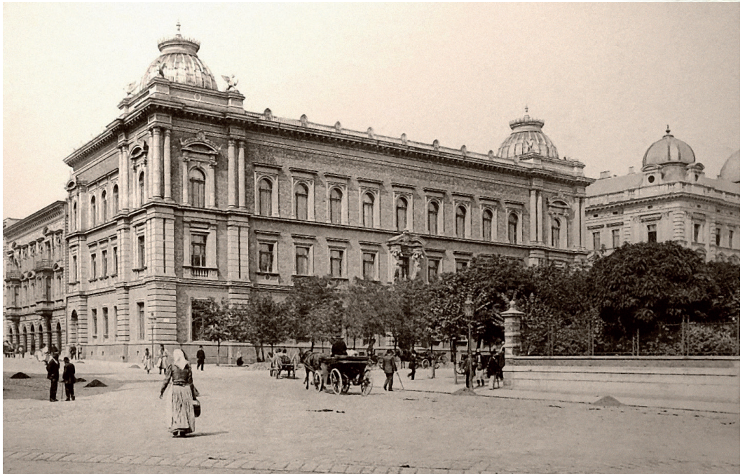
Gmach Akademii Sztuk Pięknych w Krakowie, początek XX w.

działać w Uniwersytecie Ludowym im. Adama Mickiewicza, wszedł również do zarządu Towarzystwa Szkoły Ludowej, organizacji znajdującej się pod wpływem Ligi Polskiej. Jako orędownik szerzenia oświaty wśród ludu zbliżył się poglądami do znanego galicyjskiego socjalisty Ignacego Daszyńskiego.