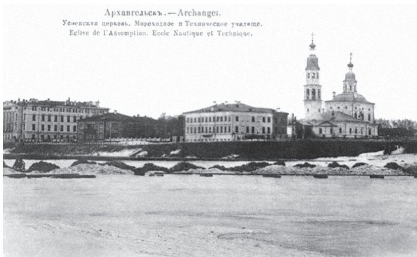
Nabrzeże Dwiny w Archangielsku, 1912 r.

W lipcu tego roku Zaruski uzyskał zgodę na przeniesienie do Archangielska w związku z planami kształcenia umiejętności żeglarskich na tamtejszych kursach szyperskich. Po zameldowaniu się we właściwym urzędzie policji podjął pracę w porcie przy rozładunku łodzi, kutrów i statków. Mieszkał w wynajętym pokoiku na poddaszu domu, w którym kwaterował inny Polak, Tadeusz Gałęcki. Ten działacz niepodległościowy za przynależność do Polskiej Partii Socjalistycznej trafił zrazu do X Pawilonu Cytadeli Warszawskiej, a następnie znalazł się na zesłaniu w Archangielsku. Młodzi konspiratorzy szybko znaleźli wspólny język. Gałęcki, który wiele lat później, już jako Andrzej Strug, będzie znanym pisarzem i publicystą, na dalekiej północy stawiał