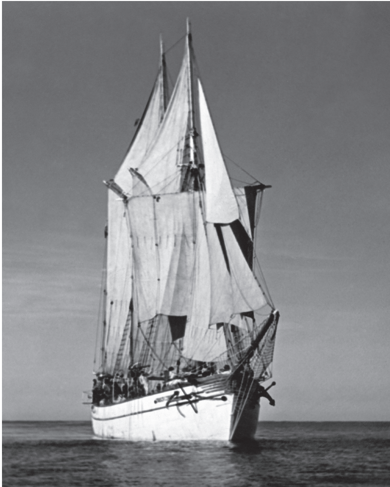
„Zawisza Czarna”, 1937 r.