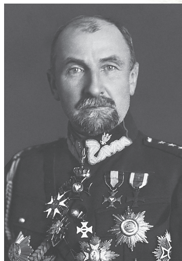
Generał Tadeusz Rozwadowski, połowa lat dwudziestych XX w.

Tworzenie polskiej administracji na zajętej części Spisza zostało usankcjonowane porozumieniem o rozgraniczeniu terenów, zawartym 24 grudnia 1918 r. w Popradzie przez polskich i czechosłowackich działaczy lokalnych. Za zasługi w walce o polskość tej ziemi Zaruski otrzymał z rąk gen. Edwarda Rydza-Śmigłego awans na majora.