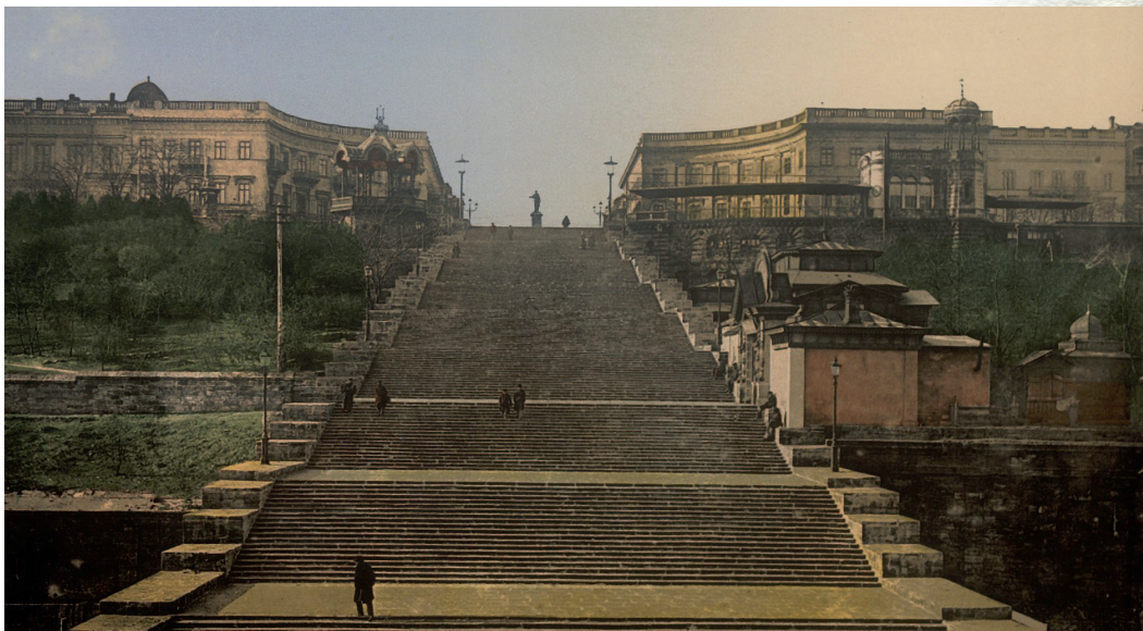
Schody Potiomkinowskie w Odessie, ok. 1900 r.

tem Cesarstwa Rosyjskiego. Zaruskiemu, który od małego zaczytywał się w Robinsonie Cruzoe i książkach Juliusza Verne'a, kosmopolityczna Odessa wydawała się oknem na świat. Musiało to być frapujące dla człowieka, który poza stepowym krajobrazem Podola nic dotychczas nie widział. Zaruski starał się utrwać na płótnie podpatrzone sceny z życia portowego i piękno fal morskich. Ośmielony udanymi próbami marynistycznymi, wstąpił do odeskiej Szkoły Sztuk Pięknych. By móc zaś wreszcie zrealizować marzenie z dzieciństwa, w czasie studenckich wakacji zaciągał się do pracy na statkach handlowych. Jako majtek okrętowy odbył szereg egzotycznych podróży: na wschód i ten bliższy (Syria, Egipt), i ten dalszy (Indie, Chiny, Japonia).