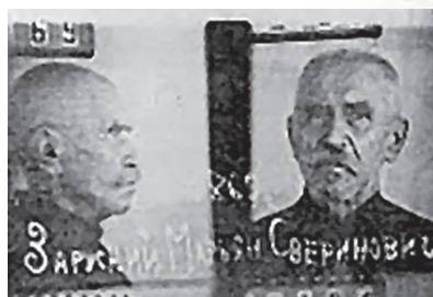
Mariusz Zaruski po aresztowaniu przez NKWD

Z aktu zgonu Mariusza Zaruskiego wystawionego przez lekarza szpitala więziennego w Chersoniu