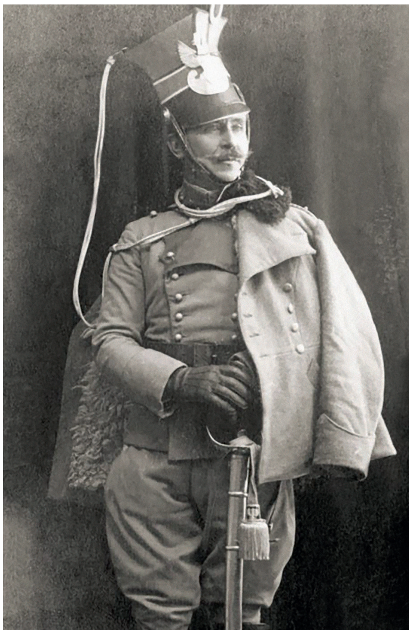
Mariusz Zaruski jako oficer kawalerii Legionów Polskich, ok. 1917 r.