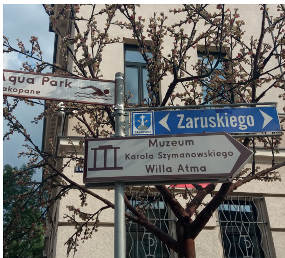
Ulica Zaruskiego (róg Krupówek) w sercu Zakopanego

Mariusz Zaruski, Wśród wichrów i fal (1935)