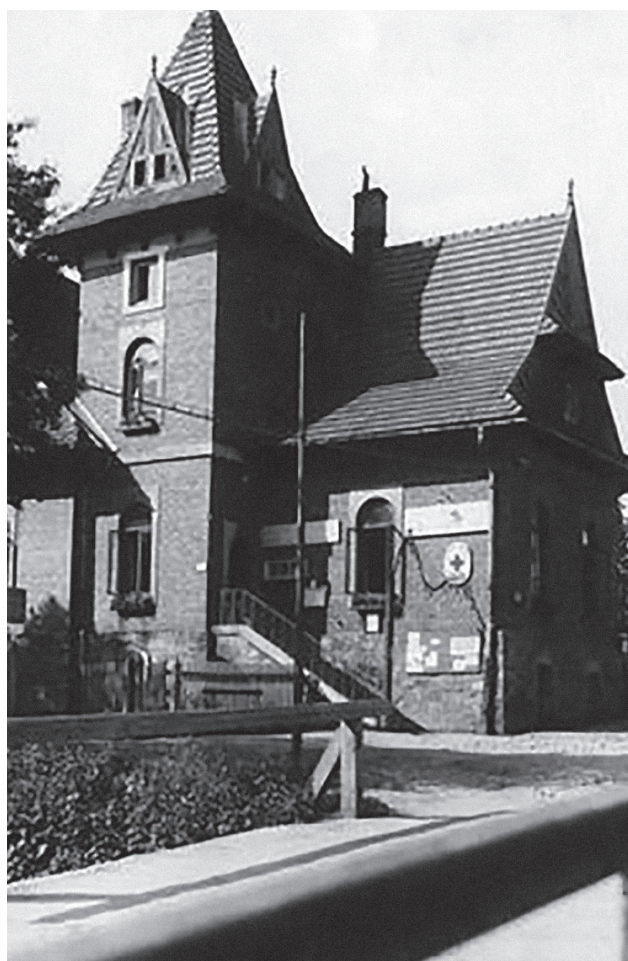
Siedziba TOPR w Dworcu Tatrzańskim, okres międzywojenny

pówek przytulny „Krywań” stawał się jednym z ośrodków kulturalnych, do którego bardziej lub mniej regularnie zjeżdżały takie osobistości jak Ignacy Daszyński – lider Polskiej Partii Socjalno-Demokratycznej Galicji i Śląska Cieszyńskiego oraz poseł do parlamentu wiedeńskiego – czy autor Chłopów i przyszły noblista Władysław Stanisław Reymont. W „Krywaniu” bywali również obaj Piłsudscy – Bronisław, uczony i działacz społeczny, oraz jego młodszy brat Józef, konspirator i działacz niepodległościowy. Do towarzyszy dysput i tatrzańskich