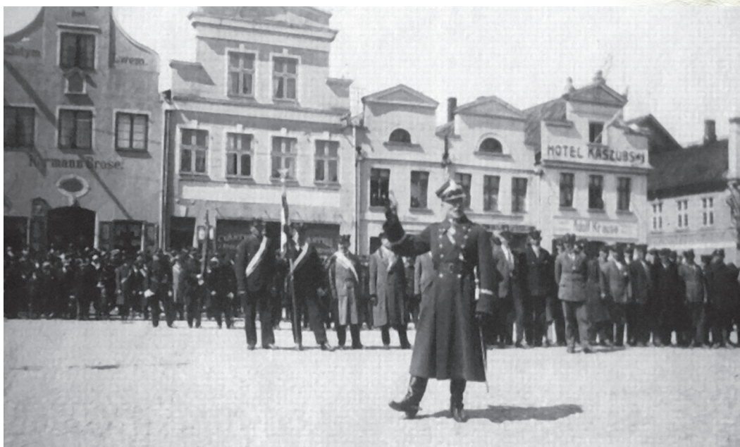
Starosta morski Mariusz Zaruski przemawia na rynku w Pucku, 3 maja 1927 r.

larności – wybrany na prezesa Polskiego Związku Żeglarskiego. Za jego prezesury doprowadzono do integracji żeglarstwa harcerskiego, akademickiego i klubowego. Szczególny nacisk kładł Zaruski na rozwój żeglarstwa morskiego.