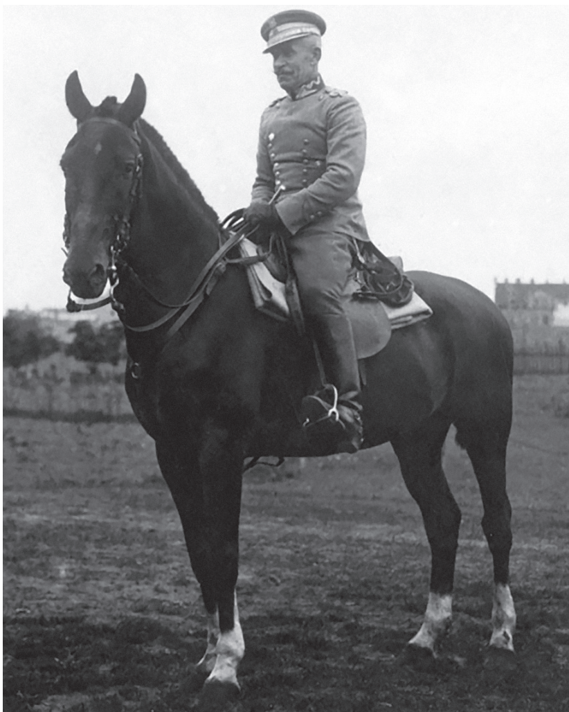
Mariusz Zaruski, 1920 r.

Niestety już 13 stycznia 1919 r. wojska polskie musiały się wycofać ze Spisza i Orawy. Był to skutek zarówno nacisków ententy, jak i akcji militarnej Czechów, którzy łamiąc ustalenia lokalnych ośrodków władzy obu odradzających się państw, wkroczyli na Śląsk Cieszyński. Konflikt zakończył się w lipcu 1920 r., kiedy mocarstwa sprzymierzone podjęły