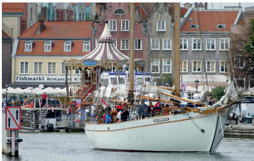
STS „Generał Zaruski” podczas zlotu oldtimerów w Gdańsku, 7 września 2019 r.

W 1971 r. na Starym Cmentarzu na Pęksowym Brzyzku w Zakopanem odsłonięto symboliczny nagrobek gen. Zaruskiego. 11 listopada 1997 r. na cmentarzu złożono urnę z ziemią pobraną z dziesięciu miejsc na cmentarzu w Chersoniu (dokładne miejsce pochówku generała pozostaje nieznane). W tym samym roku odznaczono Zaruskiego pośmiertnie Krzyżem Wielkim Orderu Odrodzenia Polski.