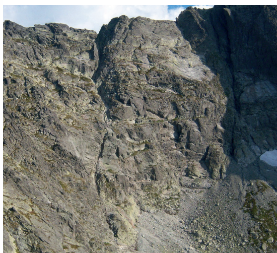
Rysa Zaruskiego w grani Orlej Perci ponad Kozią Dolinką