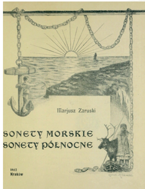
Strona tytułowa Sonetów morskich, 1902 r.

Zaruscy osiedli w Zakopanem wiosną 1904 r. Zamieszkali przy ul. Ogrodowej (dziś ul. Zaruskiego), gdzie w wynajętym domu pani Iza wraz ze swoją matką otworzyły pensjonat „Krywan”. Mariusz tymczasem początkowo dzielił swój czas pomiędzy obecnością w stolicy Tatr a studiami na krakowskiej Akademii Sztuk Pięknych. Od razu