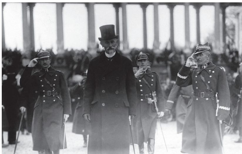
Mariusz Zaruski (z prawej) w roli adiutanta prezydenta RP Stanisława Wojciechowskiego (w środku), 1925 r.

W połowie sierpnia 1919 r. beliniacy zostali przerzuceni na białoruski odcinek frontu. We wrześniu pułk po ciężkich walkach zajął i utrzymał pozycje po zachodniej stronie rzeki Dźwiny. Po miesiącu