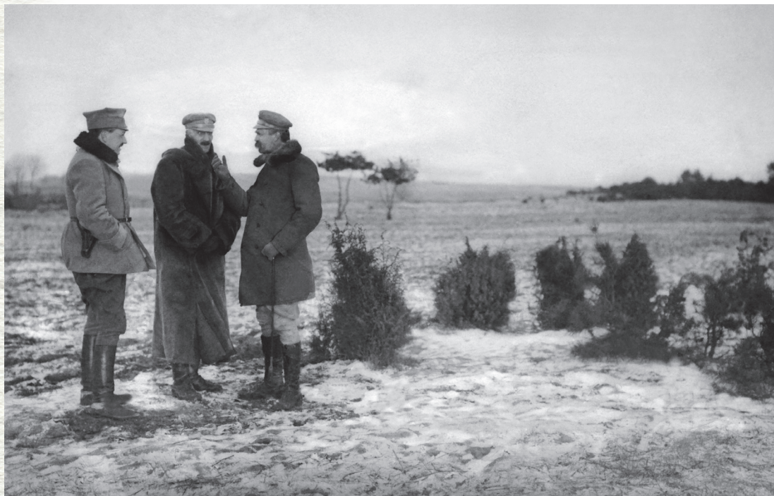
Brygadier Józef Piłsudski (z prawej) rozmawia z Ignacym Daszyńskim i rtm. Mariuszem Zaruskim (z lewej), 1915–1916

Zwolniony po dwóch miesiącach, wrócił w grudniu 1917 r. do Zakopanego, gdzie z polecenia Komendanta objął dowództwo nad podhalańskimi strukturami Polskiej Organizacji Wojskowej. 13 października 1918 r. wziął udział w wiecu powstałej z jego inicjatywy Organizacji Narodowej. Na jej czele, podobnie jak proklamowanej 1 listopada tego roku Rzeczypospolitej Zakopiańskiej, stanął Stefan Żeromski. Mając niekwestionowany autorytet, Zaruski zaangażował górali do przejmowania władzy z rąk zaborcy. Urzędująca w zakopiańskim domu Żeromskiego administracja samozwańczej republiki góralskiej została po dwóch tygodniach podporządkowana Polskiej Komisji Likwidacyjnej, która w byłym już zaborze austriackim stała się oficjalną reprezentacją odradzającej się Polski.