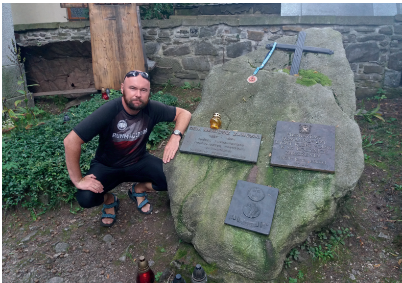
Autor przy grobie Mariusza Zaruskiego na zakopiańskim cmentarzu

Imię Mariusza Zaruskiego nosi basen żeglarski w gdyńskim porcie, a nieopodal miejsca, skąd „Zawisza Czarny” wyruszał w rejsy, stoi popiersie generała. W 2014 r. przy wejściu na molo w Pucku została odstonięta Ławeczka Mariusza Zaruskiego. Wiele szkół i drużyn harcerskich w całej Polsce nosi jego imię, ponadto w kilku miastach (w Gdyni, Katowicach, Warszawie, Zakopanem) Zaruski został patronem ulicy. W Sosnowcu działa oddział Polskiego Towarzystwa Tatrzańskiego im. gen. Mariusza Zaruskiego.