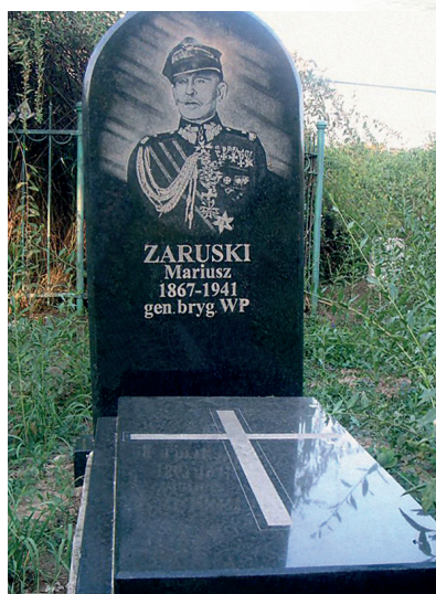
Symboliczny grób gen. Zaruskiego na terenie byłego więzienia w Chersoniu