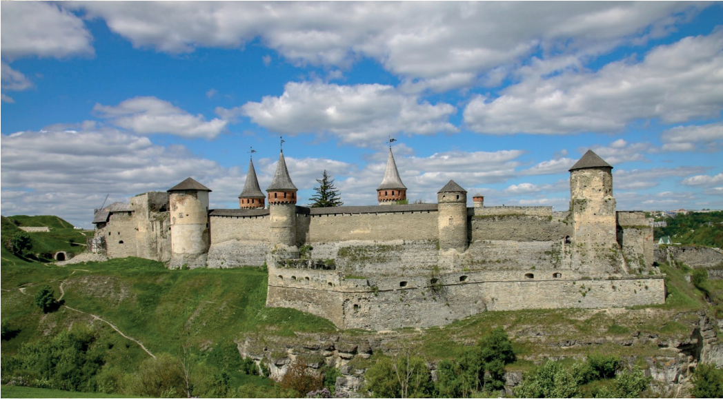
Twierdza w Kamieńcu Podolskim, widok współczesny