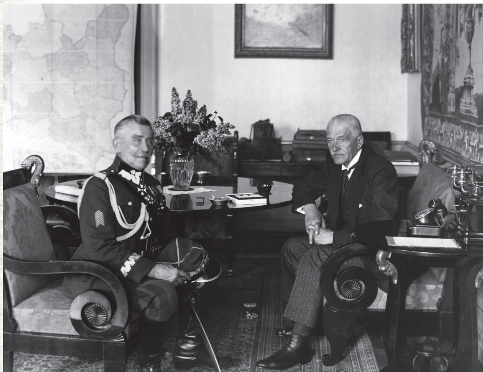
Mariusz Zaruski na audyencji u prezydenta RP Ignacego Mościckiego, 20 maja 1931 r.

we współpracy ze Związkiem Harcerstwa Polskiego placówce przez trzy kolejne sezony letnie Zaruski prowadził kursy na stopnie żeglarza i sternika morskiego. Skauting, z którym zetknął się jeszcze na początku stulecia w Zakopanem, opierał się na wartościach bliskich Zaruskiemu i jego koncepcji wychowania młodego obywatela.