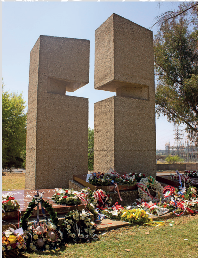
Pomnik w Johannesburgu

środkowa poświęcona jest jeńcom pomordowanym przez NKWD, kolejne upamiętniają żołnierzy powstania warszawskiego oraz lotników 31. i 34. dywizjonów South African Air Force latających z pomocą dla walczącej Warszawy w sierpniu i wrześniu 1944 r. – poległo wówczas 37 lotników południowoafrykańskich. Jest to ważne miejsce pamięci zarówno dla południowoafrykańskiej Polonii, jak i dla miejscowych władz.