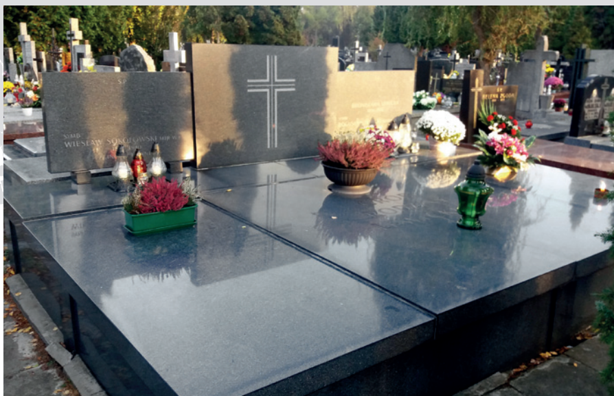
Grób rodzin Lewickich i Sokołowskich na cmentarzu parafialnym w Marysinie Wawerskim (Warszawa). Upamiętnienie mjr. Wiesława Sokołowskiego, pochowanego w Charkowie