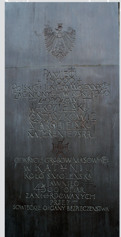
Pomnik katyński w Toronto