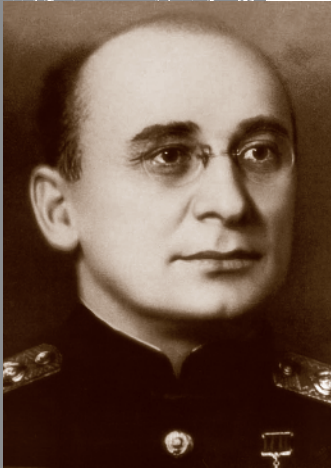
Szef NKWD Ławrentij Beria

mieli zostać rozstrzelani. Ponadto Beria proponował zgładzenie 11 tys. obywateli polskich aresztowanych przez NKWD i przebywających w więzieniach na okupowanych przez ZSRS ziemiach polskich.