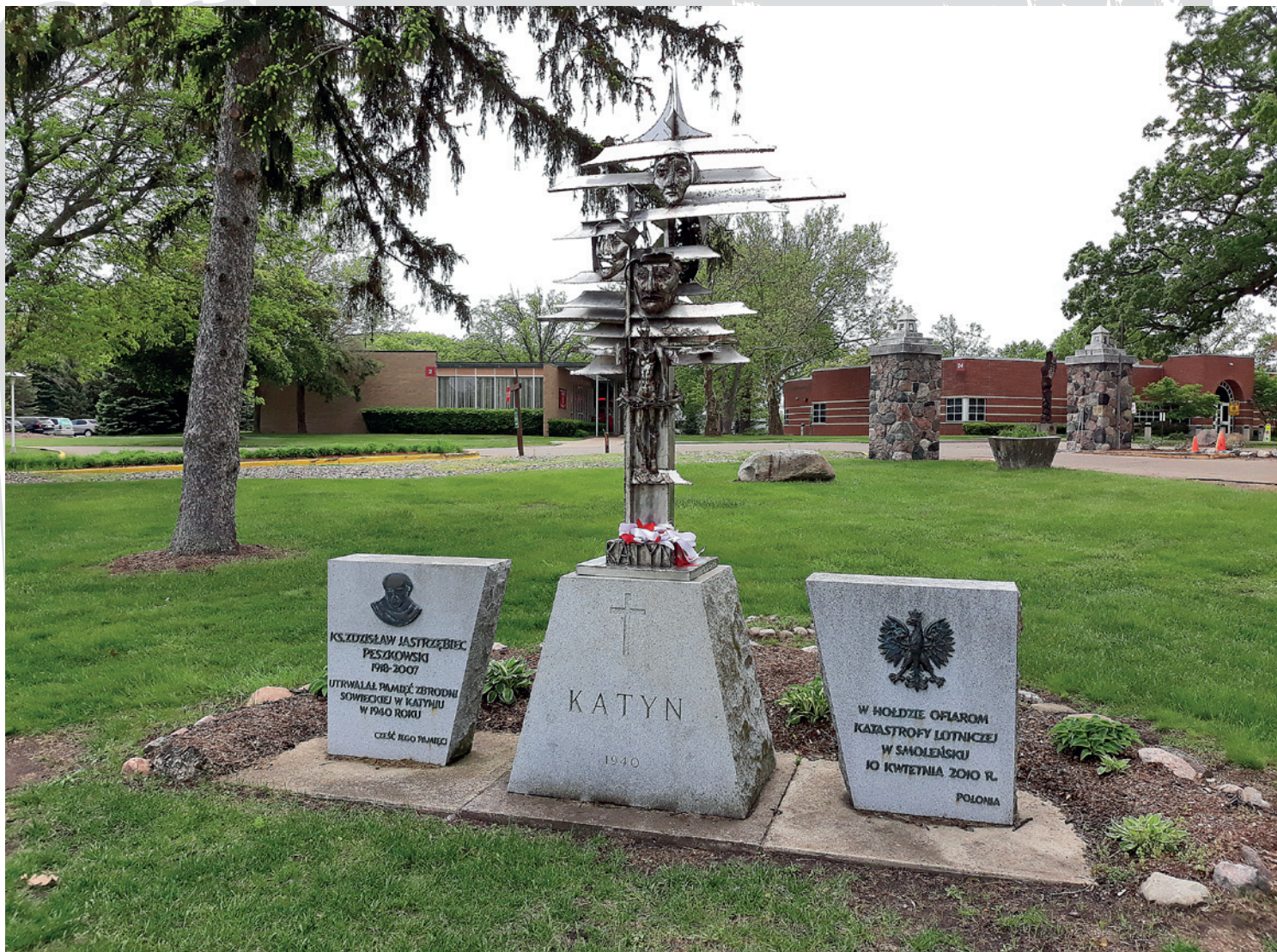
Pomnik w Orchard Lake