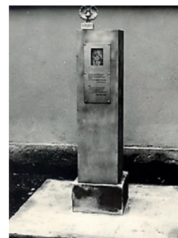
Pierwszy pomnik katyński w Sztokholmie