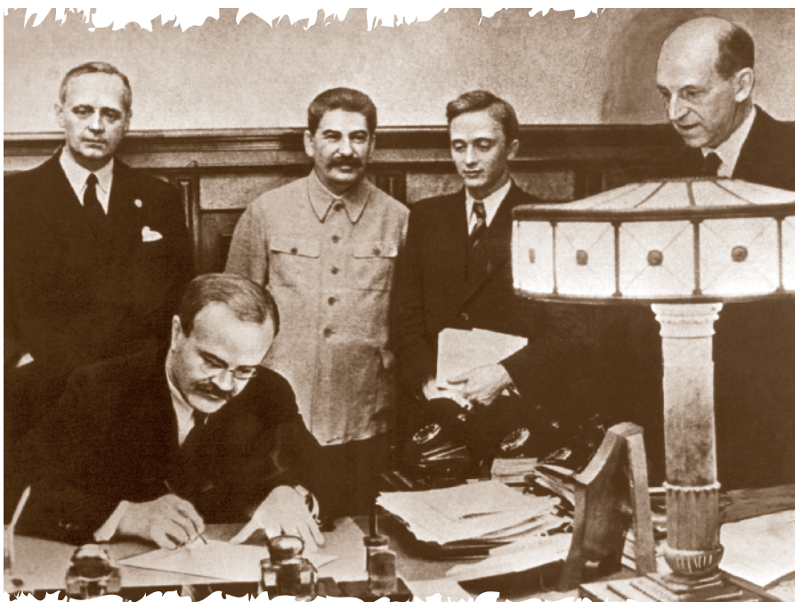
Podpisanie układu Ribbentrop-Mołotow

Oficerów poddano też zmasowanemu oddziaływaniu ideologicznemu; zamierzano – jak można przypuszczać – przekształcić ich w zwolenników komunizmu i władzy sowieckiej. Akcja ta zakończyła się fiaskiem. Jeńcy – z nielicznymi wyjątkami – pozostali wierni Polsce i absolutnie przekonani, że Rzeczpospolita się odrodzi, a okupanci poniosą klęskę.