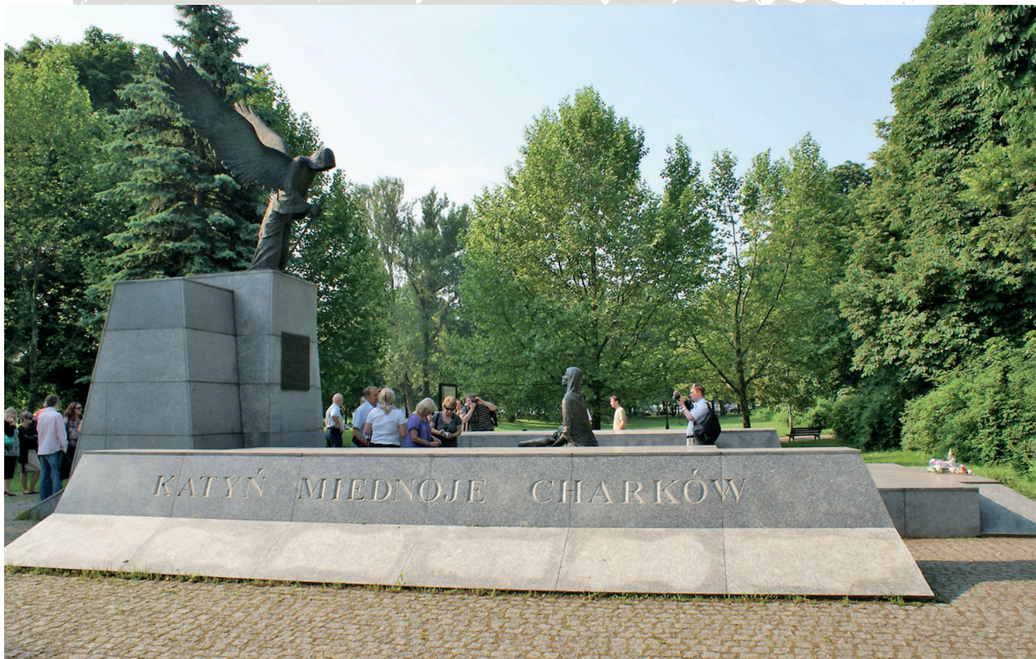
Pomnik Ofiar Zbrodni Katyńskiej, park Juliusza Słowackiego we Wrocławiu (fot. A. Siwek 2010)