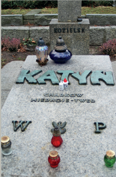
Dolinka Katyńska na Cmentarzu Wojskowym na Powązkach

i wywieziony przez komunistyczną Służbę Bezpieczeństwa. 6 grudnia 1981 r. nowo powołany Obywatelski Komitet Budowy Pomnika Ofiar Katynia podczas wielotysięcznej manifestacji ustawił prowizoryczny krzyż brzozy. Władze komunistyczne usunęły ten krzyż po wprowadzeniu 13 grudnia 1981 r. stanu wojennego.