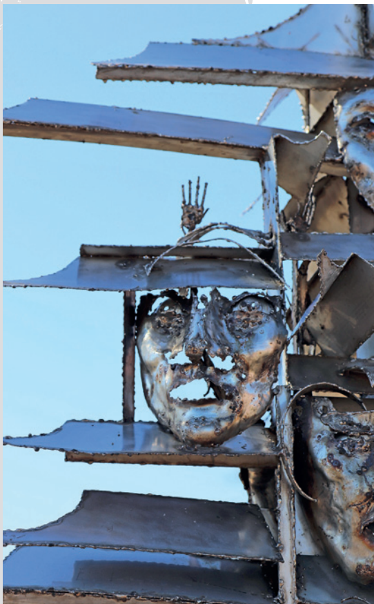
Pomnik w Orchard Lake