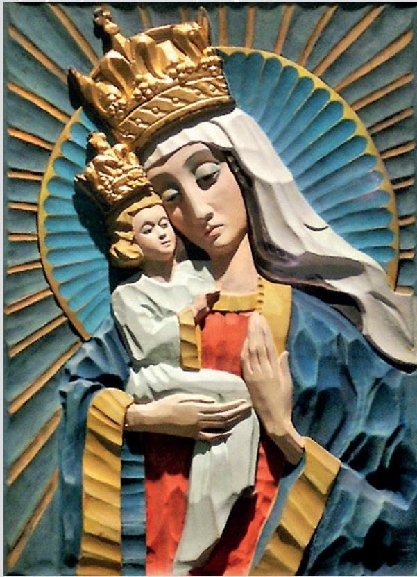
Kaplica w prawej nawie kościół św. Andrzeja Boboli w Londynie