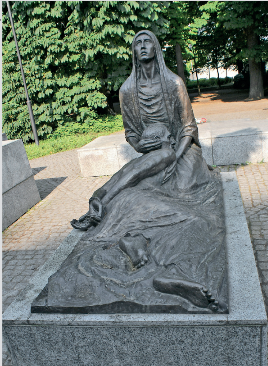
Pomnik Ofiar Zbrodni Katyńskiej, park Juliusza Słowackiego we Wrocławiu