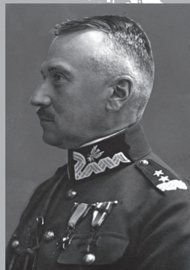
Jeden z zamordowanych jeńców gen. Stanisław Haller