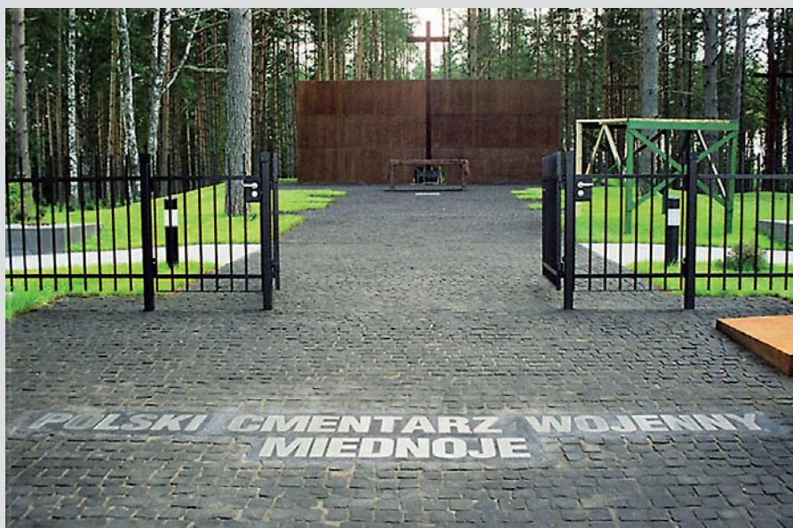
Polski Cmentarz Wojenny w Miednoje