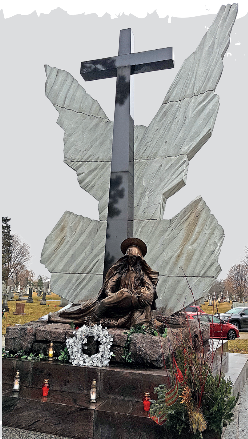
Pomnik w Chicago