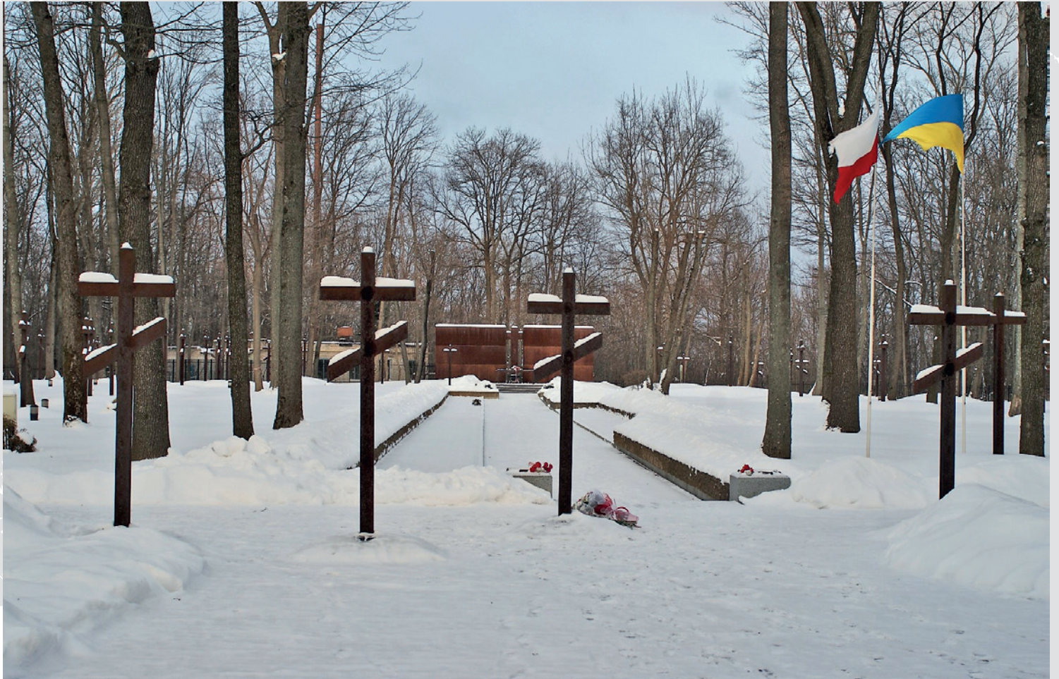
Cmentarz Ofiar Totalitary- zmu w Charkowie