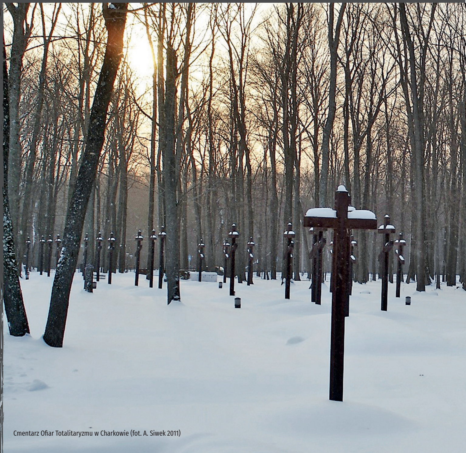
Cmentarz Ofiar Totalitaryzmu w Charkowie