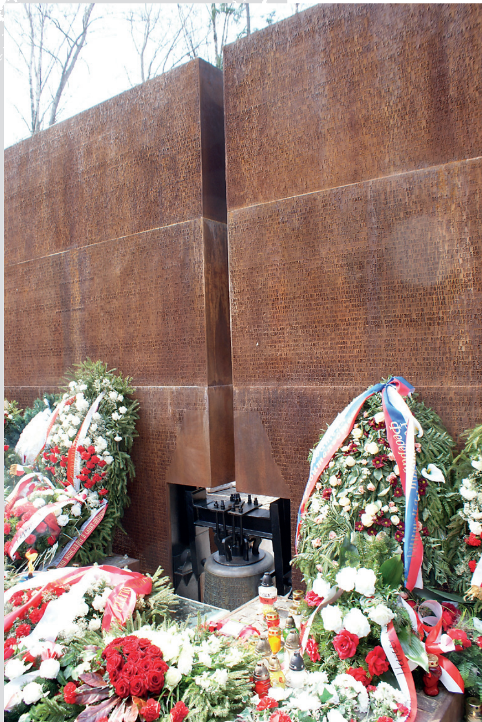
Polski Cmentarz Wojenny w Katyniu