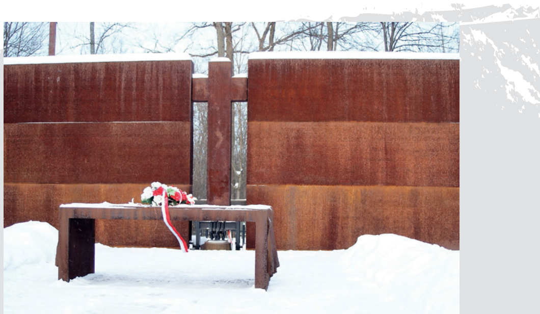
Cmentarz Ofiar Totalitaryzmu w Charkowie

Cmentarz w Bykowni – zaprojektowany przez pracownię Air Projekt Robert Głowacki oraz firmę Moderau Art Marek Moderau – również zawiera wszystkie wymienione elementy, jednak w nieco innej interpretacji. Zamiast korodującego metalu zastosowano szary, szlachetny granit, a dzwon zawieszono na niskiej dzwonnicy ozdobionej symbolami wyznań i religii.