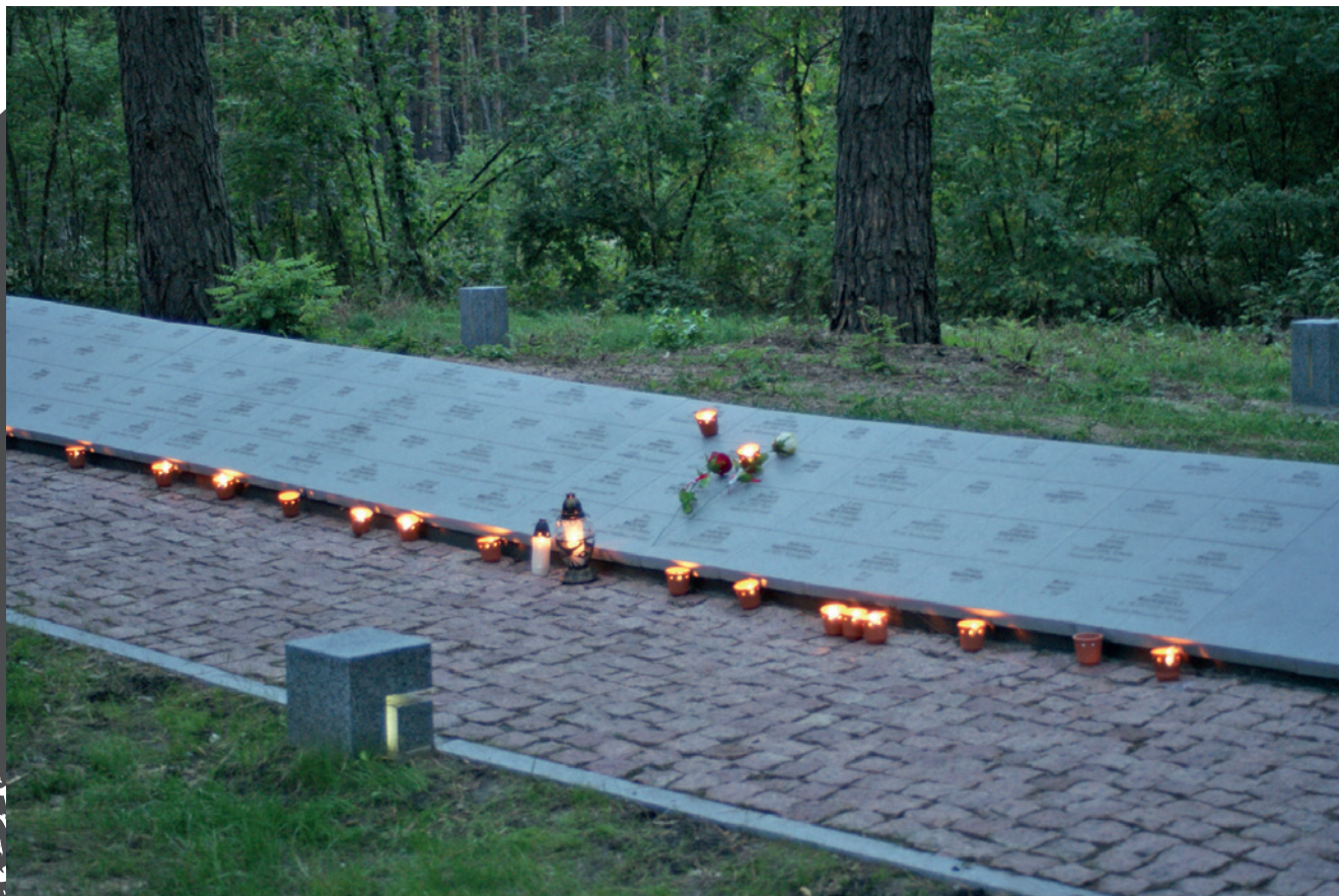
Polski Cmentarz Wojenny w Kijowie-Bykowni