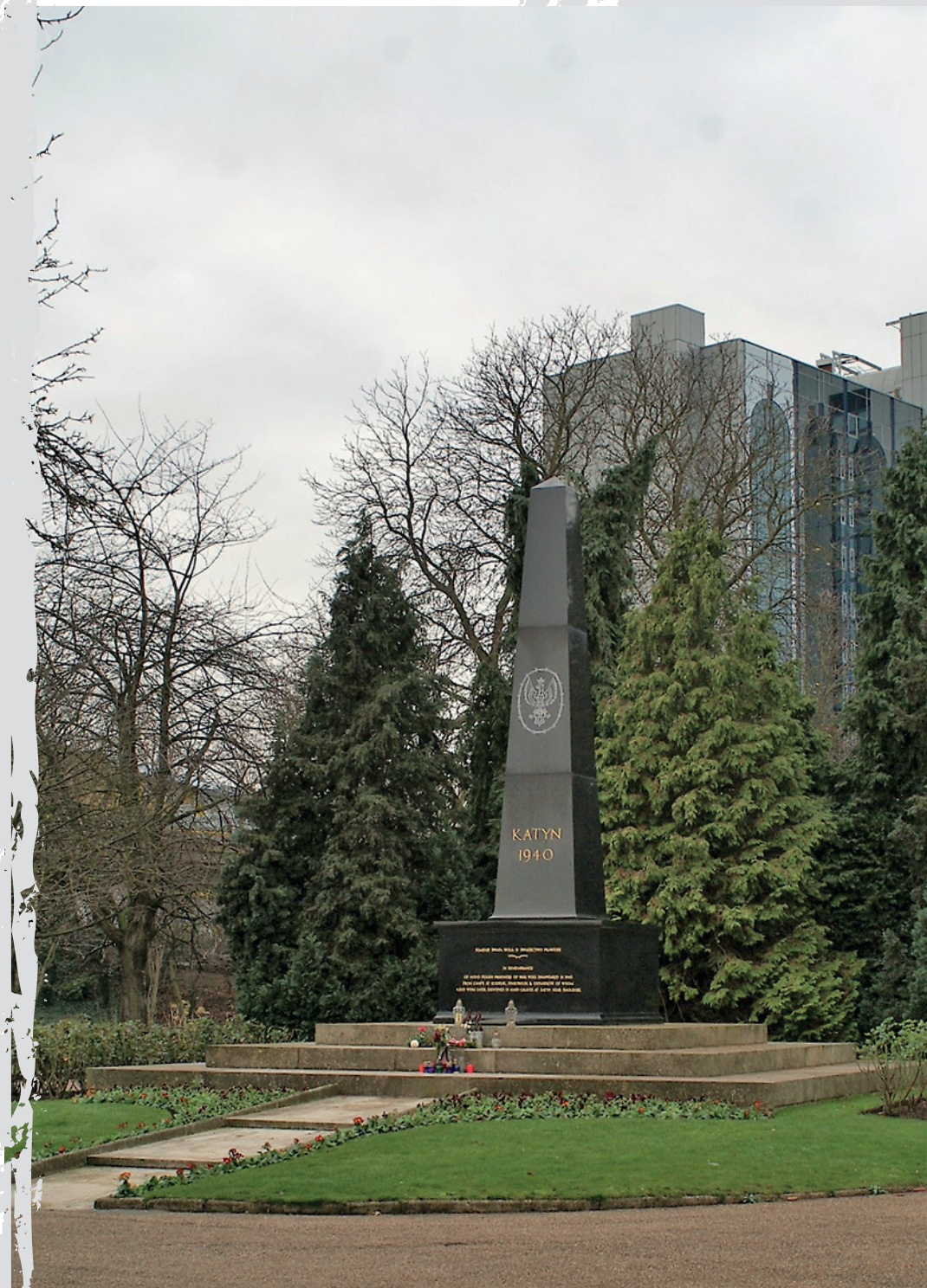
Pomnik na cmentarzu w Gunnersbury w Londynie