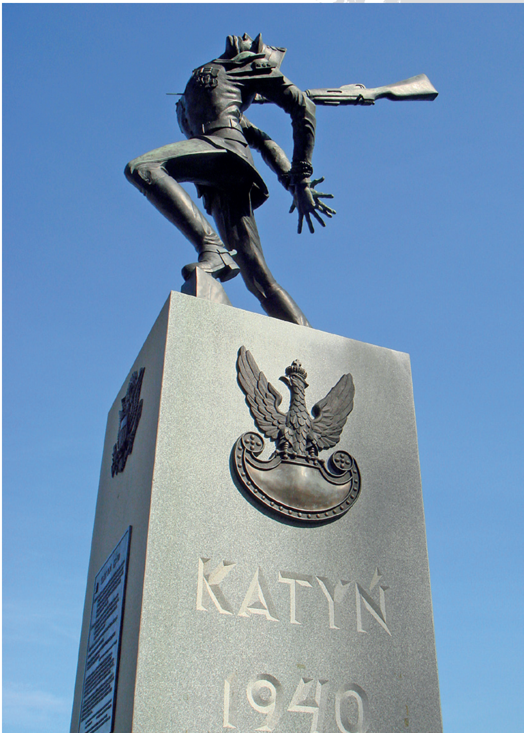
Pomnik w Jersey City