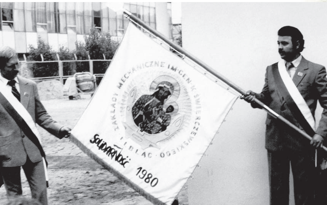
Obchody pierwszej rocznicy Sierpnia '80, 14 sierpnia 1981 r.