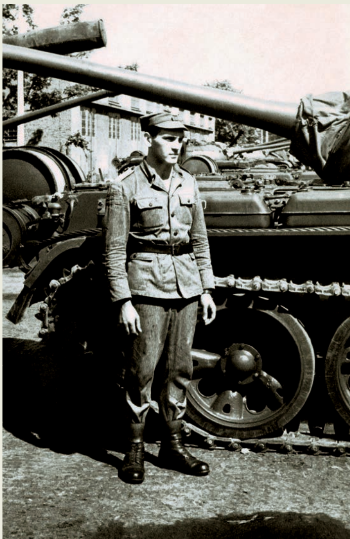
Jednostka wojskowa w Elblągu, sierpień 1966 r.