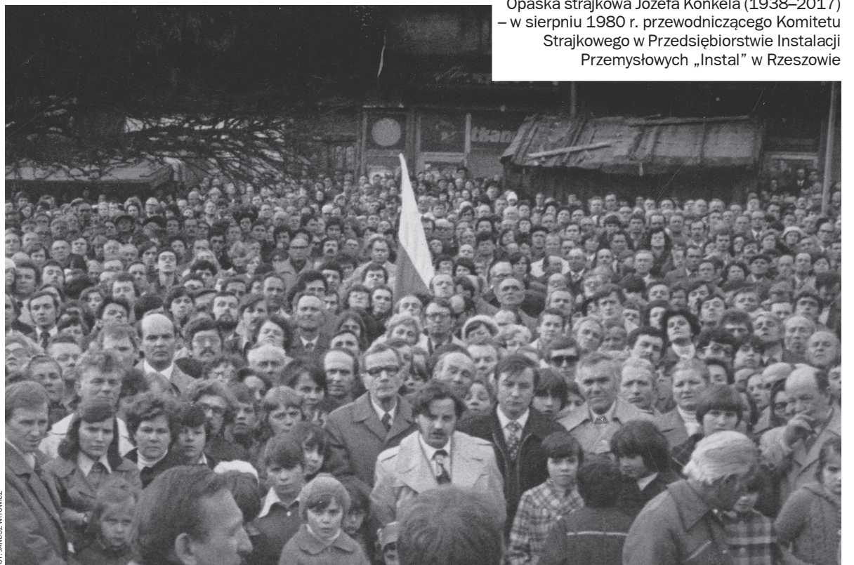
Manifestacja na Rynku w Rzeszowie 3 maja 1981 r.

Jako symbol wskazujący na ważny aspekt tej rewolucji społecznej skojarzył mi się obrazek z wizyty papieża Jana Pawła II w Polsce w 1979 r. opisaną przez Zbigniewa Bujaka następująco: „Muszę powiedzieć, że rosło me serce, gdy widziałem, jak najwierniejsze towarzyski na widok papieża waliły się na kolana. O, myślę sobie, skoro aparat partyjny, ci najwierniejsi z wiernych, tak wita papieża, to znaczy, że władza partii już się wali”. Sierpień '80 sprawił natomiast, że naród wstał z kolan i nie zamierzał wrócić już do dawnych form korzenia się przed partią i jej władzą. Nastąpiła tym samym wyjątkowa zamiana miejsc, przypominająca apokaliptyczne zapowiedzi, że nadejdzie czas, w którym ludzie uzyskają wyjątkową umiejętność rozróżniania prawdy i fałszu, dobra i zła. Do ludzi reżimu dotarło, przynajmniej w jakimś