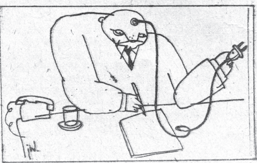
Rysunek Jacka Woźniaka (ur. 1954) zamieszczony w jednym z numerów bezdebitowego satyrycznego miesięcznika „WRJ”, ukazującego się w Rzeszowie w 1981 r.

„Chciałbym Cię widzieć Ojczyzno Jak dziewczynę z rozwianymi [włosami Ojczyznę młodych pięknych serc Solidarnością złączoną i szczęśliwą [bez granic”.