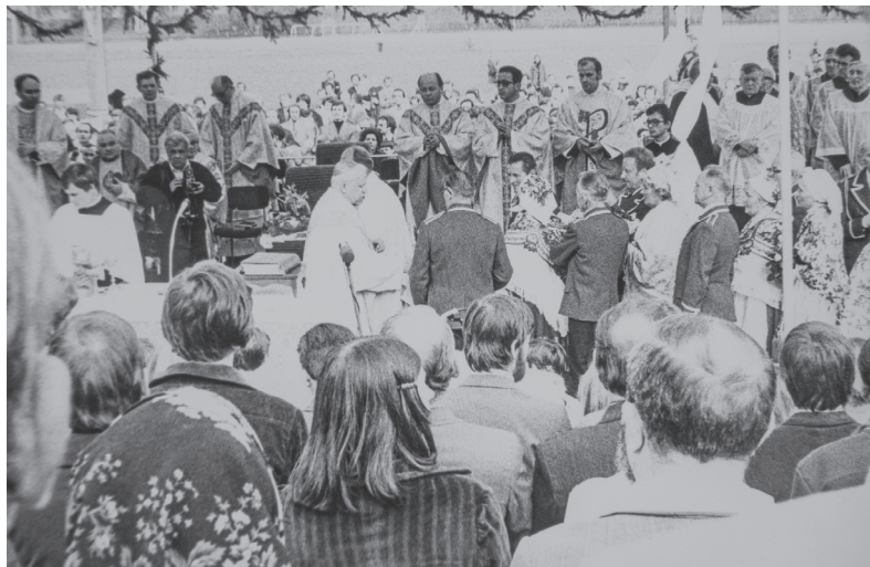
Poświęcenie przez bp. Ignacego Tokarczuka sztandaru Komisji Zakładowej NSZZ „Solidarność” WSK–PZL Rzeszów na stadionie „Stali” Rzeszów, 20 IX 1981 r. Pośrodku bp Ignacy Tokarczuk

Powstanie Niezależnego Samorządnego Związku Zawodowego „Solidarność” uczyniło wyłom w systemie rządów sprawowanych przez komunistów. „Solidarność” była jedyną masową organizacją w krajach tzw. bloku wschodniego, która pozostawała poza kontrolą władz. Pomimo oficjalnej delegalizacji w stanie wojennym nie zdołano jej unicestwić. Ostatecznie „Solidarność” doprowadziła do zmian ustrojowych i odzyskania suwerenności przez Polskę. Jej działania w istotny sposób przyczyniły się też do upadku systemu rządów komunistycznych w Europie Wschodniej i na świecie.