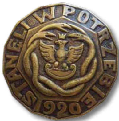
Odznaka pamiątkowa „Stanęli w potrzebie 1920”, rozprowadzana wśród żołnierzy Armii Ochotniczej i osób wspierających działania wojenne (zbiory autora)