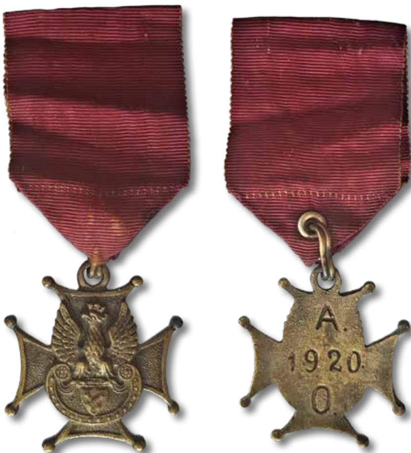
Awers i rewers Krzyża Armii Ochotniczej. Nie miał on statusu odznaczenia ustawowego; nosili go żołnierze weterani jednostek ochotniczych walczących w 1920 r. (zbiory Stowarzyszenia Klub Miłośników Dawnych Militariów Polskich)