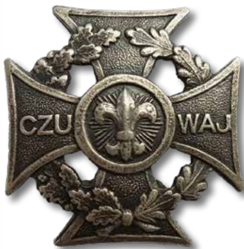
Krzyż harcerski wykonany przez warszawskiego grawera Józefa Chylińskiego od drugiej połowy 1915 lub od 1916 r. Ten wzór odznaki harcerze nosili na mundurach podczas wojny polsko-bolszewickiej

W listopadzie 1918 r. w ramach samoobrony przed wycofującymi się Niemcami, bolszewikami i bandami rabunkowymi powstała w Wilnie kompania szkolna. W jej skład wszedł pluton harcerski, który wziął udział w rozbrajaniu Niemców. Pluton rozrósł się potem do kompanii, której większość stanowili harcerze. Na początku stycznia 1919 r. liczyła