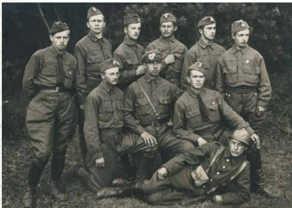
Żołnierze Armii Ochotniczej. Żołnierz kłęczący pośrodku ma przypiętą do czapki biało-czerwoną rozetę – oznakę formacji, Rembertów, lato 1920 r.