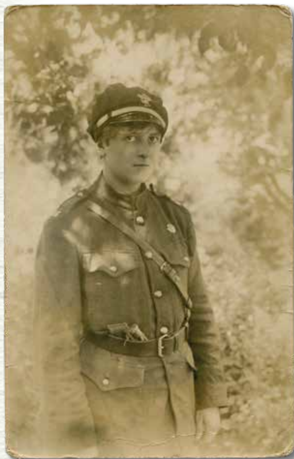
N.N., harcerka-żołnierz. Na czapce przypięty gryf, na naramienniku cyfry 66 oznaczające numer Kaszubskiego Pułku Piechoty, nad lewą kieszenią munduru wpięty krzyż harcerski, za pasem rewolwer małego kalibru, lato 1920 r. Formowanie pułku rozpoczęto w październiku 1919 r., zakończono w maju roku następnego. Pierwsze walki z bolszewikami pułk stoczył 26 czerwca 1920 r. pod Bobrujkami, a najcięższe w dniach 14–24 września o Horodec (zbiory autora)