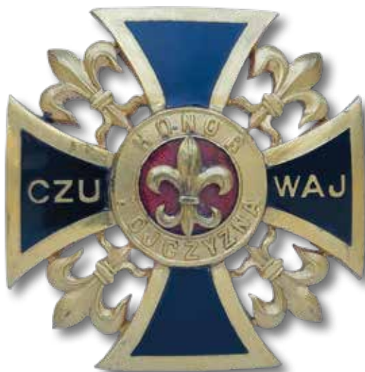
Honorowy Krzyż Harcerzy z Czasów Walk o Niepodległość, nadawany za czyny dokonane w latach 1909–1921, ustanowiony w 1938 r.