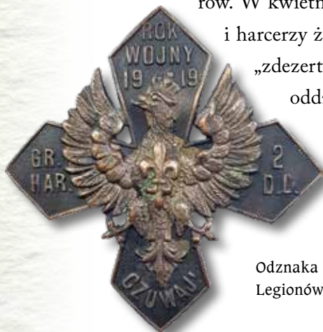
Odznaka Grupy Harcerskiej przy 2. Dywizji Piechoty Legionów

W listopadzie 1918 r. z odsieczą dla Lwowa wyruszyli harcerze z okręgu krakowskiego. Ochotnicy z Krakowa, Tar-