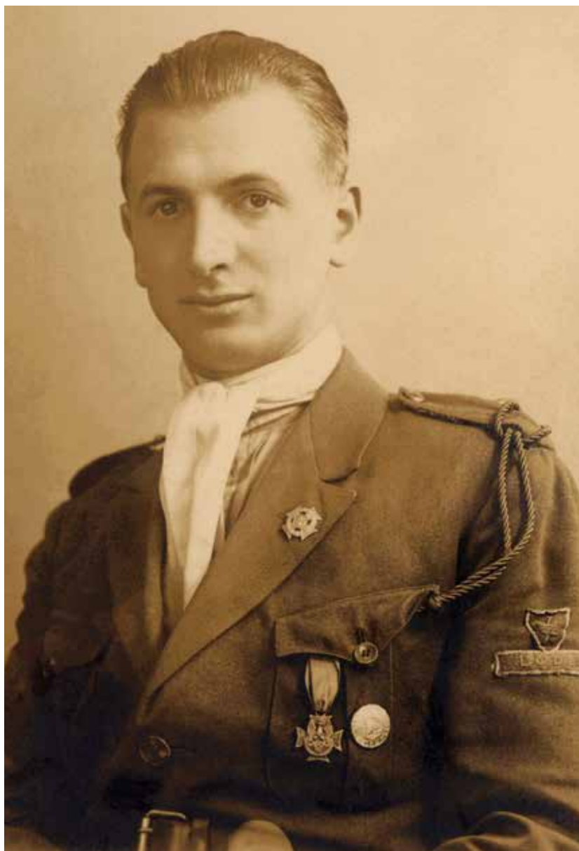
Janusz [N.N.] – łódzki instruktor harcerski, przypuszczalnie drużynowy, w klapie munduru krzyż harcerski, na lewym rękawie znaki środowiska służby: herb miasta i wstęga z napisem „Łódź”, na lewej kieszeni krzyż Armii Ochotniczej i odznaka „Stanęli w potrzebie 1920”