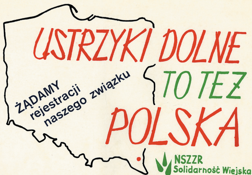
Plakat Komitetu Strajkowego w Ustrzykach Dolnych.

W jednej z ulotek zredagowanych przez działaczy „Solidarności Wiejskiej” informującej o celu strajków rozpoczętych 29 grudnia 1980 r. w Ustrzykach Dolnych, a następnie kontynuowanych w Rzeszowie stwierdzali oni: „Powstanie Niezależnego