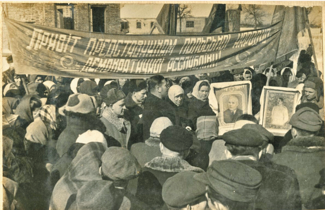
Powitanie delegacji polskich chłopów w obwodzie połtańskim w kolchozie „Czerwona Gwiazda”, 1948/1949.

Pod koniec 1953 roku nastąpił spadek tempa uspołdzielczania, który utrzymał się praktycznie do roku 1956. Przyczyn tego zjawiska było kilka: pogarszająca się sytuacja aprowizacyjna kraju (wręcz widmo głodu), zmuszająca do zmian w polityce rolnej; ujawnianie kolejnych przykładów „wypaczeń” przy tworzeniu spółdzielni; narastająca „odwilż” po śmierci Stalina. Na przełomie lata i jesieni 1956 r. nastąpiło osłabienie represyjności aparatu bezpieczeństwa. Oddolne inicjatywy demontażu stalinowskiego porządku na wsi mogły zakończyć się sukcesem. Gdy na VIII Plenum KC PZPR (19-21 X 1956 r.) Władysław Gomułka poddał krytykę politykę rolną lat 1948-1956, sugerując możliwość rozwiązania nierentownych gospodarstw spółdzielczych, chłopci odebrali jego przemówienie jako sygnał do likwidacji kolchozów. Nastąpiła gwałtowna i oddolna dekollektywizacja. W ciągu dwóch miesięcy, w skali kraju rozwiązało się ponad 8 tysięcy spółdzielni produkcyjnych; 31 XII 1956 r. pozostały za-