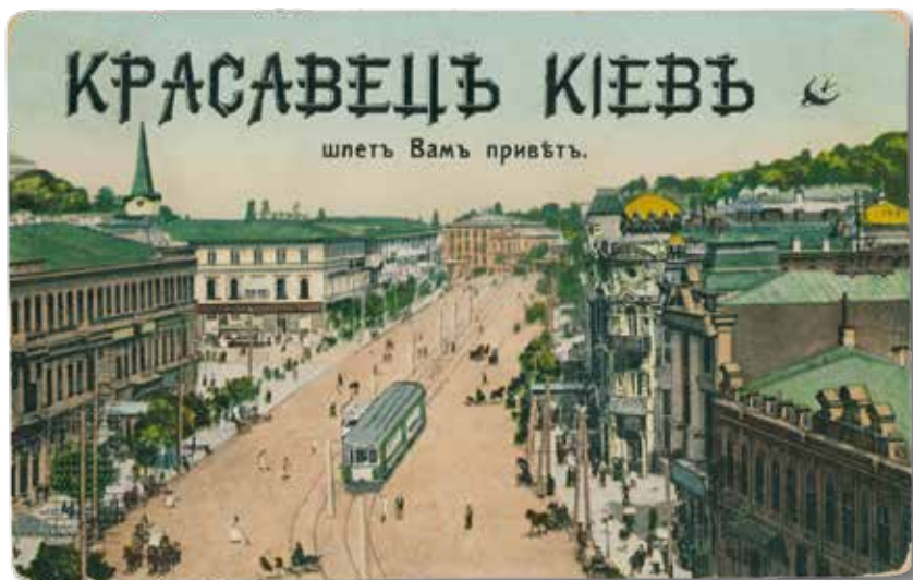
„Piękny Kijów przesyła wam pozdrowienia”, Kijów, ok. 1911 r. (pocztówka ze zbiorów M. Miszczuka)

do eksploatacji główny gmach Instytutu. Na uczelni zdobywało wyższe wykształcenie 1200 studentów. Władze carskie nie żałowały środków na rosyjskie uczelnie wyższe w Kijowie, które traktowały nie tylko jako ośrodki kształcenia wysoko kwalifikowanych kadr, lecz także ośrodki rusyfikacji. Nekrasz i inni polscy studenci umieli jednak odróżnić wysoki poziom nauczania od prób rusyfikacji.