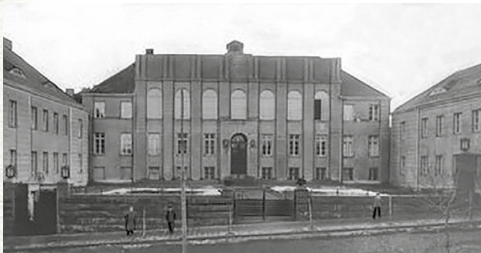
Gmach oddziału Państwowego Banku Rolnego w Łucku, listopad 1930 r.

Banku Rolnego w Łucku, początkowo jako sekretarz, a następnie jako naczelnik wydziału sekretariatu.