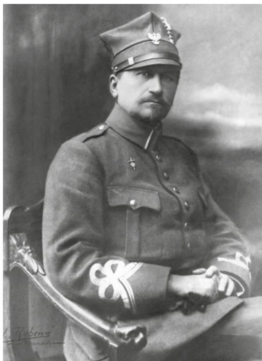
Generał Józef Dowbor-Muśnicki, dowódca I Korpusu Polskiego w Rosji, na zdjęciu jako dowódca Armii Wielkopolskiej, 1919 r.

Po rozwiązaniu i demobilizacji tej formacji wrócił do Kijowa. Na przełomie czerwca i lipca 1918 r. wziął udział w słynnym kursie w willi Kiń Grust' (Porzuc Smutek) jako kierownik działu pionierki. W kursie