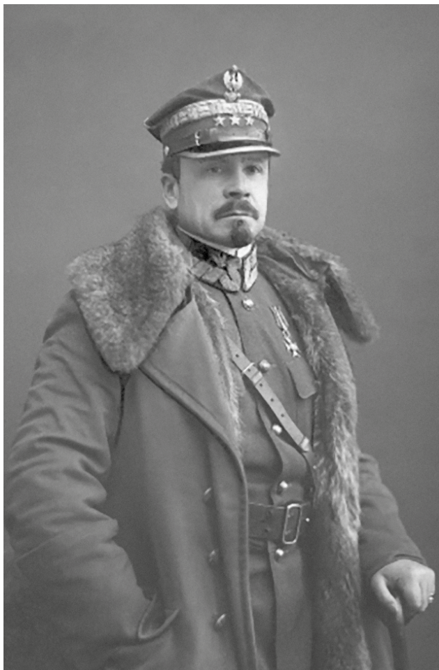
Generał broni Józef Haller, zdjęcie z lat dwudziestych

Po wyjściu ze szpitala w latach 1919–1920 pracował w Dowództwie Okręgu Generalnego w Warszawie oraz kontynuował studia rolnicze w Szkole Głównej Gospodarstwa Wiejskiego w Warszawie. 25 września 1919 r. został mianowany kierownikiem Wydziału Technicznego Głównej Kwatery Męskiej ZHP. W Związku przykładano dużą wagę do przyswojenia sobie przez harcerzy konkretnych umie-