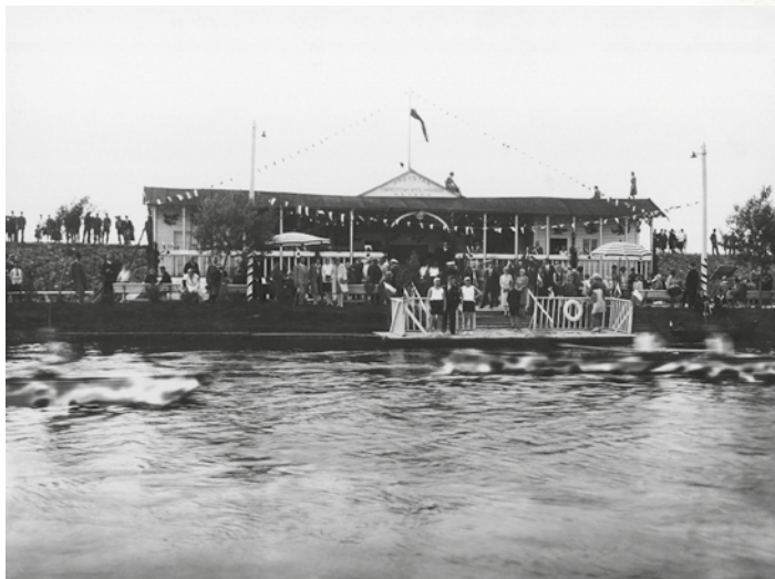
Przystań Towarzystwa Wioślarskiego w Łucku nad Styrem