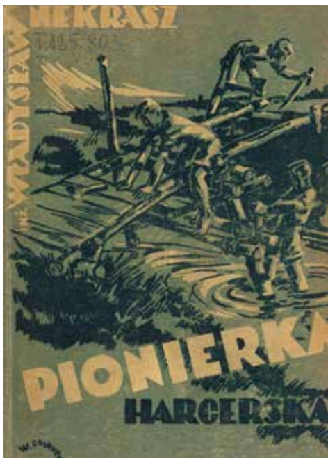
Okładka Pionierki harcerskiej, 1939 r.