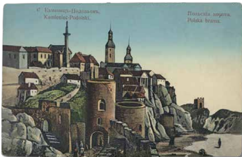
Brama Polska w Kamieńcu Podolskim, ok. 1911 r.

Po ukończeniu szkoły średniej w latach 1910–1912 pracował na folwarku dzierżawionym przez ojca, co traktował jako praktykę przed rozpoczęciem nauki na poziomie wyższym. W 1912 r. rozpoczął studia rolnicze w Kijowskim Instytucie Politechnicznym. W 1902 r. oddano