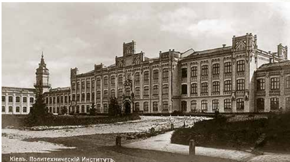
Gmach główny Instytutu Politechnicznego, ok. 1905 r.