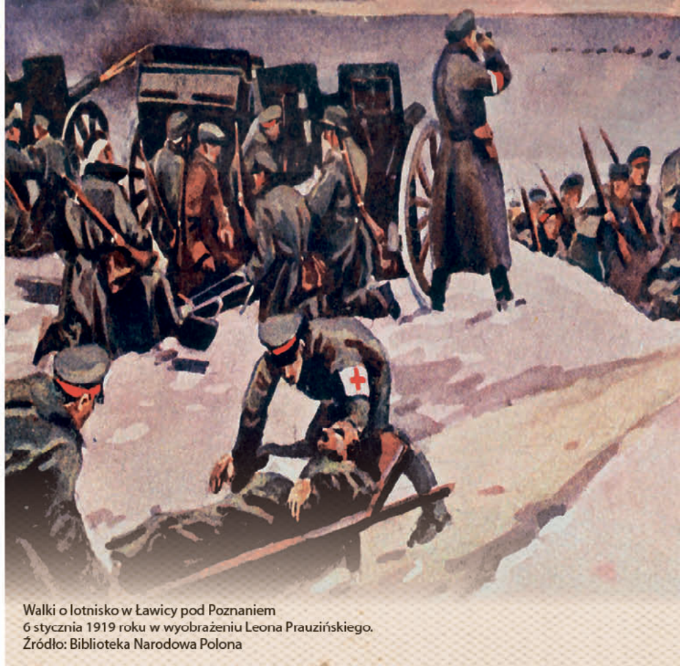
Walki o lotnisko w Ławicy pod Poznaniem 6 stycznia 1919 roku w wyobrażeniu Leona Prauzińskiego.