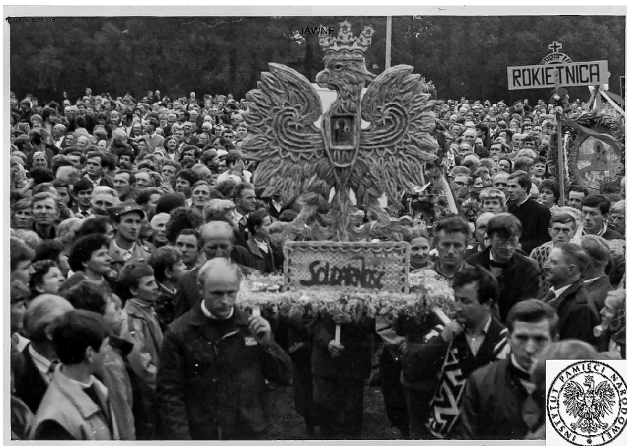
Ilustracja 69. Dożynki na Jasnej Górze, 1987, Częstochowa (AIPN Bi, Kolekcja: Jan Beszta-Borowski, 625/35, s. 154).