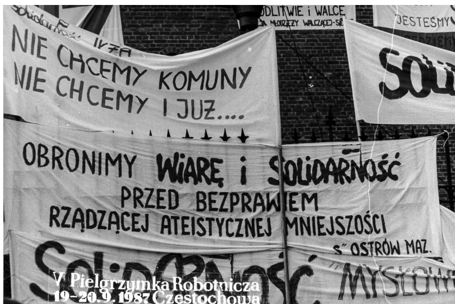
Ilustracja 60. Transparenty. V Pielgrzymka Ludzi Pracy (Robotnicza) na Jasną Górę, 19–20 IX 1987 r., Częstochowa (AAN, Archiwum Zbigniewa Romaszewskiego, sygn. 336, k. 2).