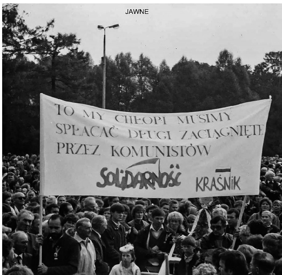
Ilustracja 68. Dożynki na Jasnej Górze, 1987, Częstochowa (AIPN Bi, Kolekcja: Jan Beszta-Borowski, 625/35, s. 161).

„Wykorzystuje się przy tym tendencje partykularne poszczególnych osób. Podejmuje się przedsięwzięcia mające na celu izolację poszczególnych znanych działaczy [...] w środowisku zamieszkania i w miejscu pracy, wykorzystując do tego informacje, które ich kompromitują i ośmieszają” 394 .