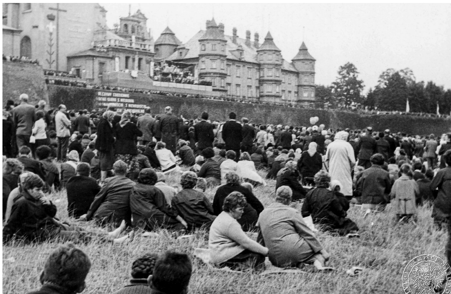
Ilustracja 14. Materiały operacyjne SB. Przybyli na Jasną Górę uczestnicy uroczystości podczas odpoczynku. Sierpień 1968 r., Częstochowa (AIPN Ka, 056/56, t. 2, s. 14).