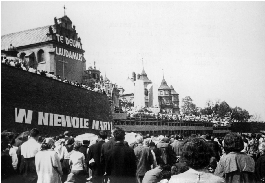
Ilustracja 4. Uczestnicy uroczystości milenijnych zgromadzeni na placu i na wałach jasnogórskich. 3 V 1966 r., Częstochowa (NAC, Zbiór fotografii dotyczących obchodów kościelnych Tysiąclecia Chrztu Polski, 3/19/0/-/3).