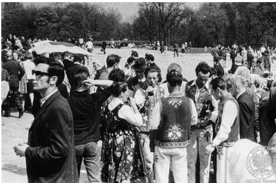
Ilustracja 24. Materiały operacyjne SB. Grupa uczestników uroczystości jasnogórskich w strojach ludowych, prawdopodobnie oczekujących na nabożeństwo. Przed nimi, na pierwszym planie, mężczyzna w ciemnych okularach obserwuje okolicę. 2–4 V 1969 r., Częstochowa (AIPN Ka, 056/56, t. 3, s. 16).