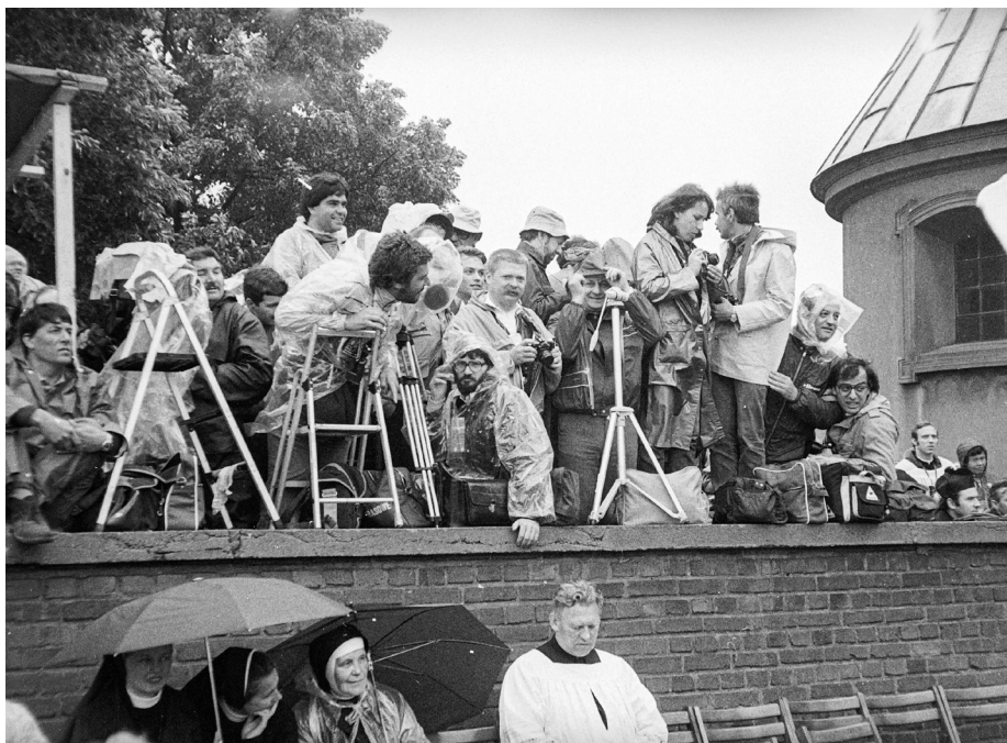
Ilustracja 44. Grupa fotoreporterów przed rozpoczęciem mszy św. jubileuszowej z okazji sześćsetcia klasztoru na Jasnej Górze. 19 VI 1983 r., Częstochowa.

i moralną doskonałość [...]” itd. 161 Komuniści zapędzali się w przeróżnych interpretacjach zapominając, że dopiero co przekreślili narodowi nadzieje na wolność, a papież przybył do Polski wesprzeć nie władze państwowe ale społeczeństwo umęczone trudnościami stanu wojennego 162 .