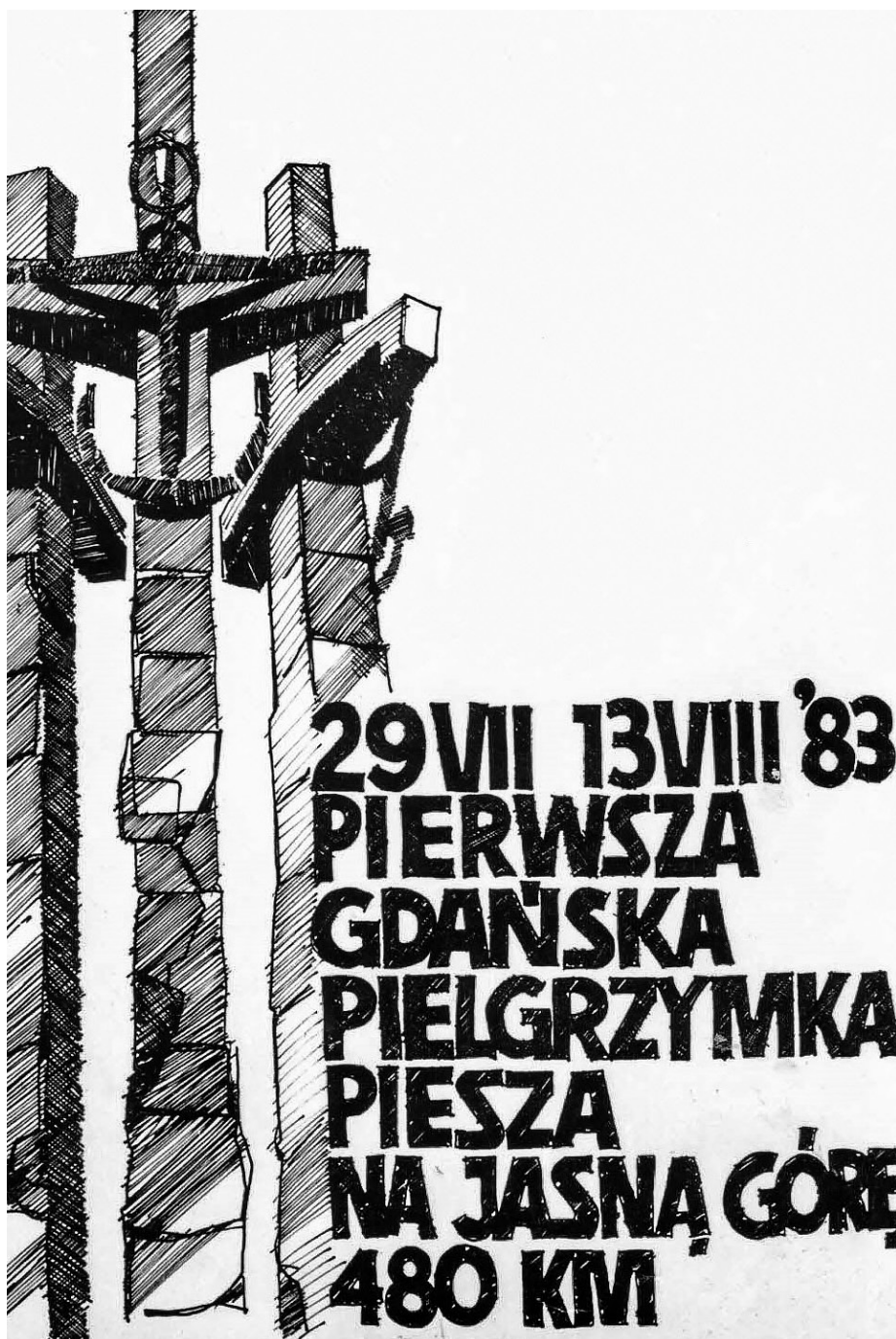
Ilustracja 45. Pocztcówka z I Gdańskiej Pielgrzymki Pieszej na Jasną Górę. 29 VII – 13 VIII 1983 r. (Zbiory prywatne autora).