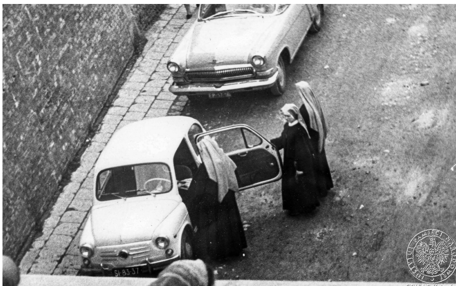
Ilustracja 30. Materiały operacyjne SB. Siostry zakonne przybyłe na uroczystości jasnogórskie. 2–4 V 1968 r., Częstochowa (AIPN Ka, 056/56, t. 1, s. 21).