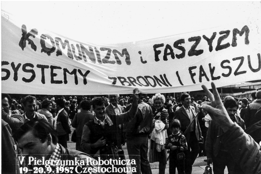
Ilustracja 59. V Pielgrzymka Ludzi Pracy (Robotnicza) na Jasną Górę, Uczestnicy z transparentem. 19–20 IX 1987 r., Częstochowa (AAN, Archiwum Zbigniewa Romaszewskiego, sygn. 336, k. 1).