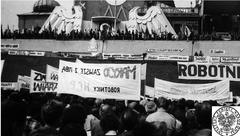
Ilustracja 54. V Pielgrzymka Ludzi Pracy (Robotnicza) na Jasną Górę, 19–20 IX 1987 r., Częstochowa.