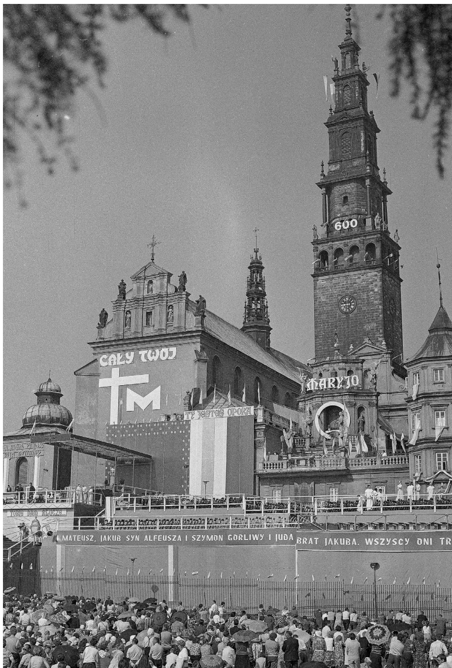
Ilustracja 38. Klasztor jasnogórski przed przybyciem papieża. 4 VI 1979 r., Częstochowa.