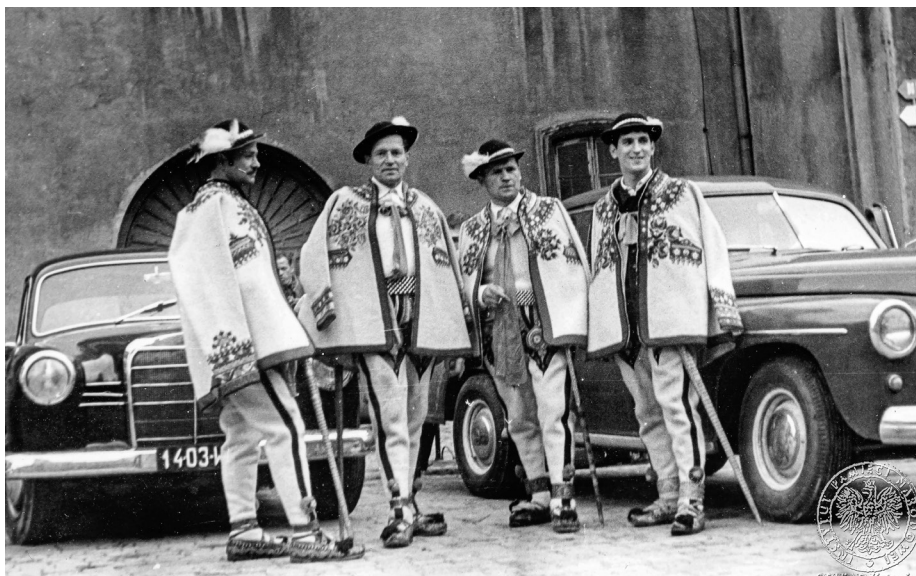
Ilustracja 32. Materiały operacyjne SB. Grupa górali przybyła na uroczystości jasnogórskie. 2–4 V 1968 r., Częstochowa (AIPN Ka, 056/56, t. 1, s. 29).