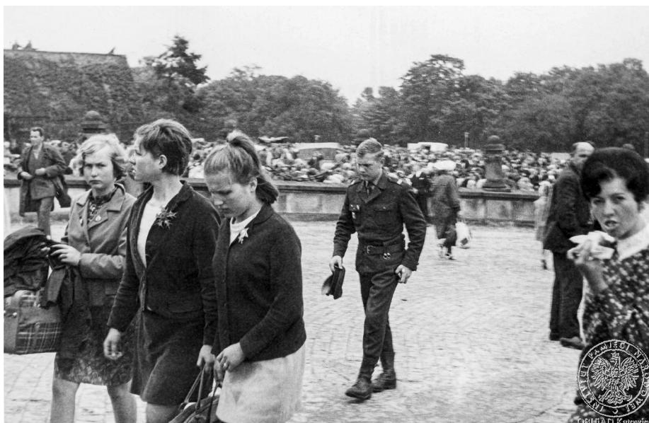
Ilustracja 15. Materiały operacyjne SB. Żołnierz idący do sanktuarium jasnogórskiego. Sierpień 1968 r., Częstochowa (AIPN Ka, 056/56, t. 2, s. 17).