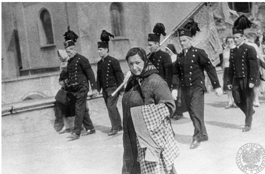
Ilustracja 22. Materiały operacyjne SB. Poczet sztandarowy w strojach górniczych i kobieta przyglądająca się wykonującemu tę fotografię wywiadowcy. 2–4 V 1969 r., Częstochowa (AIPN Ka, 056/56, t. 3, s. 15).