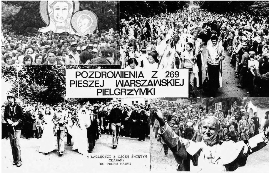
Ilustracja 40. Pocztówka z 269 Pielgrzymki Warszawskiej. Na odwrocie czytamy m.in. „Bukieciak pozdrowień z uroczej, chociaż trudnej wędrowki do Matki Bożej [...] Przejycia są niepowtarzalne [...] Majka”. Wysłana 8 VIII 1980 r. z Nowego Miasta (Zbiory prywatne autora).

rze politycznym 648 . Zapytany o to później przez Aleksandra Merkera bp Dąbrowski tłumaczył, że do pielgrzymki przyłączają się osoby z zewnątrz, a ulotki roznosiła osoba świecka, przebrana za księdza. Tłumaczył, z jakim trudem organizatorzy próbują utrzymać porządek i uniknąć incydentów politycznych 649 .