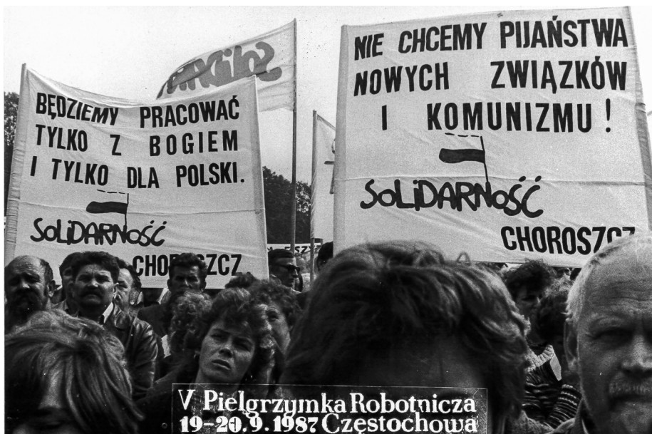
Ilustracja 64. V Pielgrzymka Ludzi Pracy (Robotnicza) na Jasną Górę, Uczestnicy z transparentami. 19–20 IX 1987 r., Częstochowa.