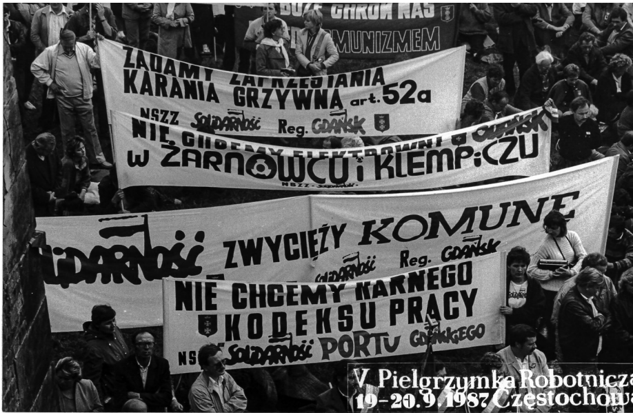
Ilustracja 62. Uczestnicy V Pielgrzymki Ludzi Pracy (Robotniczej) na Jasną Górę z licznymi transparentami, 19–20 IX 1987 r., Częstochowa.