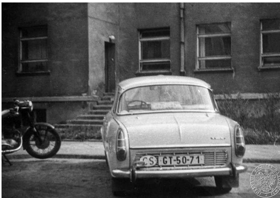
Ilustracja 12. Materiały operacyjne SB. Samochód z zagraniczną rejestracją, zaparkowany w pobliżu sanktuarium jasnogórskiego. 2–4 V 1969 r., Częstochowa (AIPN Ka, 056/56, t. 2, s. 5).