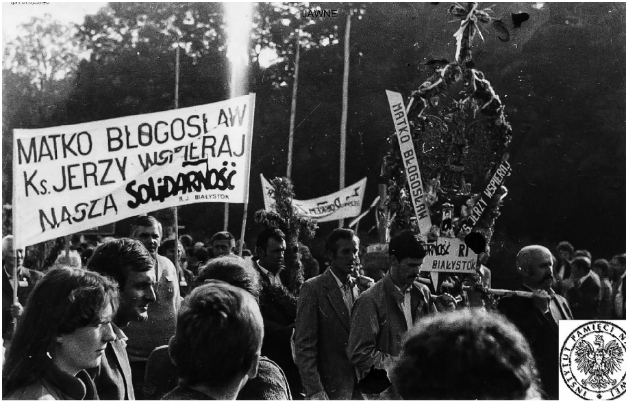
Ilustracja 48. Delegacja działaczy „Solidarności” z ziemi białostockiej na dożynkach, 1985, Częstochowa.

Pielgrzymka Piesza ze Stalowej Woli 232 , a 25 listopada przybyła Pierwsza Ogólnopolska Pielgrzymka Kolarzy 233 . Od 1985 r. do Częstochowy przybywała Szczecińska Piesza Pielgrzymka, co było rozwinięciem inicjatywy duszpasterstwa akademickiego ojców jezuitów w Szczecinie, organizujących pielgrzymki w latach 1983–1984 234 .