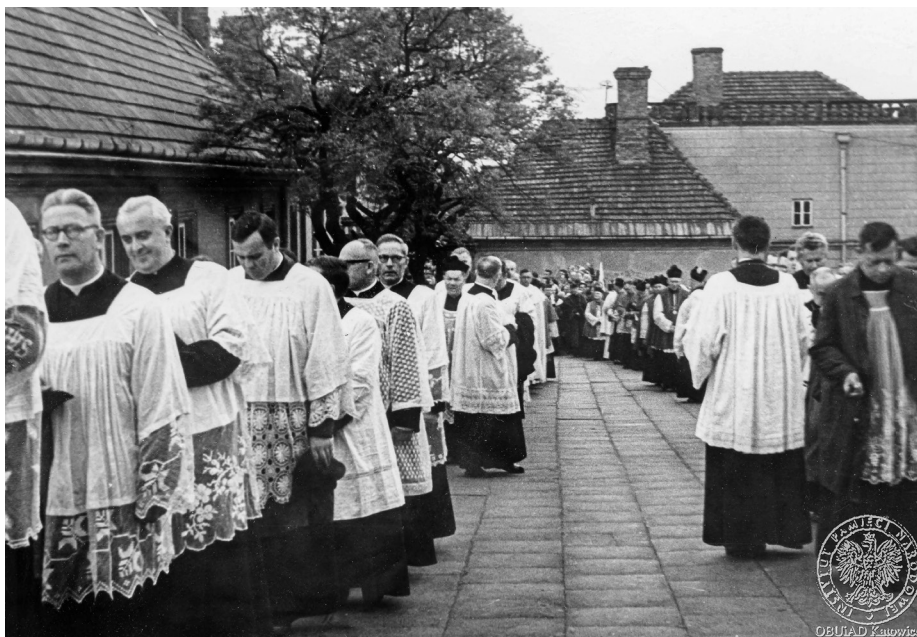
Ilustracja 27. Materiały operacyjne SB. Księża przygotowujący się do procesji. 2–4 V 1968 r., Częstochowa.