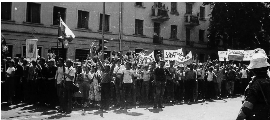
Ilustracja 51. II Pielgrzymka Ludzi Pracy (Robotnicza) na Jasną Górę, 30 IX 1984 r., Częstochowa (AIPN Bi, Kolekcja: Marian Chojnowski, 610/8, s. 28).

z napisem Bóg i Ojczyzna – II Pielgrzymka Ludzi Pracy – Jasna Góra 30 IX 1984. Do znaczków były dołączone ulotki z treścią wiersza 245 .