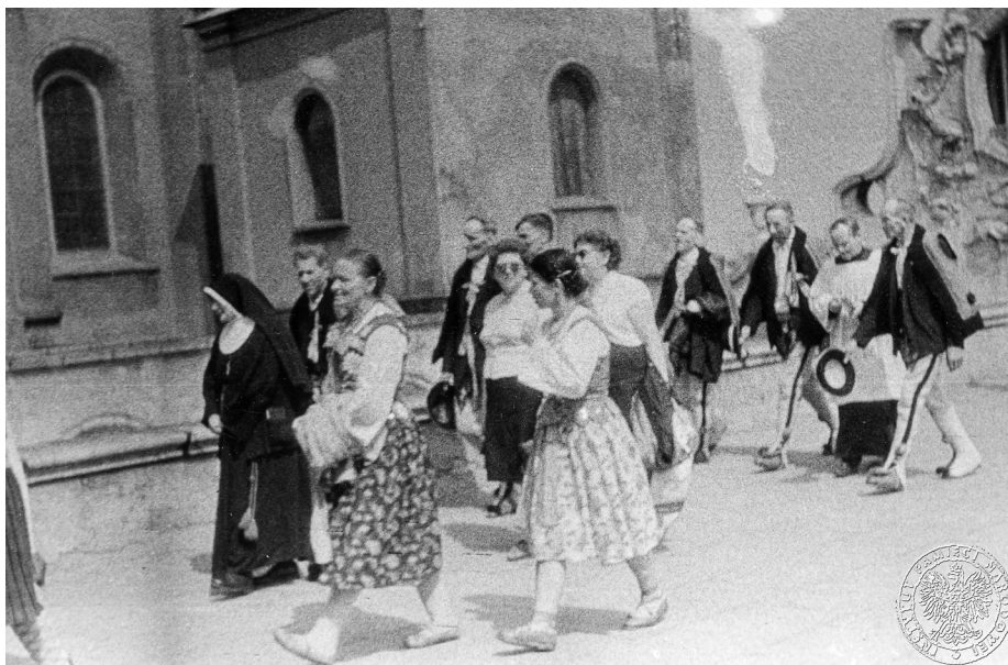
Ilustracja 26. Materiały operacyjne SB. Grupa uczestników uroczystości jasnogórskich w strojach ludowych. 2–4 V 1969 r., Częstochowa.