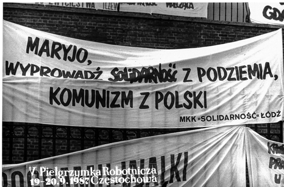
Ilustracja 65. Transparenty. V Pielgrzymka Ludzi Pracy (Robotnicza) na Jasną Górę, 19–20 IX 1987 r., Częstochowa (AAN, Archiwum Zbigniewa Romaszewskiego, sygn. 336, k. 8).