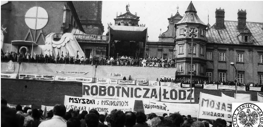
Ilustracja 55. V Pielgrzymka Ludzi Pracy (Robotnicza) na Jasną Górę. 19–20 IX 1987 r., Częstochowa.