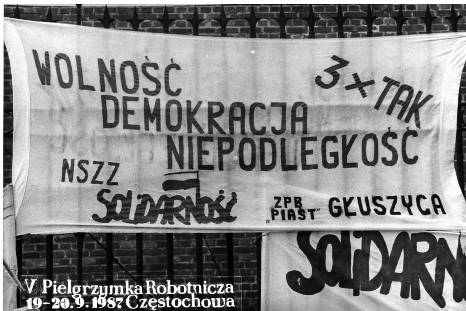
Ilustracja 61. Transparenty. V Pielgrzymka Ludzi Pracy (Robotnicza) na Jasną Górę, 19–20 IX 1987 r., Częstochowa (AAN, Archiwum Zbigniewa Romaszewskiego, sygn. 336, k. 3).