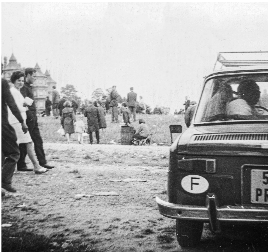
Ilustracja 11. Materiały operacyjne SB. Samochód z zagraniczną rejestracją, zaparkowany w pobliżu sanktuarium jasnogórskiego i grupa uczestników uroczystości. Sierpień 1968 r., Częstochowa.

z diecezji i z parafii. Dla zapewnienia większej frekwencji na dzień 3 V wyznaczono też pielgrzymkę wiernych z diecezji tarnowskiej do «uwięzionego Obrazu MBCz». Główne założenia tej uroczystości były następujące: nawiązanie do aktu oddania w dniu 3 V [19]66 r. narodu w niewolę maryjną, wyznanie wiary Episkopatu i narodu polskiego w jedności z Ojcem św. Eksponowano też modły w intencji przyjazdu Pawła VI na Jasną Górę. Założenia te znalazły wyraz w programie imprezy, w jej oprawie dekoracyjnej i w kazaniach 807 .