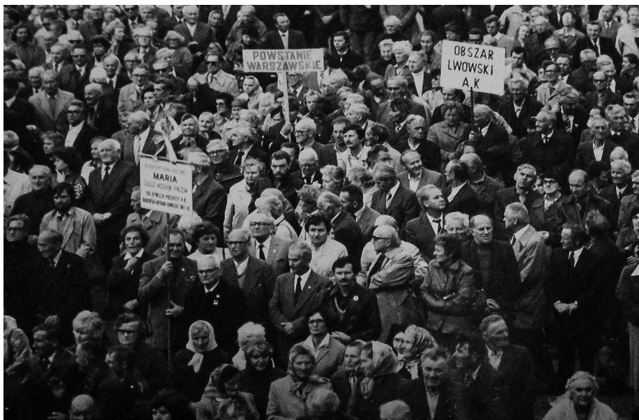
Ilustracja 47. XII Ogólnopolska Pielgrzymka Kombatantów Polski Walczącej na Jasną Górę. 9 IX 1984 r., Częstochowa (AJG, Kronika Konwentu i Sanktuarium Jasnogórskiego 1983–1986, sygn. 3458, s. 314).

w Częstochowie współpracując z Wydziałem IV, prowadził sprawę o kryptonimie „Wspaniali”. Przede wszystkim odnotowano fakt wywieszenia transparentu z napisem „Niepokonani choć internowani 13.12.1981 r.” i w tle „Solidarność”. O wynikach poinformowano władze polityczno-administracyjne województwa 220 .