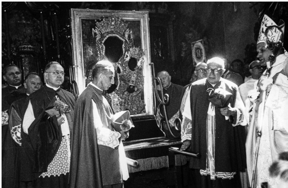
Ilustracja 6. Księża biskupi przed wzięciem obrazu. Widoczni m.in.: metropolita krakowski ks. arcybiskup Karol Wojtyła (pierwszy z prawej, z pastorałem w ręku), metropolita poznański ks. arcybiskup Antoni Baraniak (na pierwszym planie z lewej) i arcybiskup administrator apostolski archidiecezji wrocławskiej Bolesław Kominek (na pierwszym planie, drugi z prawej). 3 V 1966 r., Częstochowa.