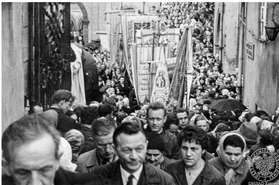
Ilustracja 28. Materiały operacyjne SB. Wierni uczestniczący w procesji. 2–4 V 1968 r., Częstochowa (AIPN Ka, 056/56, t. 1, s. 7).