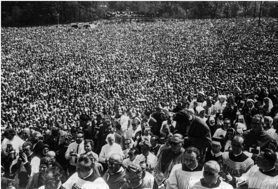
Ilustracja 5. Uczestnicy uroczystości milenijnych na placu przed klasztorem jasnogórskim. 3 V 1966 r. (NAC, Zbiór fotografii dotyczących obchodów kościelnych Tysiąclecia Chrztu Polski, 3/19/0/-/3).