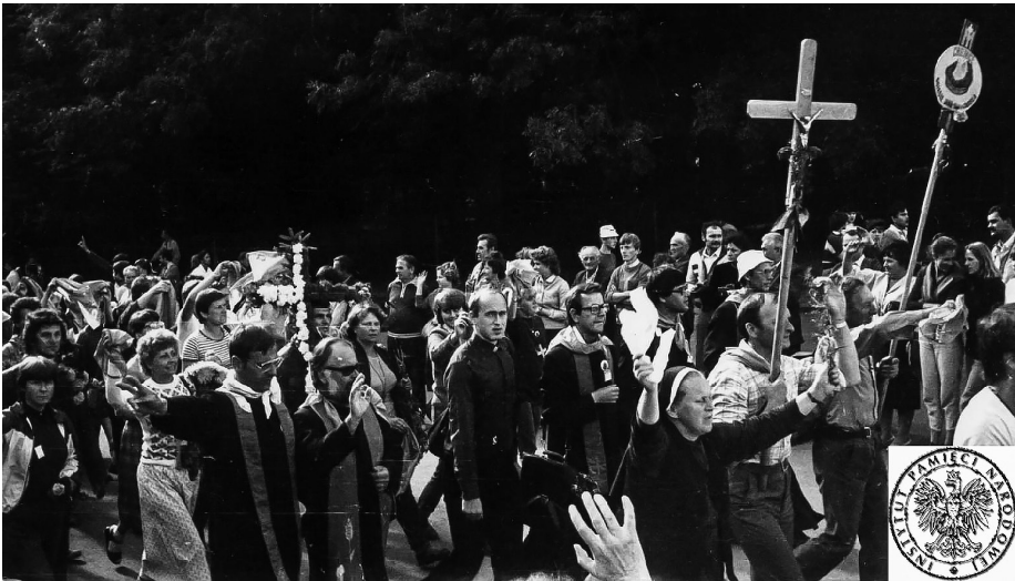
Ilustracja 50. II Pielgrzymka Ludzi Pracy (Robotnicza) na Jasną Górę, 30 IX 1984 r., Częstochowa.

Zainteresowanie dziennikarzy zagranicznych sprowadzało się do filmowania Lecha Wałęsy, który wychodził od oo. Paulinów oraz transparentów z napisami «Solidarność», jakie miały ze sobą grupy tzw. robotników. Wśród przybyłych na Jasną Górę rozpoznałem m.in. brata Lecha Wałęsy, [Jana] Rulewskiego i [Adama] Michnika. Prawie wszyscy noszą brody, tak, że nie byłem pewny w wielu przypadkach, czy rozpoznaję właściwych ludzi. Poza tym kilka osób sprzedawało znaczki