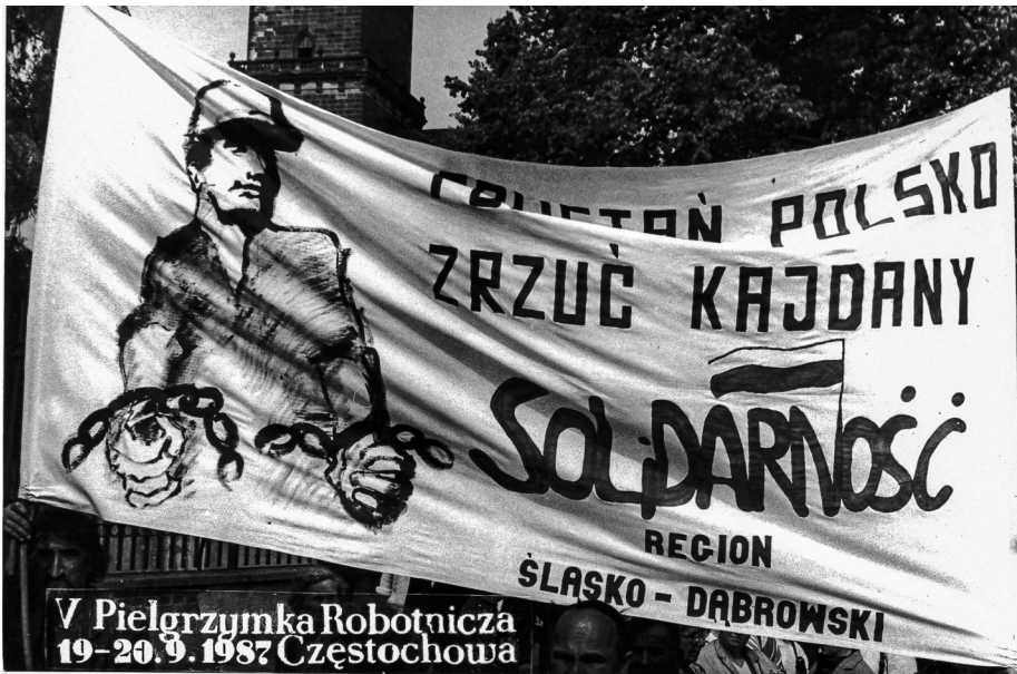
Ilustracja 66. Transparent. V Pielgrzymka Ludzi Pracy (Robotnicza) na Jasną Górę, 19–20 IX 1987 r., Częstochowa (AAN, Archiwum Zbigniewa Romaszewskiego, sygn. 336, k. 9).

Dyrektor Wydziału do spraw Wyznań w Częstochowie bardzo krytycznie ocenił pielgrzymki, twierdząc, że ich celem nie były doznania religijne, ale manifestacje polityczne krytykujące ustrój PRL, partię i rząd. Zalecał, aby w następnych latach, w poszczególnych województwach odmówić wydania zezwoleń, a przynajmniej wpłynąć na personalne zmiany w ich kierownictwie – szczególnie atakował pielgrzymkę wrocławską i krakowską 370 .