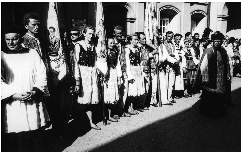
Ilustracja 8. Uczestnicy uroczystości milenijnych w strojach ludowych na dziedzińcu klasztoru jasnogórskiego. 3 V 1966 r., Częstochowa.