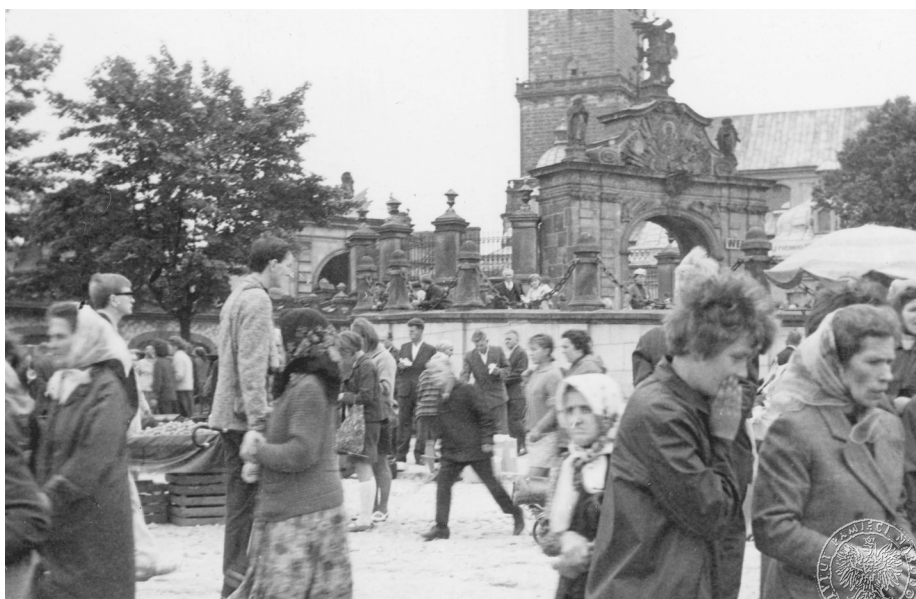
Ilustracja 17. Materiały operacyjne SB. Grupy uczestników uroczystości jasnogórskich. Sierpień 1968 r., Częstochowa.