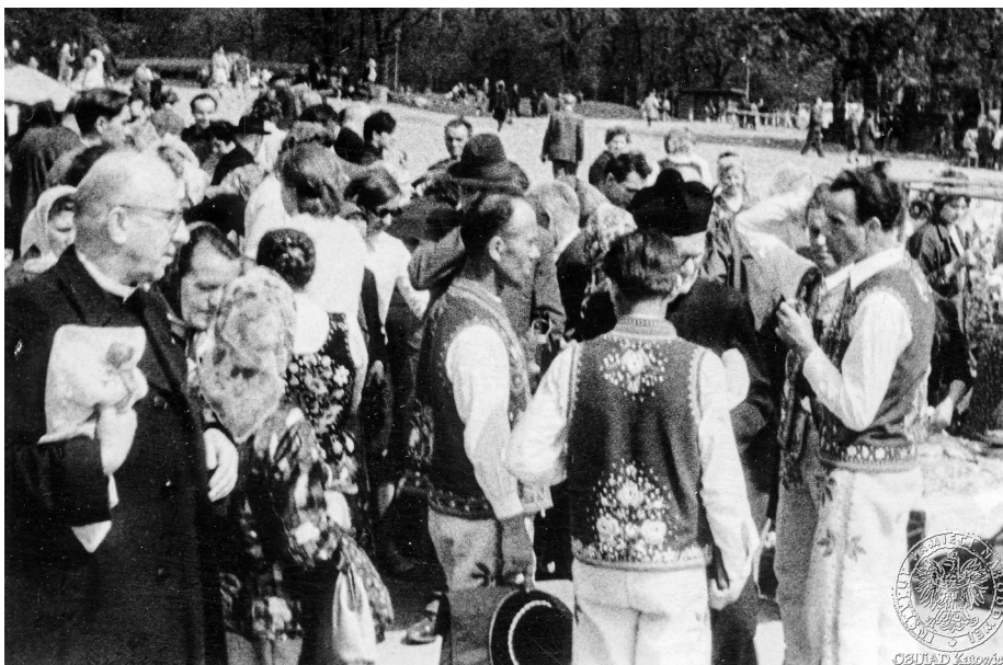
Ilustracja 25. Materiały operacyjne SB. Grupa uczestników uroczystości jasnogórskich w strojach ludowych podczas rozmowy z duchownym. 2–4 V 1969 r., Częstochowa (AIPN Ka, 056/56, t. 3, s. 20).