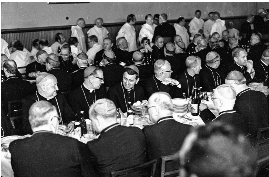
Ilustracja 39. Biskupi i ojcowie paulini zgromadzeni w jasnogórskim refektarzu w oczekiwaniu na posiłek. 5 VI 1979 r., Częstochowa (NAC, Archiwum fotograficzne Lecha Zielaskowskiego, 3/53/0/1/7).