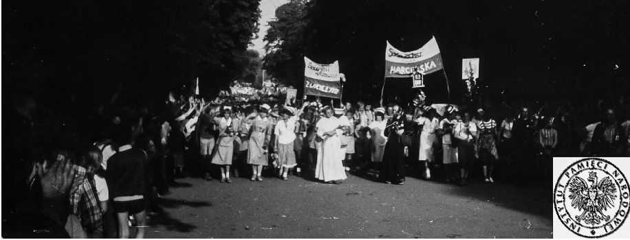
Ilustracja 49. II Pielgrzymka Ludzi Pracy (Robotnicza) na Jasną Górę, 30 IX 1984 r., Częstochowa (AIPN Bi, Kolekcja: Marian Chojnowski, 610/7, s. 64).

na parkingu samochód m-ki fiat 125p taxi z rejestracją KRL-9045, którym przybyła jakaś grupa dziennikarzy ze sprzętem filmowym, która nie miała napisu na kamerze, jedynie jakieś znaki – coś w rodzaju czerwonego krzyża i chyba litery N. Było tam 3 mężczyzn i 1 kobieta, z tym, że filmowało jedynie dwóch mężczyzn.