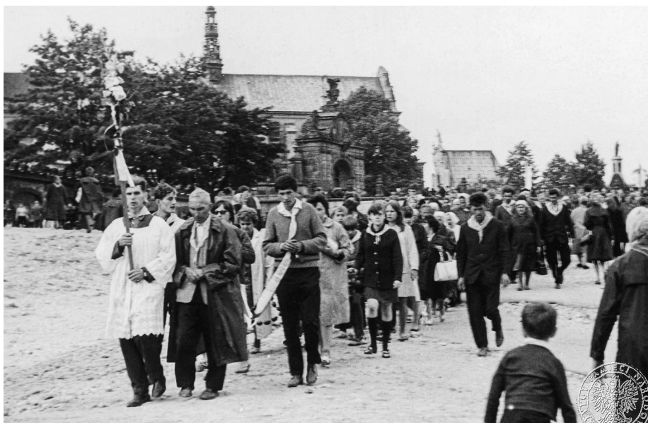
Ilustracja 16. Materiały operacyjne SB. Grupa pielgrzymów zmierzająca na uroczystości jasnogórskie. Sierpień 1968 r., Częstochowa (AIPN Ka, 056/56, t. 2, s. 18).