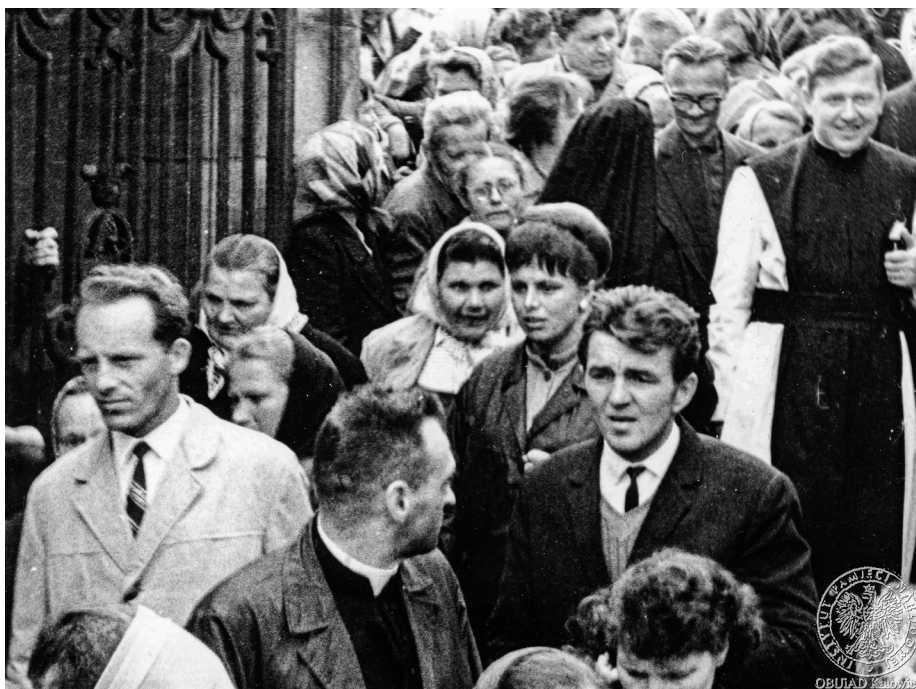
Ilustracja 36. Materiały operacyjne SB. Uczestnicy uroczystości jasnogórskich. 2–4 V 1968 r., Częstochowa (AIPN Ka, 056/56, t. 1, s. 43).

4 maja Konferencja Episkopatu Polski na Jasnej Górze wydała komunikat w sprawie trudności z jakimi boryka się Kościół. Opisano w nim sprawy ograniczania przez władze państwowe w zakresie budownictwa sakralnego, katechizacji, wolności wyznania wiary i korzystania z posługi sakramentalnej, działalności religijno-wychowawczej, wolności opinii i publikacji, a także udziału katolików w życiu publicznym i kulturalnym kraju 808 .