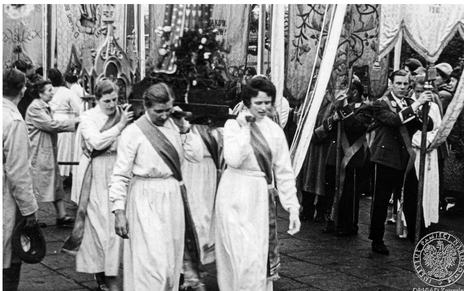
Ilustracja 34. Materiały operacyjne SB. Uczestnicy procesji. 2–4 V 1968 r., Częstochowa (AIPN Ka, 056/56, t. 1, s. 34).