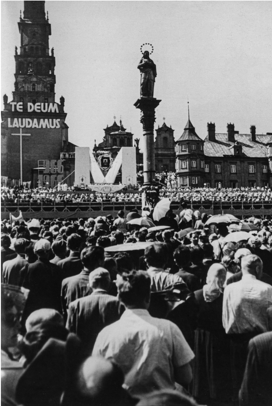
Ilustracja 2. Jasna Góra w czasie uroczystości milenijnych. 3 V 1966 r., Częstochowa.