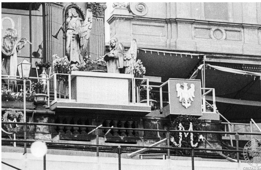
Ilustracja 18. Materiały operacyjne SB. Fragment dekoracji – herb Polski, przedstawiający orła z koroną. Sierpień 1968 r., Częstochowa (AIPN Ka, 056/56, t. 2, s. 45).