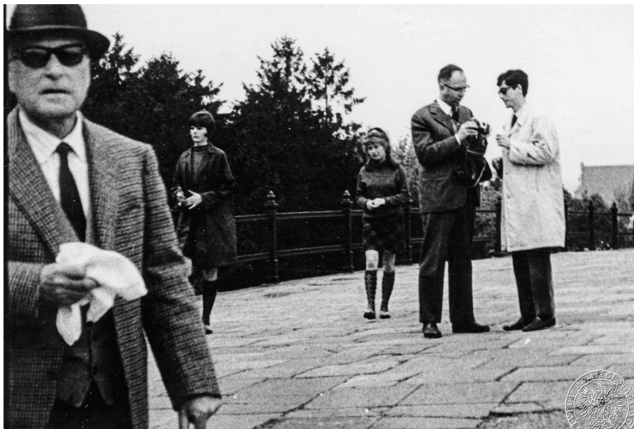
Ilustracja 23. Materiały operacyjne SB. Być może zdjęcie przedstawia wywiadców podczas pracy. 2–4 V 1968 r., Częstochowa (AIPN Ka, 056/56, t. 1, s. 41).