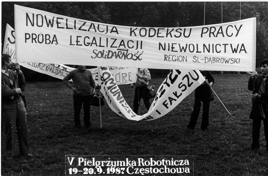
Ilustracja 58. V Pielgrzymka Ludzi Pracy (Robotnicza) na Jasną Górę, Uczestnicy prezentują transparenty. 19–20 IX 1987 r., Częstochowa (AAN, Archiwum Zbigniewa Romaszewskiego, sygn. 334, k. 1).