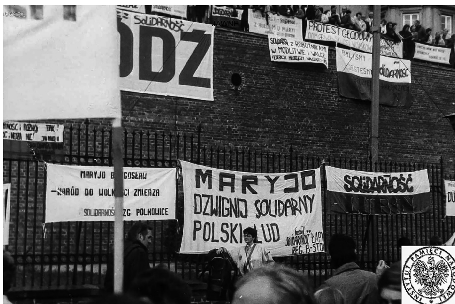
Ilustracja 56. V Pielgrzymka Ludzi Pracy (Robotnicza) na Jasną Górę. 19–20 IX 1987 r., Częstochowa.