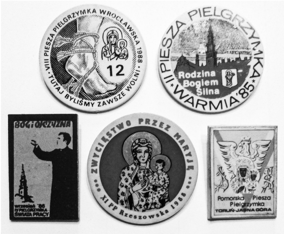
Ilustracja 67. Emblematy pielgrzymkowe z lat osiemdziesiątych (Zbiory prywatne autora).