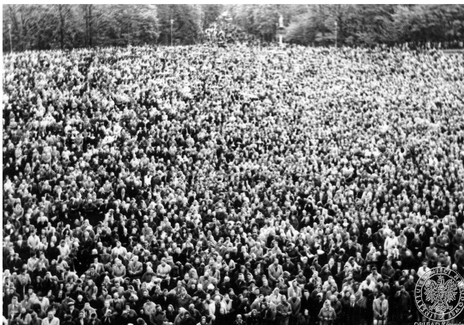
Ilustracja 29. Materiały operacyjne SB. Zgromadzeni przed szczytem jasnogórskim uczestnicy uroczystości. 2–4 V 1968 r., Częstochowa.