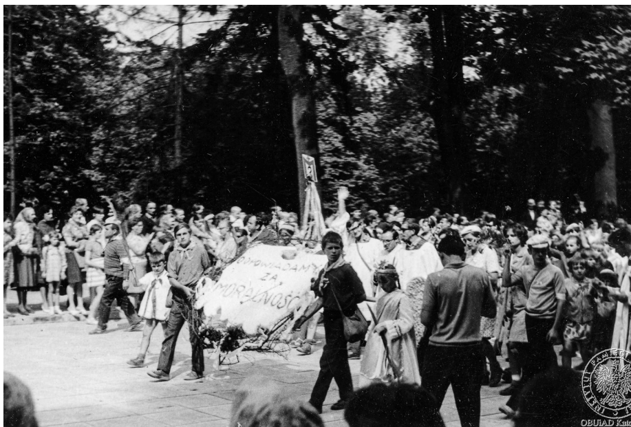
Ilustracja 19. Materiały operacyjne SB. Młodzi pielgrzymi niosą na Jasną Górę makietę, przedstawiającą kontur państwa polskiego w koronie cierniowej i z napisem „Odpowiadamy za moralność”. Sierpień 1968 r., Częstochowa (AIPN Ka, 056/56, t. 2, s. 46).