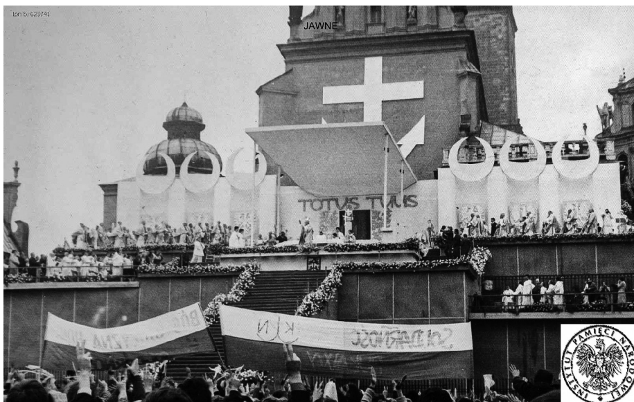
Ilustracja 43. Jasna Góra podczas II pielgrzymki Jana Pawła II do Polski. 19 lub 20 VI 1983 r., Częstochowa.

niej wyrażał niepokój próbami przeciwstawienia Kościoła – państwu i czynieniu z Kościoła siły reprezentującej społeczeństwo „wobec jego własnej ludowej władzy”. Angażowanie się chrześcijan w działalność na rzecz socjalistycznego państwa uważał za jak najbardziej pożądane, a marksiści przyjmowali to „z coraz bardziej otwartą postawą i przychylnym zainteresowaniem” 160 . Taka zmiana retoryki pokazuje ewolucję poglądów polskich teoretyków socjalizmu, na co niewątpliwie wpływ miały wydarzenia z początku lat osiemdziesiątych i umocnienie pozycji Kościoła po pielgrzymkach papieskich.