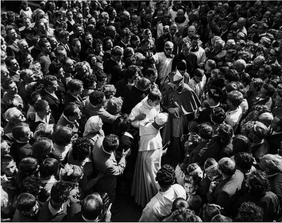
Ilustracja 10. Pielgrzymka mężczyzn. Kardynał Stefan Wyszyński w drodze na szczyt jasnogórski na główne uroczystości. 28 VIII 1966 r., Częstochowa.

12 października w kościele Matki Bożej Częstochowskiej w Warszawie prymas Wyszyński wygłosił homilię, w której powiedział m.in.: