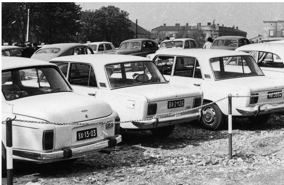
Ilustracja 13. Materiały operacyjne SB. Samochody zaparkowane w pobliżu sanktuarium jasnogórskiego. Zdjęcia robione w ten sposób, żeby były widoczne numery rejestracyjne pojazdów. 2–4 V 1969 r., Częstochowa.