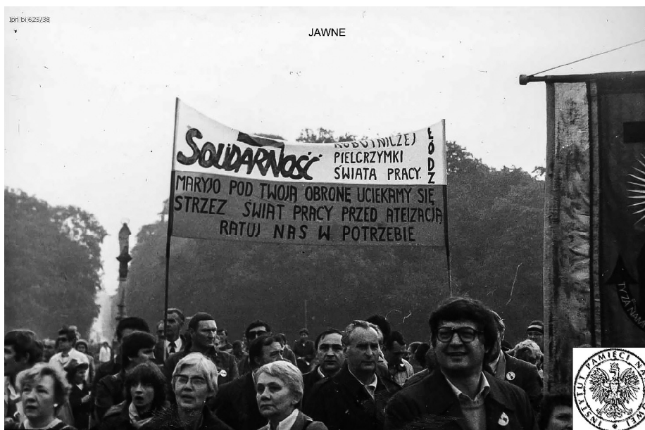
Ilustracja 57. V Pielgrzymka Ludzi Pracy (Robotnicza) na Jasną Górę. 19–20 IX 1987 r., Częstochowa.