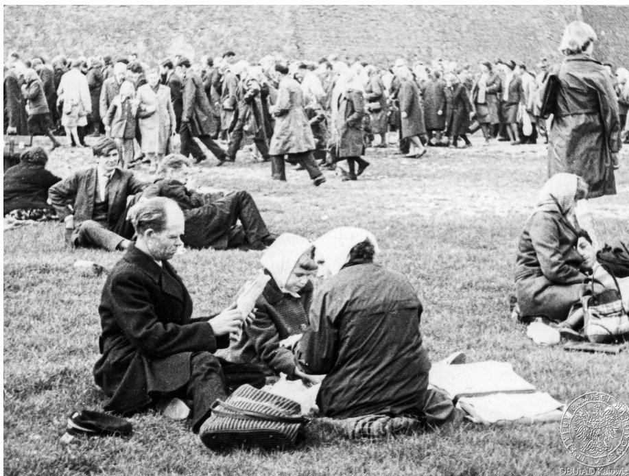
Ilustracja 35. Materiały operacyjne SB. Przybyli na Jasną Górę uczestnicy uroczystości podczas odpoczynku. 2–4 V 1968 r., Częstochowa (AIPN Ka, 056/56, t. 1, s. 37).