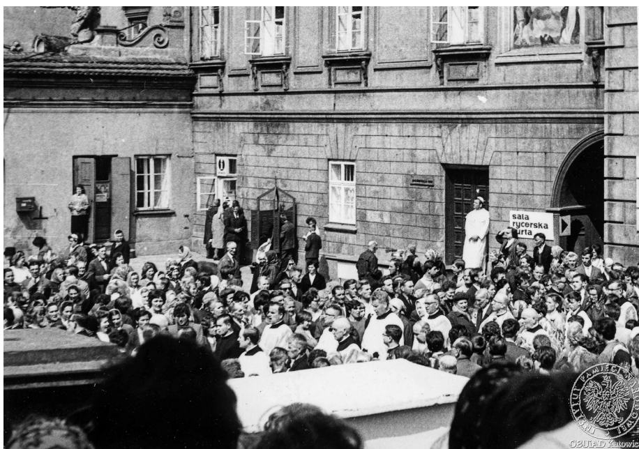
Ilustracja 21. Materiały operacyjne SB. Uczestnicy uroczystości jasnogórskich na dziedzińcu klasztornym. 2–4 V 1969 r., Częstochowa (AIPN Ka, 056/56, t. 3, s. 13).