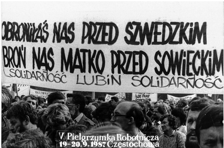
Ilustracja 63. V Pielgrzymka Ludzi Pracy (Robotnicza) na Jasną Górę, Uczestnicy z transparentem. 19–20 IX 1987 r., Częstochowa.