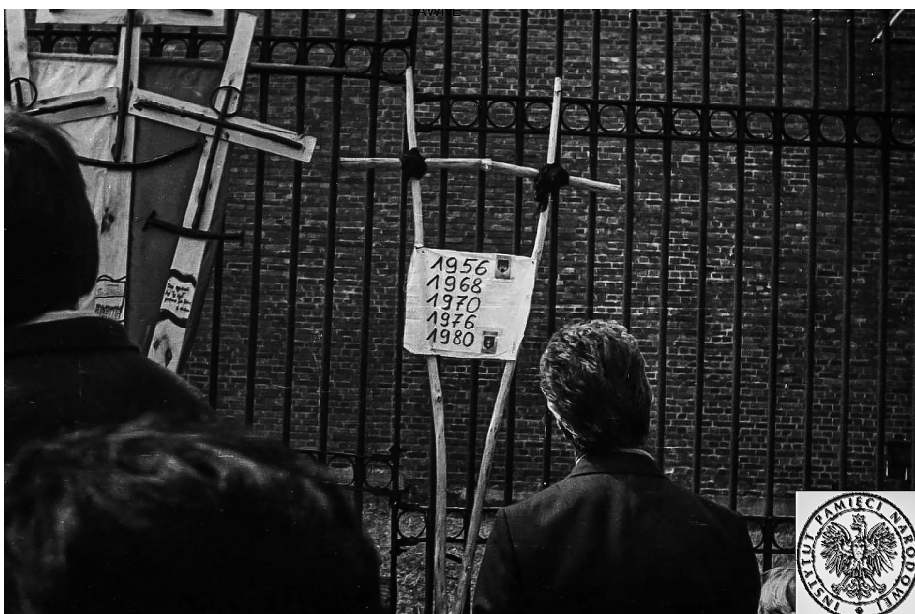
Ilustracja 52. II Pielgrzymka Ludzi Pracy (Robotnicza) na Jasną Górę, 30 IX 1984 r., Częstochowa.