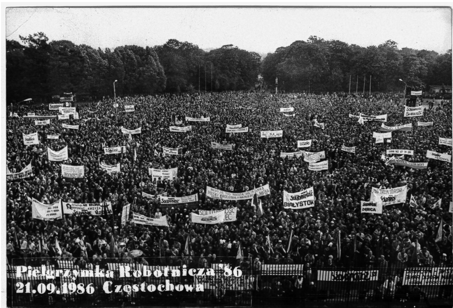
Ilustracja 53. Uczestnicy IV Pielgrzymki Ludzi Pracy (Robotniczej) na Jasną Górę, 21 IX 1986 r., Częstochowa (AAN, Archiwum Zbigniewa Romaszewskiego, sygn. 333, k. 1).

Na początku września w „Tygodniku Powszechnym” opublikowano przemówienie papieża Jana Pawła II wygłoszone w Castel Gandolfo do Polaków w dniu 26 sierpnia: