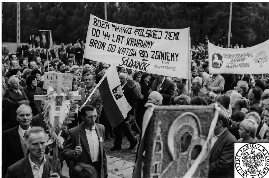
Ilustracja 70. Delegacja działaczy „Solidarności” z ziemi białostockiej na dożynkach, 1988, Częstochowa.