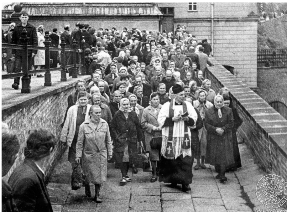
Ilustracja 33. Materiały operacyjne SB. Prawdopodobnie droga krzyżowa po wałach jasnogórskich. 2–4 V 1968 r., Częstochowa (AIPN Ka, 056/56, t. 1, s. 33).