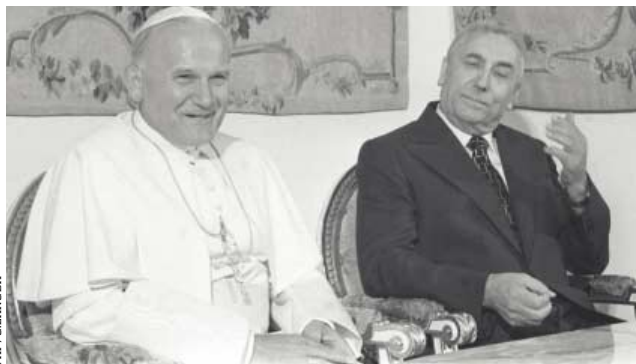
♦ Papież Jan Paweł II i I sekretarz KC PZPR Edward Gierek podczas spotkania w Belwederze

Papieski samolot wylądował na Okęciu w sobotę o godzinie 10.07 – we wszystkich kościołach w Polsce odezwały się wtedy dzwony. Ojciec Święty ucałował polską ziemię. Na płycie lotniska oficjalnie witali go przewodniczący Rady Państwa Henryk Jabłoński oraz prymas kardynał Stefan Wyszyński i biskupi. Papież uścił ich i rzucił: – Uszanowanie Wam. Muszę już iść, bo pchają mnie dalej. Papamobil