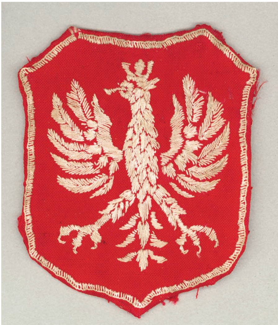
Naszywka z orłem noszona na rękawach mundurów przez żołnierzy Brygady Świętokrzyskiej

przez kilka dni pełnił funkcję ordynansa „Bohuna”, a następnie zbiegł.