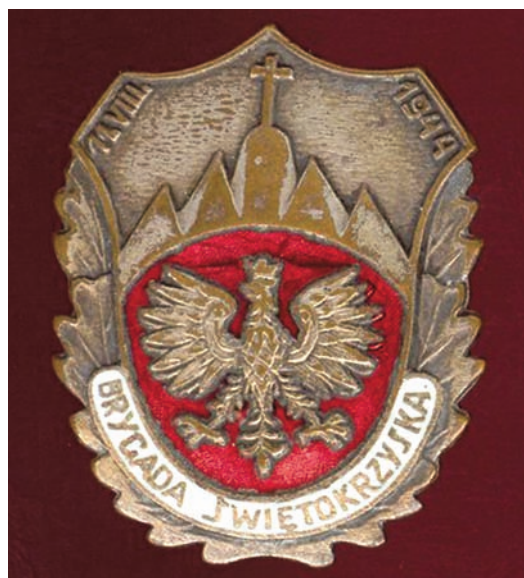
Odnaka Brygady Świętokrzyskiej

Była jedną z największych formacji partyzanckich działających na ziemiach polskich. Jej żołnierze walczyli równocześnie z okupantem niemieckim i z podziemiem komunistycznym, stanowiącym awangardę nowej, sowieckiej okupacji. Dzięki szczęśliwemu zbiegowi okoliczności i umiejętnej dyplomacji dowódców, cała jednostka udało się przedostać na Zachód, unikając rozbicia i ze strony Wehrmachtu czy Waffen SS, i Armii Czerwonej. Była także jedynym oddziałem polskiego podziemia niepodległościowego, który nawiązał kontakt taktyczny z wojskami zachodnich aliantów, wszedł w ich skład i współdziałał taktycznie w walce z Niemcami w ostatnich dniach II wojny światowej. Warto przypomnieć historię Brygady Świętokrzyskiej Narodowych Sił Zbrojnych, tym bardziej że 11 sierpnia mija 64. rocznica jej powstania.