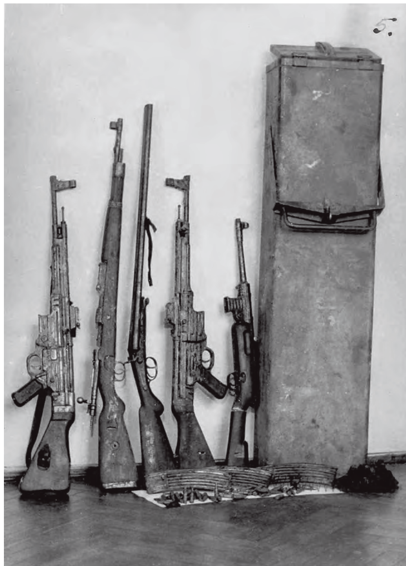
Broń KWP „Murata” przejęta przez UB podczas likwidacji bunkra

Działalność resztek podziemia KWP w środkowej Polsce była szczególnie utrudniona przez duże nasycenie wojska wewnętrznego WBW i grup pościgowych UB i MO. Mniejsze kompleksy leśne i niesprzyjające warunki terenowe zmuszały poszczególnych dowódców partyzanc-