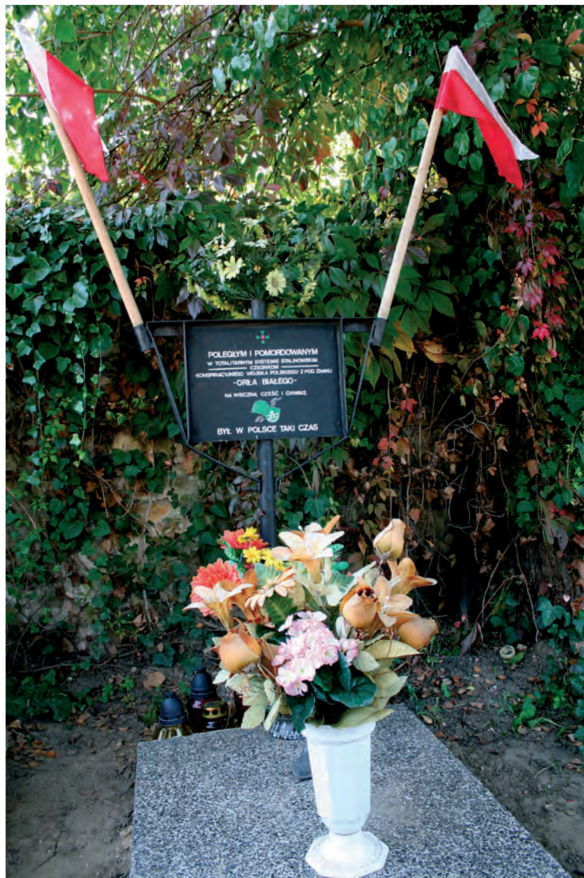
Mogiła partyzantów KWP Wieluń – cmentarz

Mogiły żołnierzy KWP „Murata” pozostają do dziś nieznanne. Symboliczne epitafia znajdują się m.in. na cmen-