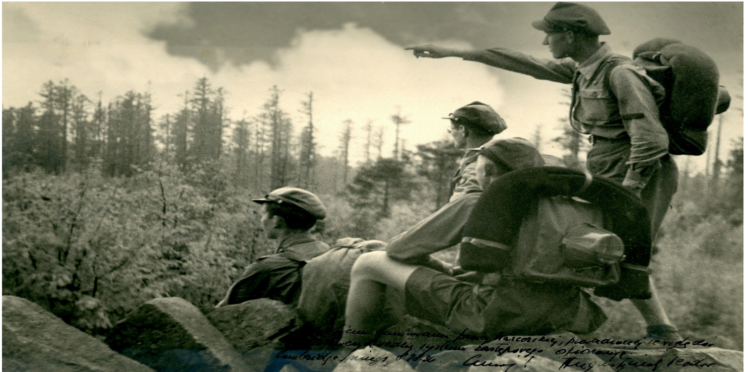
Polscy harcerze w Stanach Zjednoczonych podczas jednego z obozów, 1936 r.

https://przystanekhistoria.pl/pa2/teksty/106290,Harcerstwo-w-ramach-Sokolstwa-Polskiego-w-Ameryce.html