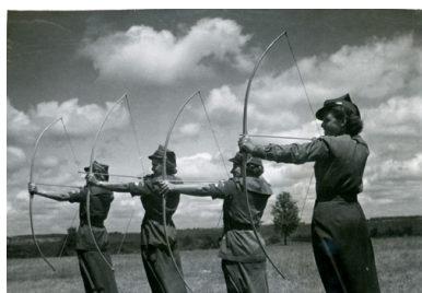
Harcerki Związku Narodowego Polskiego podczas obozowych zajęć łuczniczych, lata 30. XX wieku