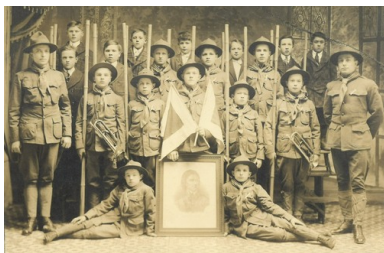
Drużyna harcerska Związku Sokołów Polskich w Ameryce z portretem Tadeusza Kościuszki, 1917 r.