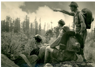
Polscy harcerze w Stanach Zjednoczonych podczas jednego z obozów, 1936 r.