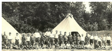
Obóz harcerski Sokolstwa Polskiego w Ameryce. Detroit, 1928 r.