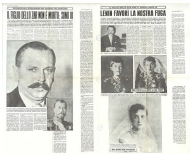
Publikacje prasowe dotyczące Michała Goleniewskiego jako rzekomego syna cara Mikołaja II Romanowa