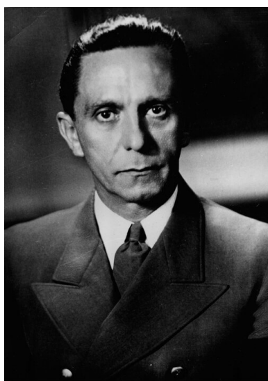
Joseph Goebbels, minister propagandy III Rzeszy. Fotografia portretowa wykonana z okazji 46. rocznicy urodzin. Listopad 1943. Ze zbiorów Narodowego Archiwum Cyfrowego

22 maja 1945 r. Brytyjczycy dokonali zatrzymania niemieckiego policjanta, legitymującego się dokumentem wystawionym na nazwisko Heinrich Hitzinger. Miał on być członkiem tajnej żandarmerii polowej, w rzeczywistości okazało się, że w ręce aliantów dostał się jeden z czołowych przywódców rządu Rzeszy – Heinrich Himmler. Razem z pozostałymi ujętymi nazistami, miał on stanąć przed obliczem formującego się międzynarodowego trybunału, jednak dzień po zatrzymaniu, w trakcie przesłuchania popełnił samobójstwo. Zgodnie z podaną do wiadomości publicznej wersją wydarzeń, miało to nastąpić poprzez połknięcie cyjanku potasu schowanego uprzednio w ustach. Wyniki sekcji zwłok Himmlera zostały utajnione na okres 100 lat, zatem dopiero rok 2045 przyniesie ze sobą ostateczną odpowiedź na pytanie o szczegóły jego śmierci.