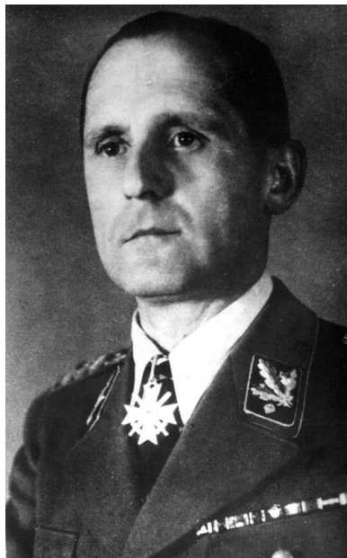
Heinrich Müller, szef Das Geheimes Staatspolizeiamt (Gestapo), tajnej państwowej policji politycznej. Lata 1941 - 1945.

życie. Przed śmiercią, zgodnie z testamentem pozostawionym przez Adolfa Hitlera, przez kilkanaście godzin formalnie pełnił funkcję kanclerza Rzeszy.