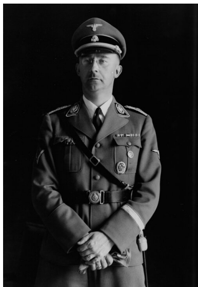
Heinrich Himmler, szef policji i SS w III Rzeszy. Fotografia portretowa wykonana z okazji 40. rocznicy urodzin. Październik 1940.

globalnego konfliktu, w wyniku którego zginęły miliony ofiar. Niestety, nazistowski wódz nie dożył nawet zakończenia rozpętanej przez siebie wojny. 30 kwietnia 1945 r., w wieku 56 lat, dzień po poślubieniu swojej wieloletniej partnerki Ewy Braun, popełnił wraz z nią samobójstwo. Miało to miejsce w bunkrze znajdującym się pod gmachem Starej Kancelarii Rzeszy w Berlinie, skąd do końca swoich dni kierował działaniami zbrojnymi upadającego państwa.