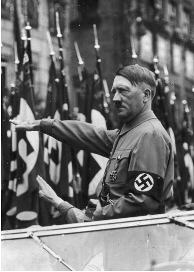
Kanclerz Rzeszy Adolf Hitler odbierający defiladę. Maj 1937.

W skład Trybunału Norymberskiego wchodził przedstawiciel czterech zwycięskich mocarstw - USA, Wielkiej Brytanii, Francji i ZSRS. Każde z państw delegowało po dwóch reprezentantów swojego kraju do składu sędziowskiego oraz po jednym do Komitetu Oskarżycielskiego, do którego należeli prokuratorzy.