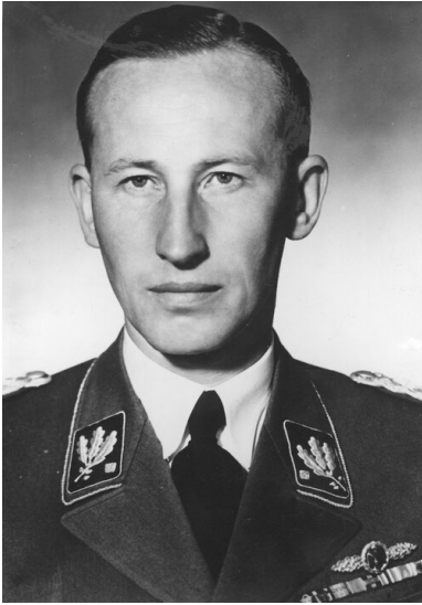
Reinhard Heydrich, generał SS i szef Głównego Urzędu Bezpieczeństwa Rzeszy. 1942.