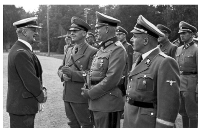
Od lewej: admirała Miklos Horthy, minister spraw zagranicznych Rzeszy Joachim von Ribbentrop, marszałek Wilhelm Keitel, Reichsleiter Martin Bormann.

Wartym odnotowania jest, że pozostali uwięzieni naziści wyrazili ulgę z powodu śmierci byłego współpracownika. Twierdzili bowiem, że Ley mógłby w trakcie procesu skompromitować nie tylko siebie, ale i całą strukturę niemieckiego reżimu.