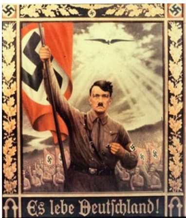
Niemiecki nazistowski obraz propagandowy

Jesteś reprezentantem partii i według tego postępuj. Być narodowym socjalistą to znaczy dawać przykład!