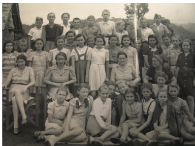
Klasa szósta szkoły powszechnej w Tengeru, lata czterdzieste XX w.