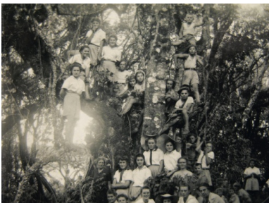
W dżungli, okolice Tengeru, lata czterdzieste XX w.

W Tengeru młodzież licealna przystępowała do matury, ogółem ponad 110 osób uzyskało tam świadectwo dojrzałości, a jedną z nich była wspomniana wyżej chórzystka.