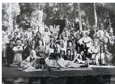
Przedstawienie teatralne polskiego sierocińca w Tengeru, lata czterdzieste XX w.

Do Tengeru przybywały kolejne transporty. W grudniu 1942 r. liczba ludności wynosiła ok. 3 tys., a w kolejnych latach wzrosła do 4 tys. Komendantem osiedla był Anglik, któremu podlegał polski kierownik. W środku dżungli wyrosło polskie miasteczko. Z budynkami szkolnymi i zakładami pracy (rzeźnią, garbarnią, piekarnią, wędliniarnią, tkalnią, szwalnią, cegielnią, warsztatami szewsko-rymarskimi), szpitalem, farmą, magazynami (np. na odzież lub żywność), sklepikiem, spółdzielnią, pocztą, budynkiem kina i teatru, świetlicami (YMCA, Referatu Kulturalno-Oświatowego, Związku Harcerstwa Polskiego, Akcji Katolickiej), sierocińcem, domem starców, kościołem, synagogą, cerkwią. Niedaleko osiedla założono cmentarze – chrześcijański i żydowski.