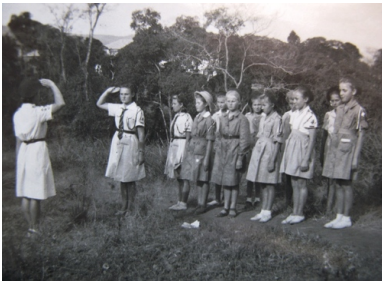
Zbiórka harcerska, 1945 r. (fot. ze zbiorów Janiny Cwetsch)

Młodszy bawili się w chowanego, ciuciubabkę, berka i grali w dwa ognie, starsi w piłkę nożną i siatkówkę. Z czasem powstał w Tengeru Międzyszkolny Klub Sportowy. W połowie października 1942 r. przeprowadzono spis ludności osiedla, na podstawie którego ustalono listy dzieci w wieku przedszkolnym i szkolnym.