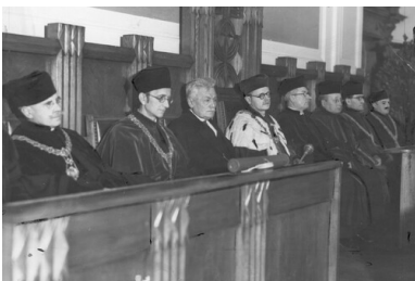
Uroczystość nadania tytułu

Wydarzenia z 6 listopada były bezprecedensowe. Nieprzypadkowo zbiegły się z przygotowaniem do otwarcia roku akademickiego w Uniwersytecie Jagiellońskim, a kierując się troską o losy akademii, na wyznaczone spotkanie tłumnie przybyli nie tylko czynni pracownicy nauki, ale i emerytowani profesorowie. Pobyt w obozie był dla nich niezwykle wyniszczający. Pomimo, że „grupa krakowska” nie była zmuszana do pracy, jednak jako tzw. Stehkommando w trakcie dnia nie mogli siedzieć. Rujnujące zdrowie były apele. Przyczyniła się do tego bardzo mroźna zima, lekkie obozowe ubranie, głód, brak możliwości leczenia.