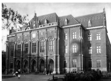
Collegium Novum Uniwersytetu Jagiellońskiego, 1927 r.

Zebranie okazało się pułapką – po kilkuminutowym wystąpieniu Müllera, w którym poinformował, że uniwersytet był zawsze „ogniskiem antyniemieckich nastrojów”, zgromadzeni profesorowie zostali aresztowani. Łącznie zatrzymane zostały 183 osoby – głównie uczeni związani z Uniwersytetem Jagiellońskim, a także z Akademią Górniczą i Akademią Handlową oraz kilka innych osób, które znalazły się wówczas w budynku lub jego okolicach. Aresztowanych przewieziono do więzienia policyjnego przy ul. Montelupich, a następnie do koszar przy ul. Mazowieckiej, by po kilku dniach przetransportować ich w liczbie 172 do Wrocławia (w międzyczasie zwolniono kilka osób). Stamtąd trafili do obozu koncentracyjnego Sachsenhausen zlokalizowanego na ówczesnych obrzeżach Oranienburga.