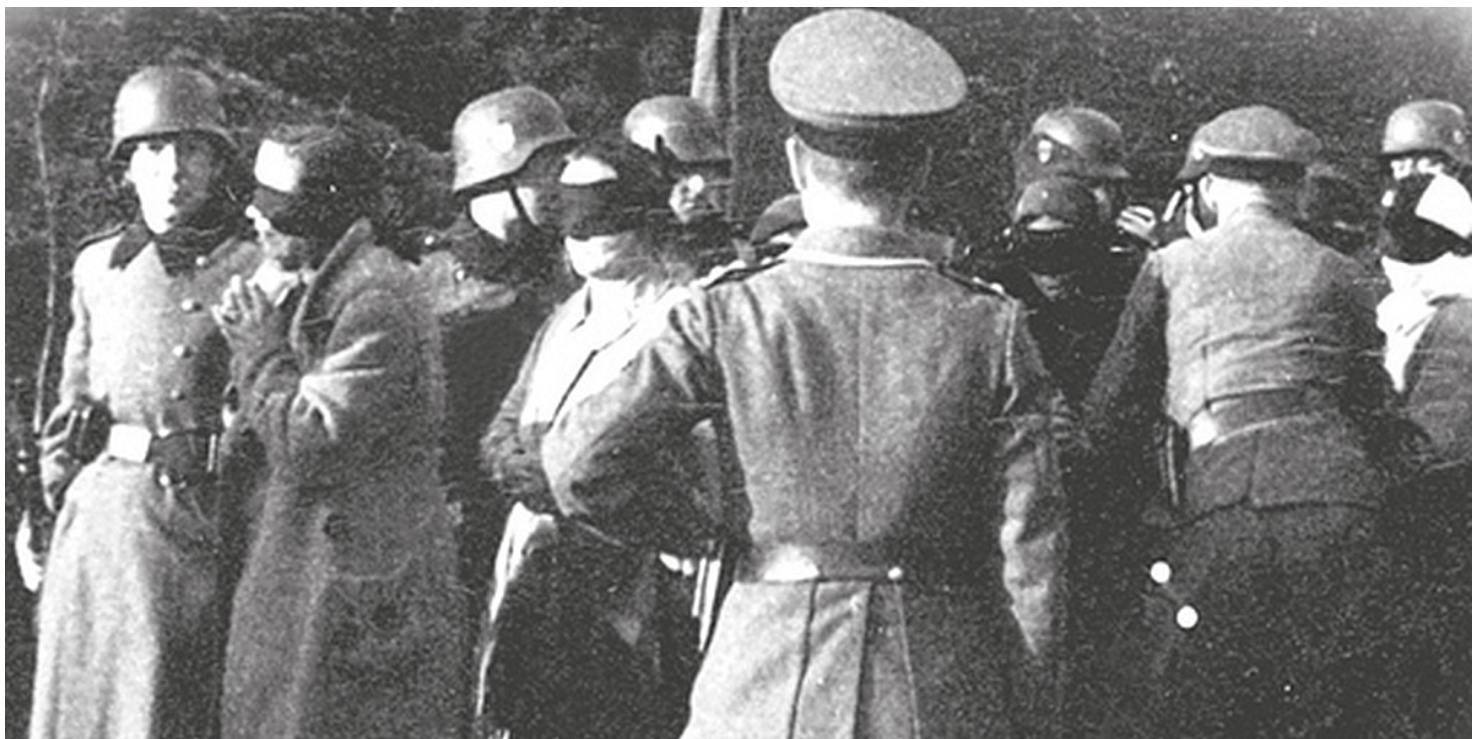
Egzekucja w Palmirach

https://przystanekhistoria.pl/pa2/tematy/akcja-ab/82838,Palmiry-symbol-niemieckiego-okrucienstwa.html