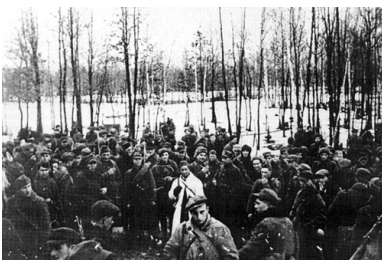
Jeden z oddziałów 27. WDP AK na koncentracji

W tej sytuacji, po uzgodnieniach pomiędzy krajem a Londynem, zapadła decyzja, by w momencie zbliżania się sił rosyjskich podejmować na tyłach wojsk niemieckich wzmożone działania dywersyjne, Armię Czerwoną traktować zaś jako sojusznika. Oznaczało to występowanie w roli gospodarza oswabadzanych terenów (władze podziemne byłyby w tym przypadku jawnymi organami rządu RP), przy czym, w przypadku ewentualnych represji, nastąpiłby powrót do form konspiracyjnych. Nie było też mowy o podejmowaniu jakichkolwiek form współdziałania z armią dowodzoną przez Berlinga, do której władze sowieckie zarządziły wiosną 1944 r. przymusowy pobór na Wołyniu i Podolu.