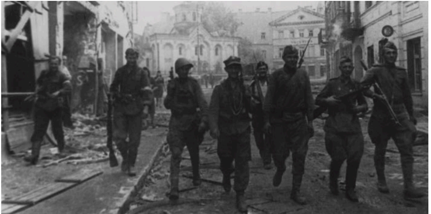
Operacja „Ostra Brama”. Polsko-sowiecki patrol na ulicy Wielkiej w Wilnie, lipiec 1944 r. (ze zbiorów CAW)

https://przystanekhistoria.pl/pa2/tematy/akcja-burza/102499,Burza.html