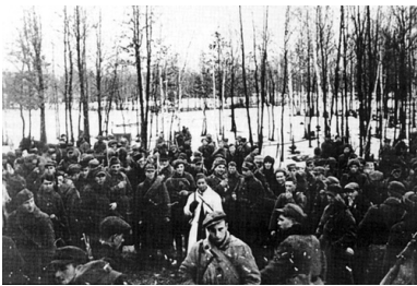
Jeden z oddziałów 27. WDP AK na koncentracji