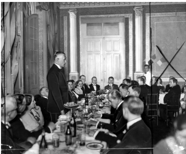
Wizyta marszałka Senatu Władysława Raczkiewicza w Brazylii, 28 czerwca 1933 r.

W tym miejscu nie sposób nie wspomnieć, iż dodatkowy wpływ na wychowanie polskiej młodzieży miały organizacje sportowe, jak Towarzystwo Gimnastyczne „Sokół” czy Towarzystwo Gimnastyczne „Strzelec”. Głównymi ich celami było rozbudzanie uczuć patriotycznych i propagowanie rozwoju tężyzny fizycznej wśród młodego pokolenia Polaków. Największą tego typu organizacją polonijną było Towarzystwo Wychowania Fizycznego „Junak”, które powstało 6 lutego 1923 r. Honorowym prezesem związku wybrany został Józef Piłsudski. Władze „Junaka”, odpowiedzialne były za wielopłaszczyznowy rozwój członków, organizowały zajęcia sportowe, zajmowały się działaniami o podłożu kulturalno-patriotycznym. Do końca 1932 r., w ramach związku działało 8 okręgów, 47 oddziałów, które skupiały 1800 członków (w tym 1400 czynnych). 15