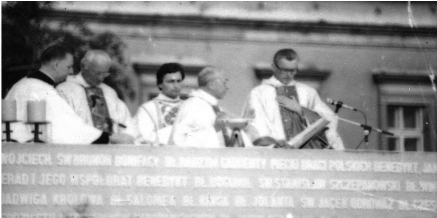
Uroczystości pogrzebowe, msze i modlitwy w intencji zmarłego prymasa polski ks. kard. Stefana Wyszyńskiego. Po środku kardynał Agostino Casaroli, pierwszy z prawej arcybiskup Franciszek Macharski, 31 maja 1981 r.

https://przystanekhistoria.pl/pa2/tematy/aparat-bezpieczenstwa/43072,Kardynal-Franciszek-Macharski-1927-2016.html