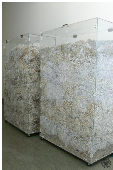
Gabloty ze zniszczonymi aktami służb terroru i represji PRL.

Niszczenie akt nie ominęło także materiałów archiwalnych wojskowych organów bezpieczeństwa komunistycznego państwa.