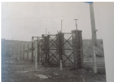
Brama wewnętrzna obozu w Jaworznie bezpośrednio po likwidacji obozu w 1956 r.