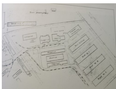
Plan Wiezienia Progresywnego dla Młodocianych Więźniów Politycznych z 1953 r.