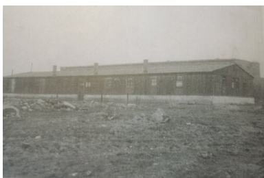
Barak warsztatów obozowych. Okres po likwidacji obozu w 1956 r.