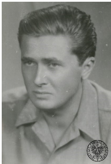
Marek Hłasko.

Tak być może podchodził do kolejnych wezwań, które przychodziły, choć Hłasko zmieniał w tym czasie pracę. W sumie między styczniem a kwietniem 1953 r. odbyło się 12 spotkań (na 17 planowanych), z czego 10 uznano za wartościowe. Dokumenty nie wskazują, czy zeznania pisarza pomogły w jakikolwiek sposób w złapaniu konwojentów-oszustów. W każdym razie współpraca nie trwała długo – dość szybko okazało się, że Hłasko przestał być przydatny milicjantom, w dodatku stwierdzono, że raczej nie przyda się w innych śledztwach: jak pisano, „zwolnił się z pracy, aby ukończyć książkę”. Machnięto więc ręką. Ostateczna decyzja o „eliminacji z sieci” zapadła dopiero w listopadzie 1953 r. – milicyjna biurokracja działała wolno.