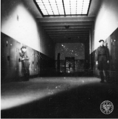
Korytarz więzienia karno-śledczego Warszawa-Mokotów.

Początki więzienia na Mokotowie sięgają czasów zaboru rosyjskiego. Projekt przewidywał stworzenie całego kompleksu penitencjarnego. Budowa rozpoczęła się we wrześniu 1902 r., a obiekt oddany do użytku dwa lata później był, jak na tamte czasy, bardzo nowoczesny – skanalizowany i z ubikacjami w celach. Do 1904 r. wzniesiono gmach główny na planie krzyża, szpital oraz dom mieszkalny dla administracji i pracowników więzienia.