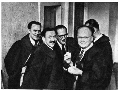
Stanisław Hejmowski podczas procesów poznańskich.