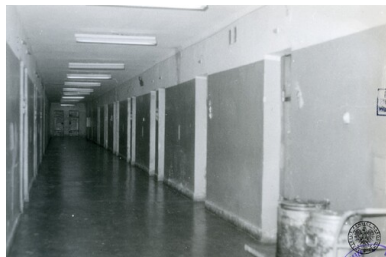
Ośrodek Odosobnienia dla Internowanych w Rzeszowie - Załężu; widok jednego z korytarzy i cel przy nim.

nie chodzili. Kolejne tygodnie odosobnienia powodowały, że wzrastała ich pewność siebie, z czasem większość internowanych zaczęła odmawiać w nich udziału. Funkcjonariusze SB w sprawozdaniach stwierdzali radykalizację postaw, raportowali, że internowani wykluczali nie tylko możliwość podjęcia współpracy, ale także ewentualność podpisywania oświadczeń o lojalności.