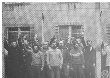
Akcja protestacyjna osób internowanych w Ośrodku Odosobnienia w Uhercach, 19 kwietnia 1982 r. Internowani stoją przy siatce ogrodzeniowej podczas akcji protestacyjnej; prawdopodobnie śpiewają. Część osób podnosi ręce, pokazując znak „V”, czyli znak zwycięstwa (victory). Na drugim planie