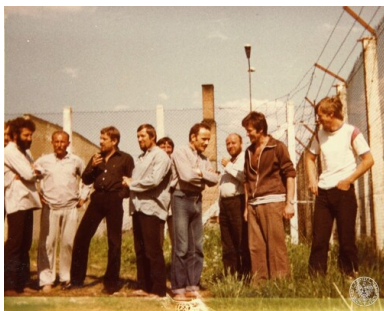
Zakład internowania w Nowym Łupkowie, lato 1982.

Na rozmowy z internowanymi przyjeżdżali także funkcjonariusze Wydziałów III KW MO właściwych dla miejsc ich zamieszkania przed internowaniem bądź przedstawiciele Departamentu III MSW, jeśli ośrodek był pod szczególnym nadzorem Ministerstwa Spraw Wewnętrznych, jak w przypadku Jaworza czy Głębokiego. Przypadki nieobecności funkcjonariuszy SB, najwyżej dwudniowej, zdarzały się wyłącznie sporadycznie i związane były z potrzebą przedstawienia rezultatów pracy w macierzystych KW MO. Faktyczną władzę w ośrodkach odosobnienia sprawowali zatem nie komendanci tych ośrodków, a Służba Bezpieczeństwa.