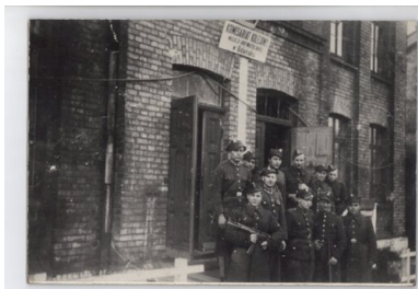
Komisariat Kolejowy MO w Gdańsku

Milicjanci pełnili również służbę na dworcach PKP, gdzie dbali o „ochronę pasażerów i ich mienia na terenie wszystkich pomieszczeń stacyjnych, tj. w budynkach i na peronach”. 20 sierpnia niejaki Kaatz zorganizował Komisariat Kolejowy MO w Gdańsku. We wrześniu utworzono posterunki kolejowe w Gdańsku-Wrzeszczu oraz na gdańskim dworcu głównym. Pomoc milicjantów ułatwiła służbę Straży Ochrony Kolei.