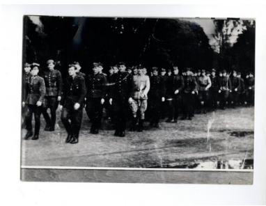
Wspólny marsz funkcjonariuszy MO i UB, Gdańsk 1945, ze zbiorów AIPN Gdańsk