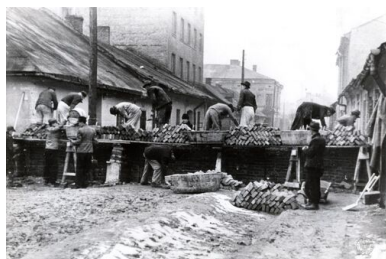
Budowa muru niemieckiego getta dla Żydów w Krakowie-Podgórzu.

W 1947 r. wydał, wielokrotnie wznawiane, wspomnienia z lat okupacji niemieckiej, zatytułowane Apteka w getcie krakowskim . To jedno z ważniejszych świadectw Zagłady, które powstały po wojnie. W 1983 r. Instytut Yad Vashem nadał mu tytuł Sprawiedliwego wśród Narodów Świata.