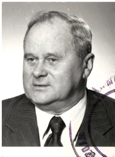
Fotografia Wiktora Głuskiego (prawdopodobnie lata siedemdziesiąte XX w.). Ze zbiorów Instytutu Pamięi Narodowej