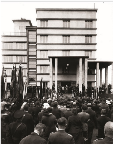
Poświęcenie Domu Legionisty w Krakowie, 1934 r.

Centra artystyczne w niepodległej Polsce (Warszawa, Kraków, Wilno, Łódź, Zakopane) wykształciły własną stylistykę, w której tematyka patriotyczna spontanicznie przybierała zarówno klasyczne, jak i awangardowe formy. W celach propagowania kultury fizycznej władze II Rzeczypospolitej posługiwały się futurystycznym obrazem „Szermierka” Chwistka. Warto zaznaczyć, że poszukiwaniu artystycznych rozwiązań przez pokolenie polskich awangardzistów patronował – w bardziej lub mniej świadomy dla nich sposób – Wyspiański. Z kolei polskim konstruktywistom – Władysławowi Strzemińskiemu, Katarzynie Kobro i Henrykowi Stażewskiemu – zawdzięczamy pierwsze w Europie i drugie na świecie Muzeum Sztuki Nowoczesnej, które powstało w Łodzi. Związek sztuki z patriotyzmem był w polskim międzywojniu swoistym sprzężeniem zwrotnym. Intensywnie poszukiwano stylu narodowego, czego wyrazistą i udaną realizacją była twórczość grupy „Rytm”. Kompozycje Władysława Skoczylasa i Stryjeńskiej, inspirowane rodzimym folklorem, pozostają rozpoznawalne do dziś. To właśnie stylizowana polska ludowość rytmistów zapewniła niekwestionowany sukces sztuki polskiej na Międzynarodowej Wystawie Sztuki Dekoracyjnej w Paryżu w 1925 r. O randze międzywojennej sztuki polskiej świadczyło również kultowe zainteresowanie pawilonem polskim podczas Wielkiej Wystawy Światowej w Nowym Jorku w roku 1939. Jego komisarzem był Stefan Ropp, projektantami – Jan Cybulski, Jan Gralinowski i