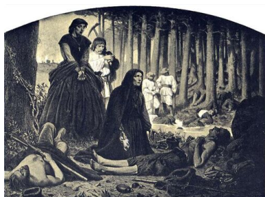
Artur Grottger, Na poboju (cykl Polonia), 1863 r.