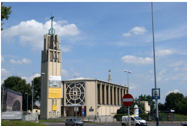
Kościół Matki Bożej Zwycięskiej w Krakowie.

Po sukcesie Gdyni – opartym na jej błyskawicznym rozwoju od wioski rybackiej do miasta portowego, które w 1939 r. liczyło blisko 130 tys. mieszkańców, posiadało drugą co do wielkości na świecie chłodnię przemysłową i było także miejscem legendarnego przekrętu finansowego (wzniesienie budynku poczty kosztowało tyle co opery w Paryżu!) – przyszedł czas na budowę największego projektu II Rzeczypospolitej. Chodzi o Centralny Okręg Przemysłowy, obejmujący 15 proc. terytorium kraju. Składał się on z trzech regionów – surowcowego (Kielecczyzna), aprowizacyjnego (Lubelszczyzna) i przetwórczego (ziemia sandomierska). Miastem, które