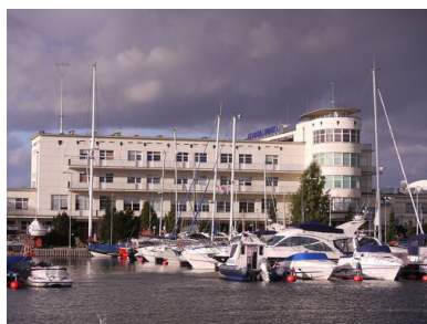
Gdynia - Dom Żeglarza Polskiego, zbudowany w 1937 r.