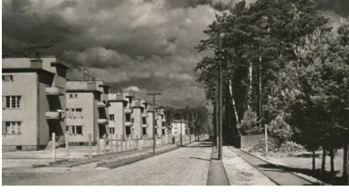
Kolonia robotnicza w Stalowej Woli.