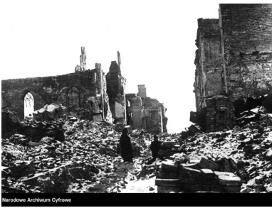
Zruinowane budynki na Starym Mieście, na ul. Świętojańskiej. Z lewej widoczne ruiny katedry św. Jana.