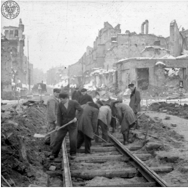
Przywracanie do użytku torów tramwajowych. Warszawa, 1946 r.