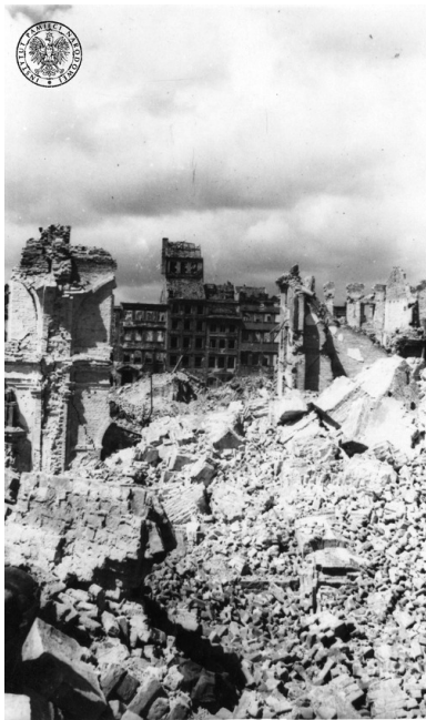
Ruiny Starego Miasta - fragment ryнку, na pierwszym planie ruiny katedry św. Jana - 1945 r.