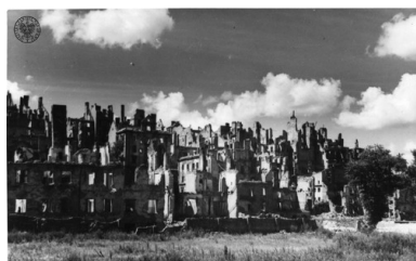
Ruiny Starego Miasta - panorama od strony Wisły - 1945 r.

Niemcy celowo dewastowali obiekty dziedzictwa polskiej kultury i historii, mające dla Polaków szczególną wartość: obalili kolumnę Zygmunta, rozjechali czołgiem płytę Grobu Nieznanego Żołnierza, wysadzili w powietrze Zamek Królewski i Pałac Saski. Wkrótce po upadku walk powstańczych na Starym Mieście spalili mieszczące się tam instytucje, m.in. Bibliotekę Ordynacji Zamojskiej, Archiwum Akt Dawnych oraz Archiwum Skarbowe.