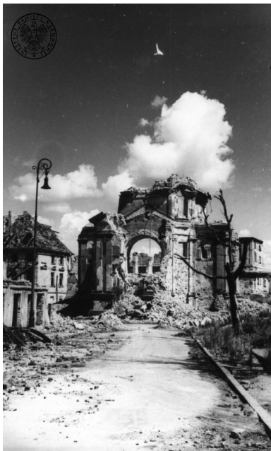
Ruiny kościoła Sakramentek pw. św. Kazimierza na Nowym Mieście