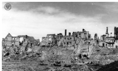
Ruiny Starego Miasta - panorama - 1945 r.