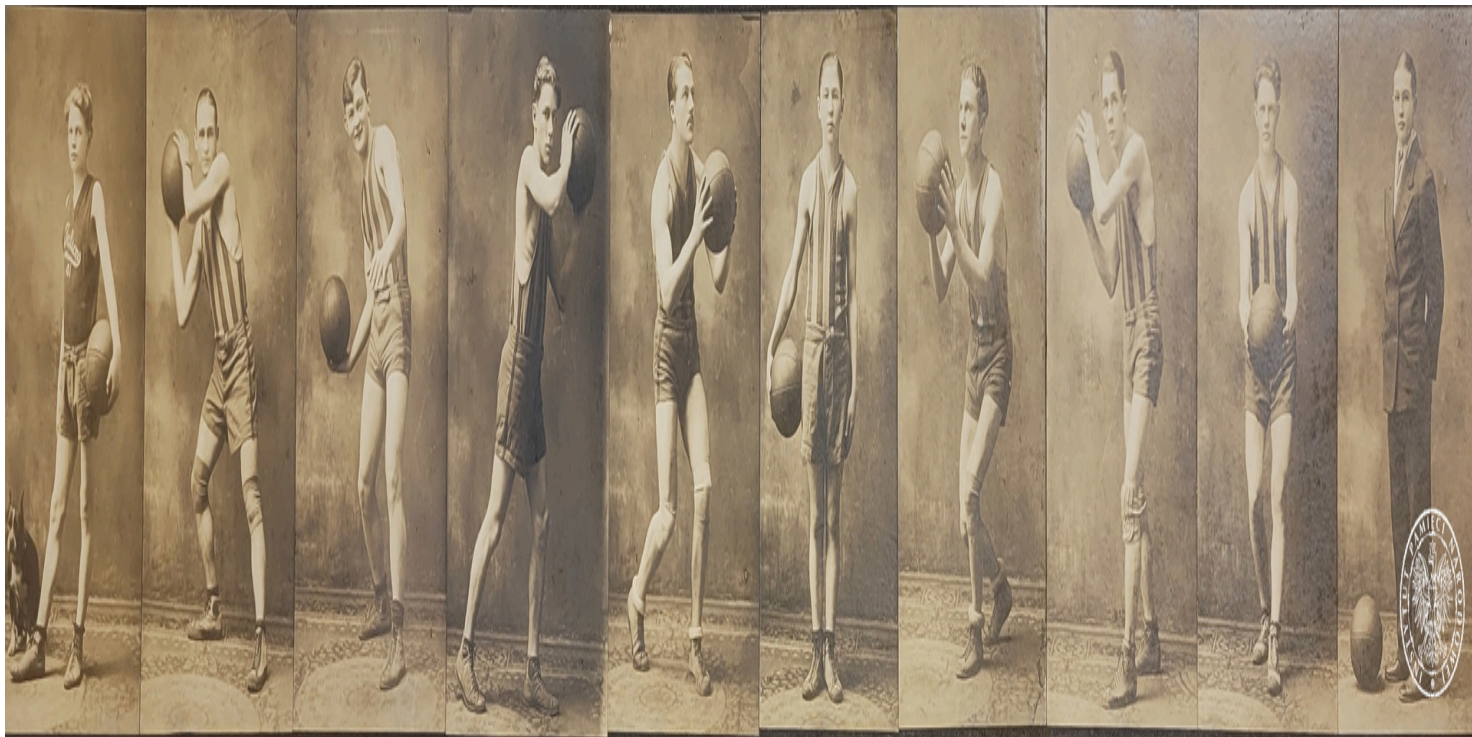
Koszykarze Sokolstwa Polskiego w Ameryce z gniazda nr 41 w New Kensington - panorama

https://przystanekhistoria.pl/pa2/tematy/archiwum-ipn/105633,Tata-wariata-czyli-koszykowka-w-Archiwum-IPN.html