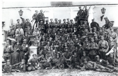
Zdjęcie wykonane przy zamku księcia Radziwiłła po zdobyciu Nieświeża w 1919 r.