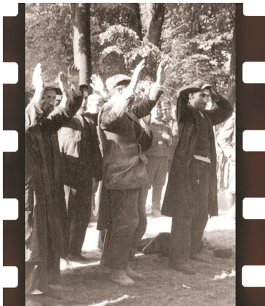
» Wielu Żydów zapędzonych do grabienia zwłok zostało później zastrzelonych przez żołnierzy niemieckich