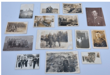
Zbiór fotografii rodzinnych Jadwigi i Zofii Klimkiewicz