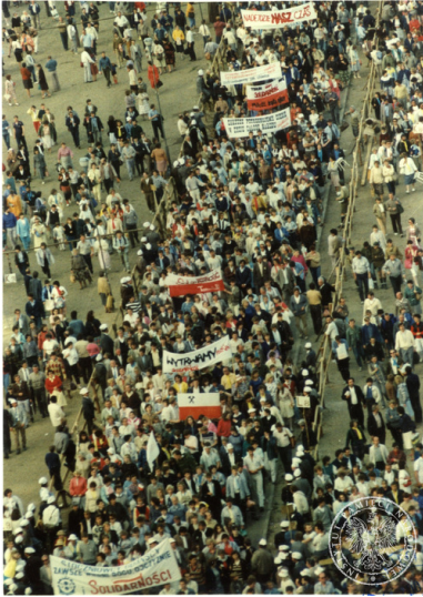
Demonstracja solidarnościowa, która przeszła ulicami Gdańska po mszy św. z udziałem Jana Pawła II na Zaspie, 12 czerwca 1987 r.

współorganizowali wizytę Jana Pawła II w Trójmieście.