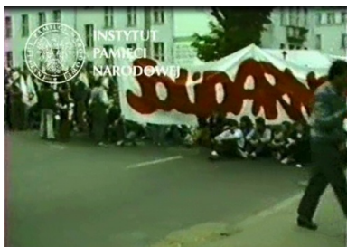
Kadr z filmu operacyjnego SB przedstawiający demonstrację, która przeszła ulicami Gdańska po mszy św. z udziałem Jana Pawła II na Zaspie, 12 czerwca 1987 r.