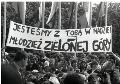
Uczestnicy spotkania Jana Pawła II z młodzieżą na Westerplatte, 12 czerwca 1987 r.

1987 r. Jednak ich specyfiką jest to, że w dość małym stopniu widoczna jest na nich postać papieża. Co najbardziej interesowało fotografów z resortu spraw wewnętrznych, to przede wszystkim uczestnicy uroczystości i transparenty, które mieli ze sobą. Widoczne jest to przede wszystkim na zdjęciach z uroczystości gdańskich na Westerplatte i na Zaspie. Niektóre z nich zrobione są tak, że można rozpoznać osoby trzymające solidarnościowe transparenty oraz znajdujące się w ich bezpośrednim sąsiedztwie. Co ciekawe, w odziedziczonym po SB zasobie nie ma zdjęć ze spotkania Jana Pawła II z chorymi i przedstawicielami służby zdrowia odbytego w gdańskim kościele mariackim. Najwięcej z kolei jest fotografii z budzących największe obawy komunistów uroczystości na Zaspie oraz późniejszej manifestacji solidarnościowej, która przeszła ulicami Gdańska.