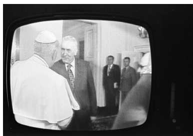
Ujęcie z relacji telewizyjnej z pierwszej pielgrzymki papieża Jana Pawła II do Polski w 1979 r.