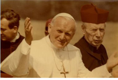
Jan Paweł II w towarzystwie kardynała Stefana Wyszyńskiego, Gębarzewo koło Gniezna, 3 czerwca 1979 r.