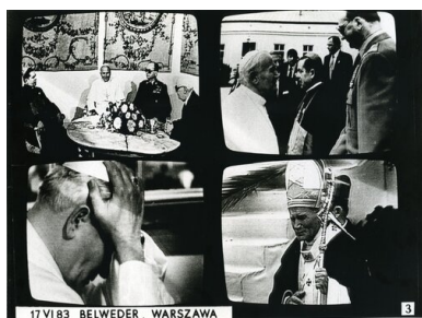
Powitanie Jana Pawła II przez władze PRL, 17 czerwca 1983 r.

W niniejszym tekście pragnę krótko przedstawić materiały, w których posiadaniu jest Oddziałowe Archiwum IPN w Gdańsku, a dotyczące pielgrzymek Jana Pawła II do PRL. Oczywiście najwięcej z nich związanych jest ze wspomnianą wcześniej wizytą papieża w Trójmieście, nie brak również jednak materiałów związanych z pielgrzymkami z lat 1979 oraz 1983.