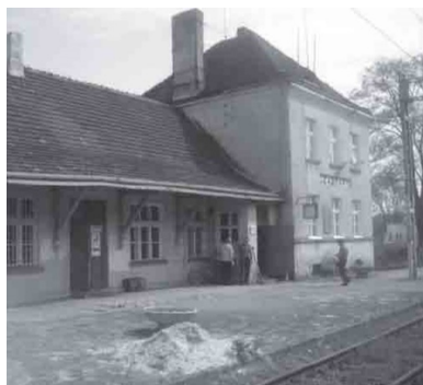
Stacja Czastary.

Od samego początku zakładano również, że celem ataku będą przede wszystkim jadący pociągiem żołnierze sowieccy. „Rudy” już wcześniej miał wydać swoim podkomendnym oficjalny rozkaz rozstrzeliwania na miejscu każdego napotkanego żołnierza sowieckiego, co zapewne należy wiązać z dużą skalą przestępstw i rozbojów, jakich ci ostatni w tym czasie się dopuszczali. Szczególną i zatrważającą plagą były gwałty popełniane przez sowieckich maruderów na kobietach. W końcu stycznia 1946 r. funkcjonariusze PUBP w Wieluniu zatrzymali kilku pijanych żołdatów, którzy właśnie w pociągu relacji Poznań-Katowice wielokrotnie usiłowali dokonać gwałtów na bezbronnych kobietach. 2