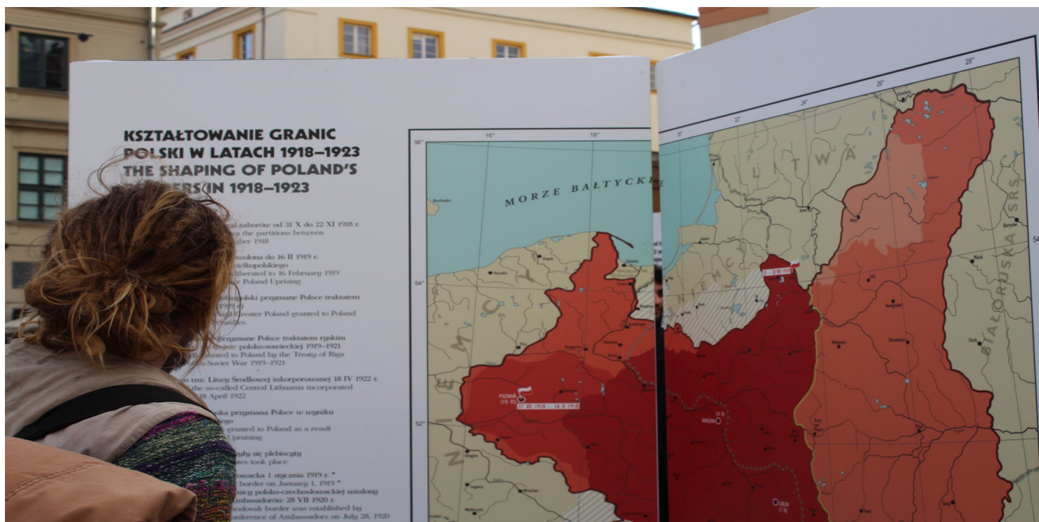
Plansza z wystawy IPN „Ojcowie Niepodległości”

https://przystanekhistoria.pl/pa2/tematy/armia-czerwona/72033,Wojna-polsko-bolszewicka-1920-roku.html