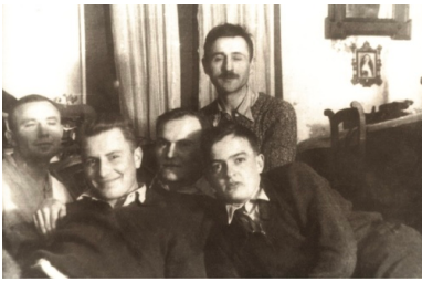
Uczestnicy I kursu maturalnego „Kuznicy”, 1940-1942