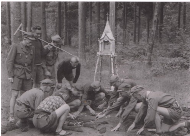
Budowa kapliczki na obozie letnim, Karpacz 1946 r.